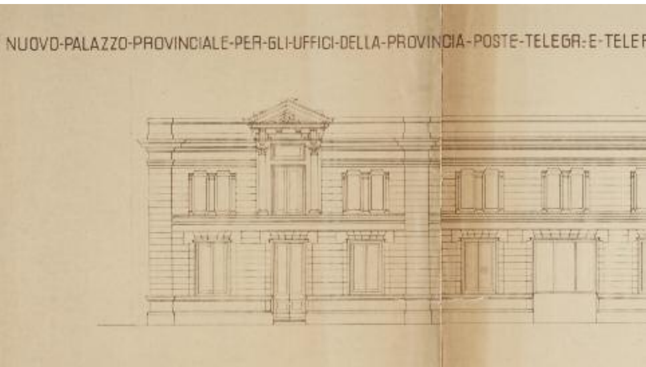
Nuovo prospetto del palazzo verso via Vigoleno conservato presso l'Archivio di Stato di Piacenza in VII A4/1

Dai carteggi successivi è facile intuire che i lavori non furono sospesi. Il progetto per la facciata del nuovo Palazzo Provinciale verso via Vigoleno fu affidato all'architetto Manfredi Manfredi, conte, all'epoca deputato per la Provincia di Piacenza a Roma.