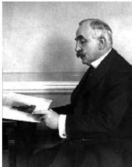
L'ing. Ettore Martini, Presidente dell' Deputazione Provinciale dal 1948 al 1956

Tale regime di carattere provvisorio fu soppresso con la legge 9 marzo 1951 n. 122, che riconfermava il Consiglio Provinciale elettivo come organo deliberativo principale, salvo sopprimere l'Ufficio di Presidenza previsto dalle leggi anteriori, in quanto tale Presidenza fu affidata al Presidente di quella che fu denominata Giunta Provinciale al posto di Deputazione Provinciale e ciò allo scopo di non creare equivoci e confusioni con la denominazione di "deputato" riservata soltanto ai Deputati al Parlamento. La prima Giunta fu presieduta dall'Ing. Ettore Martini (1951-1956) poi dal Sen. Avv. Alfredo Conti (1956-1958).