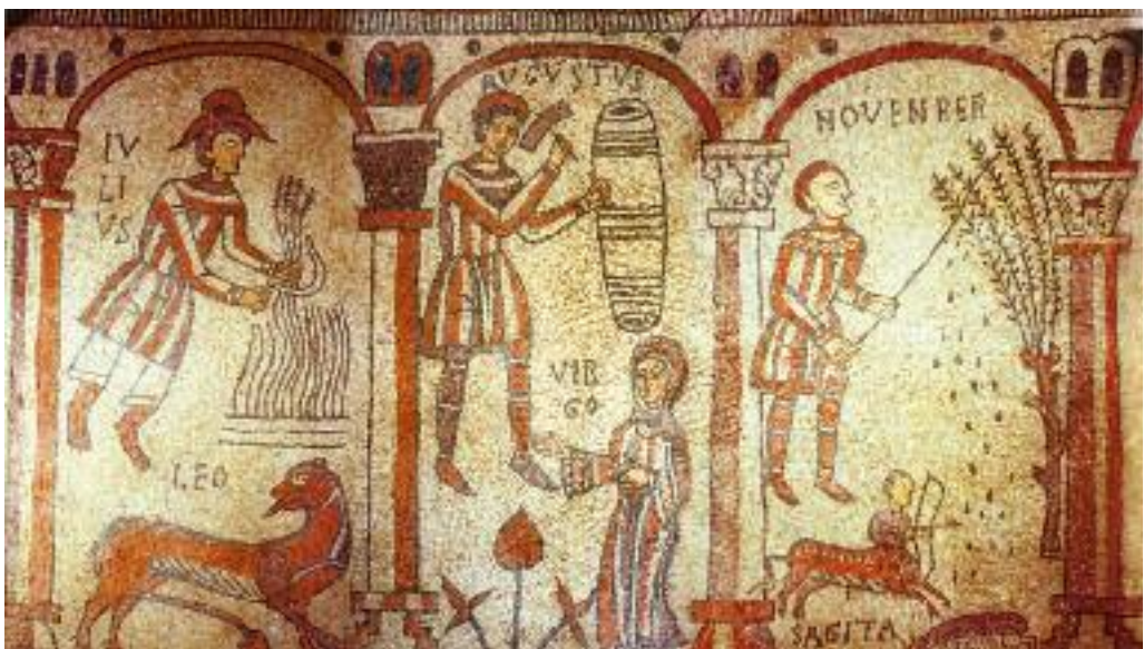
Mosaici nella cripta di San Colombano a Bobbio

Tra questi progetti spiccano soprattutto quello relativo al camping lungo il Trebbia e allo sfruttamento turistico del fiume, con particolare riguardo alla spiaggia di San Martino.