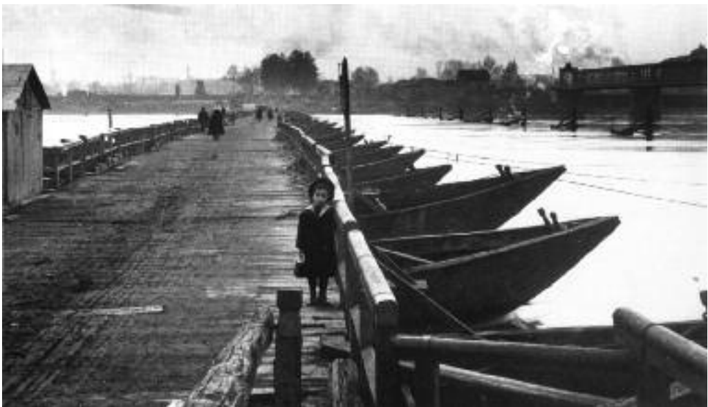
Ponte di barche sul Po