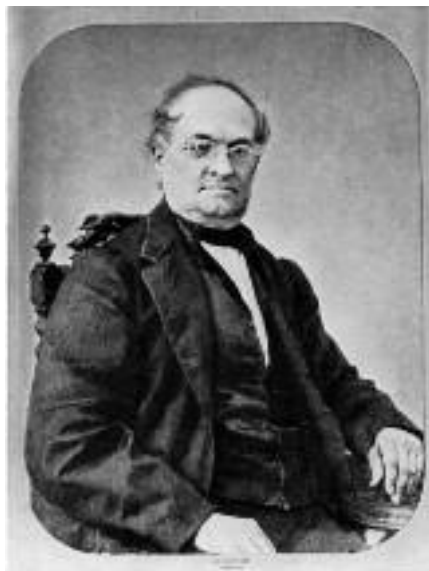
L'avvocato Filippo Grandi , primo presidente del Consiglio Provinciale di Piacenza

In occasione del venticinquennale della sua scomparsa, la Deputazione provinciale decise di collocare un busto del compositore nella sala Consiglio, opera dello scultore piacentino Pier Enrico Astorri che lo realizzò nel 1926. (2)