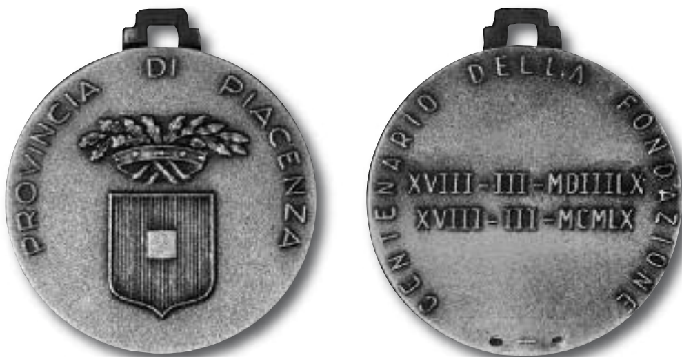
Medaglia coniata dalla Provincia a celebrazione del centenario

Molte imprese e svariati professionisti, locali e non, parteciparono ai lavori per la costruzione del Palazzo della Provincia (9): F.lli Arnoldi di Milano - per la copertura in holzacement ; Impresa Bassi e Spelta (di Piacenza) che presenta un'offerta della ditta Neri Carlo di Domodossola per la fornitura e la posa in opera del marmo per lo zoccolo ; ditta Biavati Palazzo provinciale - copertura del salone delle poste Velario ; Ing. Diego Blesio - incaricato del collaudo dei lavori di decorazione della facciata del nuovo palazzo provinciale ; Ditta Luigi Brusotti (Milano) - per la fornitura e posa in opera dei vetri del salone della posta ; Ditta Rabaglia (Piacenza) - per posa lastre ; Ditta Finetti - per l'impianto di apparecchi di illuminazione e per gli impianti elettrici ; Ditta Freschi - per copertura in ferro del palazzo della posta ; Ditta Gamba Arnaldo - per la verniciatura dei serramenti e delle inferriate del magazzino ; Società Koerting - per l'impianto riscaldamento ; Società Lodigiana Lavori in cemento - per la pavimentazione del salone delle poste, dell'androne e dell'atrio ; Società Marmifera Veronese - per la realizzazione dello scalone in marmo ; Ditta Martini - per serramenti ed inferriate ; Ditta Mazzoni e Magnani - per l'impianto per l'acqua potabile, le latrine, i lavabi e il Gas ; Ditta Edoardo Omorame, Caccialanza, Bronzini, Martini - per la costruzione del montatelegrammi ; Ditta Ronchetta Giulio e Perino Secondo - per il riscaldamento .