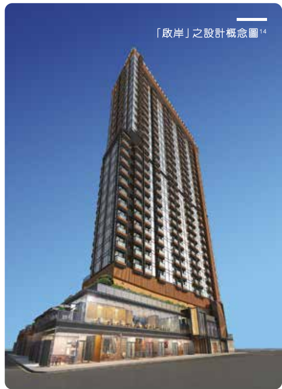
「啟岸」之設計概念圖 14