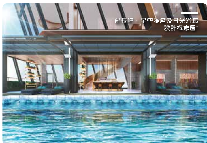
船長吧、星空雅座及日光浴廊設計概念圖 2