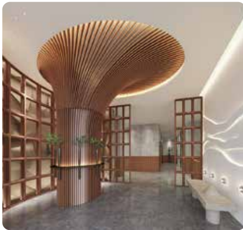
地下住客入口大堂設計概念圖 2