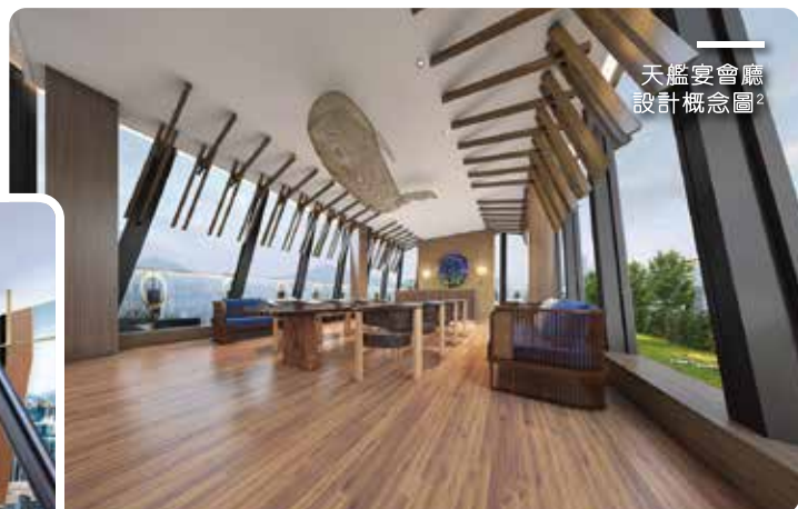
天艦宴會廳設計概念圖 2