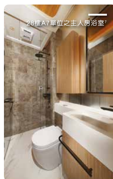
28樓A7單位之主人房浴室 7