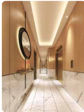
住宅樓層電梯大堂設計概念圖 2