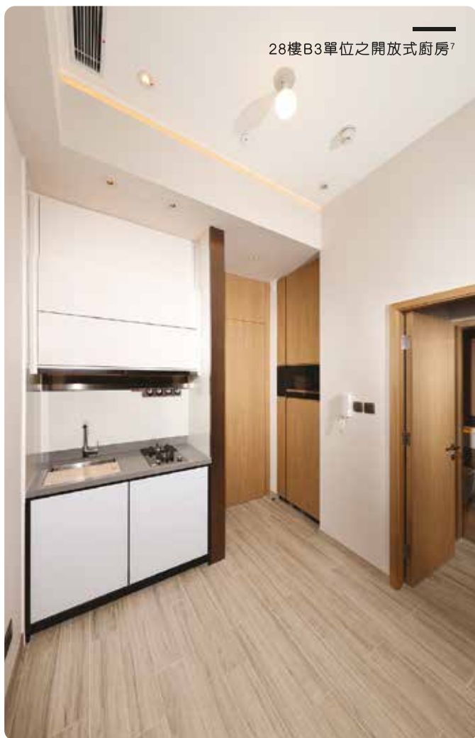
28樓B3單位之開放式廚房 7