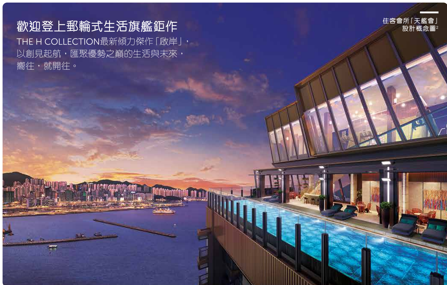
住客會所「天艦會」設計概念圖 2

THE H COLLECTION最新傾力傑作「啟岸」，以創見起航，匯聚優勢之巔的生活與未來，嚮往，就開往。