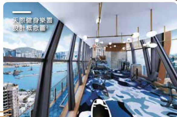
天際健身樂園設計概念圖 2