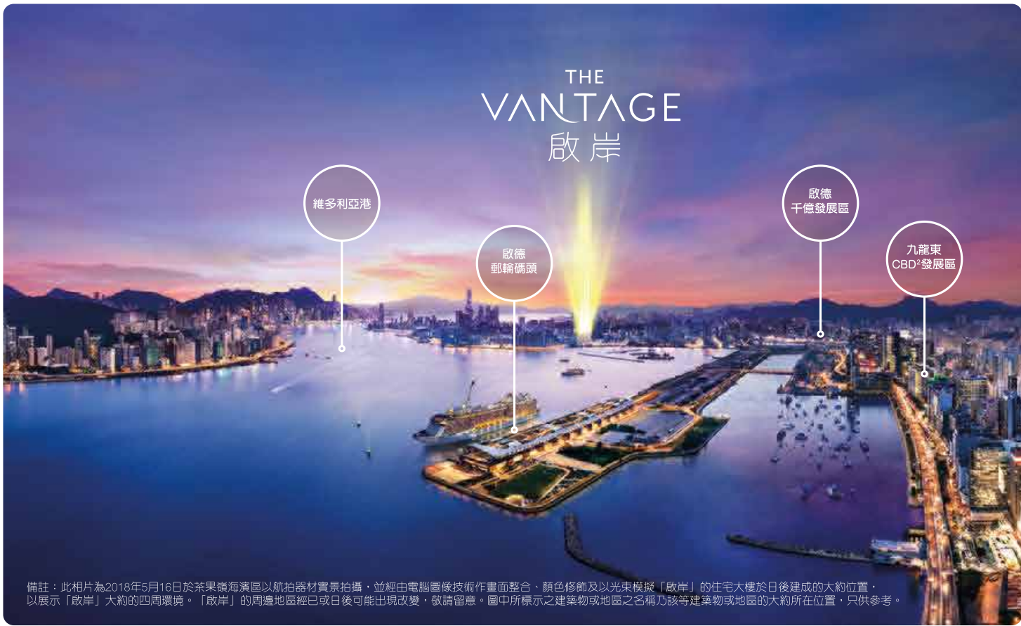
備註：此相片為2016年5月16日於茶果嶺海濱區以航拍器材實景拍攝，並經由電腦圖像技術作畫面整合、顏色修飾及以光束模擬「啟岸」的住宅大樓於日後建成的大約位置，以展示「啟岸」大約的四周環境。「啟岸」的周邊地區經已或日後可能出現改變，敬請留意。圖中所標示之建築物或地區之名稱乃該等建築物或地區的大約所在位置，只供參考。