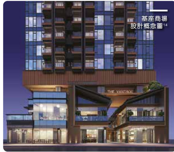
基座商場設計概念圖 14

銷售代理： 恒基物業代理有限公司 HENDERSON PROPERTY AGENCY LIMITED www.hendersonpa.com.hk