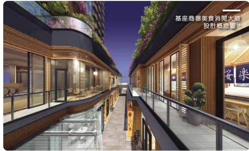
基座商場美食消閒大道設計概念圖 14