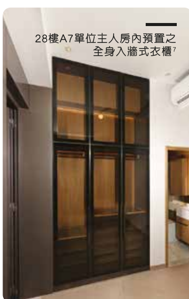
28樓A7單位主人房內預置之全身入牆式衣櫃 7