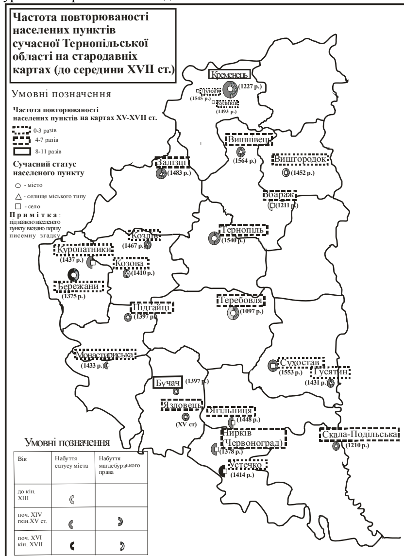
Рис. 1. Частота повторюваності населених пунктів Тернопільської області на стародавніх картах (до середини XVII століття)

Частота повторюваності назв населених пунктів Тернопільської області показано на рисунку 1. Важливим моментом є дослідження змісту тих карт, які не увійшли до альбому репродукцій [2]. Таких карт нами опрацьовано 33. На них присутні 53 населених пунктів сучасної Тернопільської області. 23 з них повторюються (вони представлені на атласі репродукцій – [4], а 30 – це нові назви. Сучасний статус міст мають 13 поселень, селищ міського типу – 10 і статус сіл – 30 поселень.