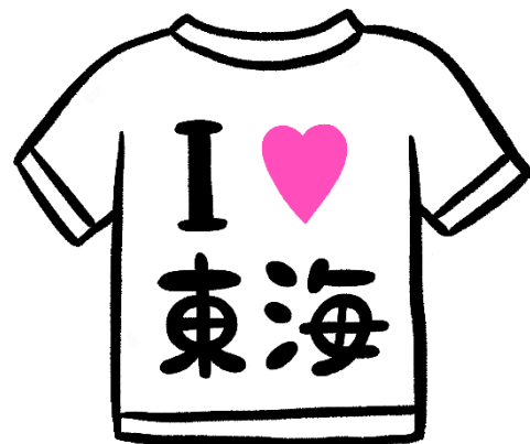
〈キャンペーン ロゴ〉