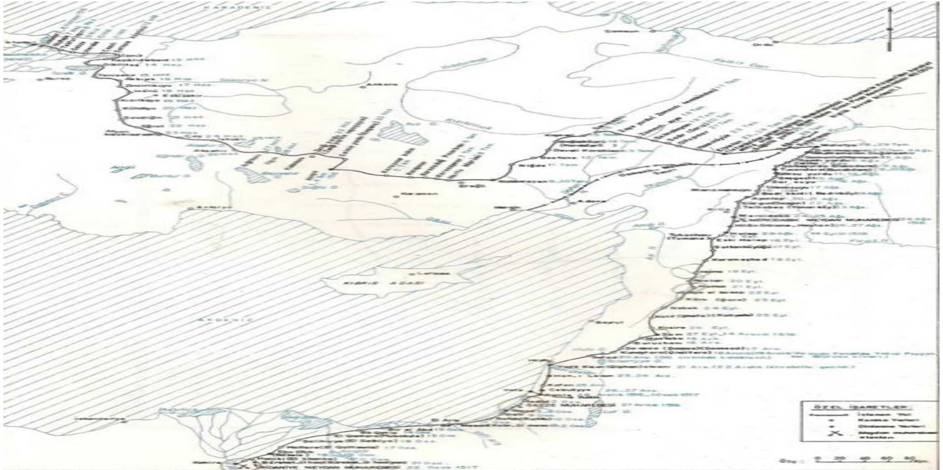
Ek 3: Mısır Seferi'nin Menzillerini gösteren harita 101