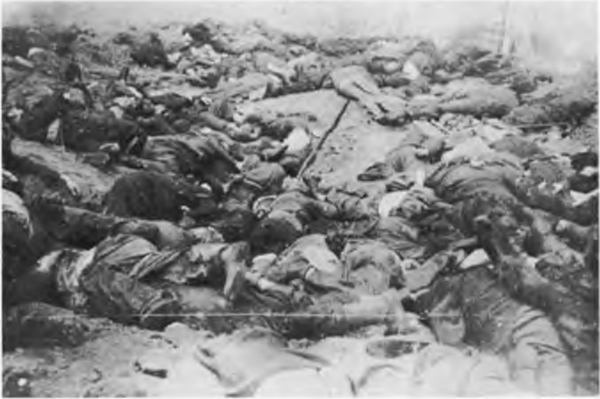
Жертви НКВД — помордовані більшовиками українці в червні 1941 р. Замарстинівська в'язниця

Україні, зокрема польську, жидівську, навіть, як вони не були прокомуністичні.