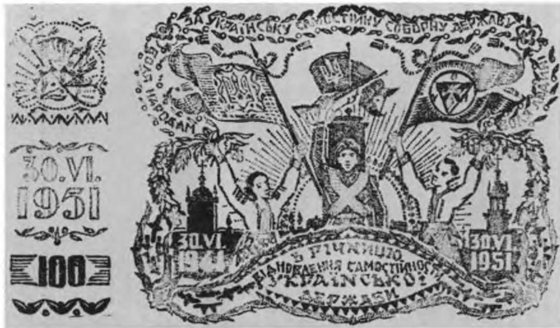
Виданий в Україні в 1951 р., в 10-річчя Акту 30 червня 1941 р., бон на 100 карб., на потреби визвольної боротьби. Бон у двох кольорах -- чорному і червоному.