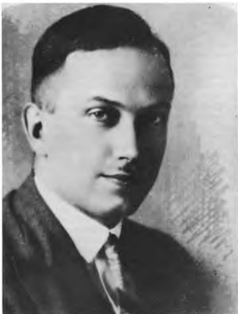
Юрій Липа, лікар, поет і письменник, загинув в УПА.