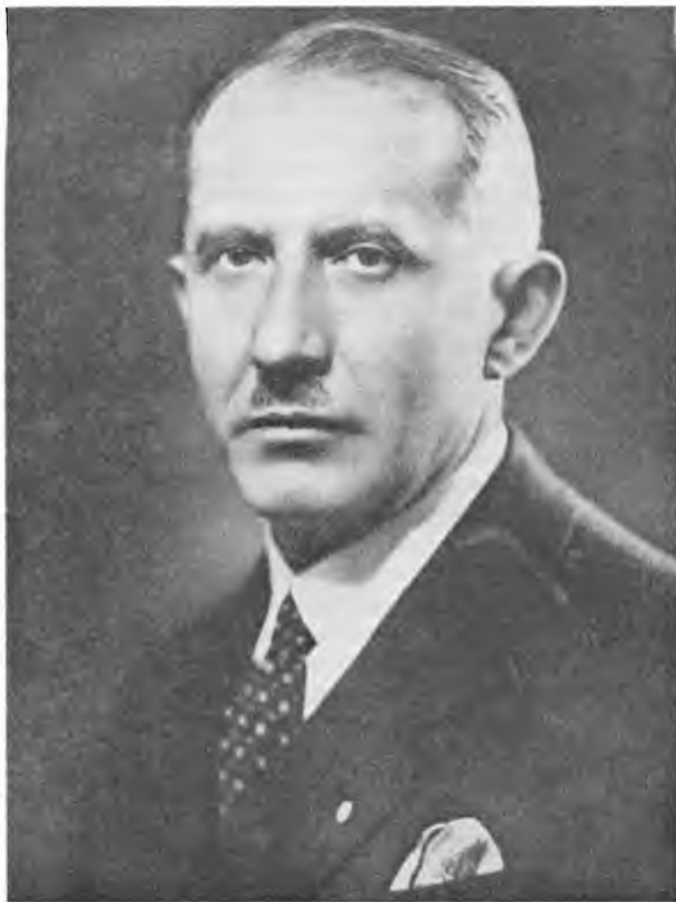
Провідник ОУН полк. Є. Коновалець

В усіх справах практичної політики ОУН виходить лише з тих всеукраїнських державницьких позицій.