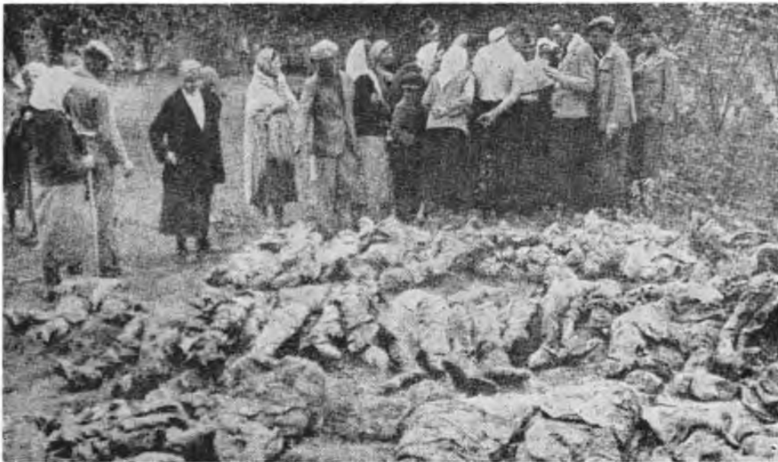
Большевиками помордовані в 1941 р. — Зах. Україна