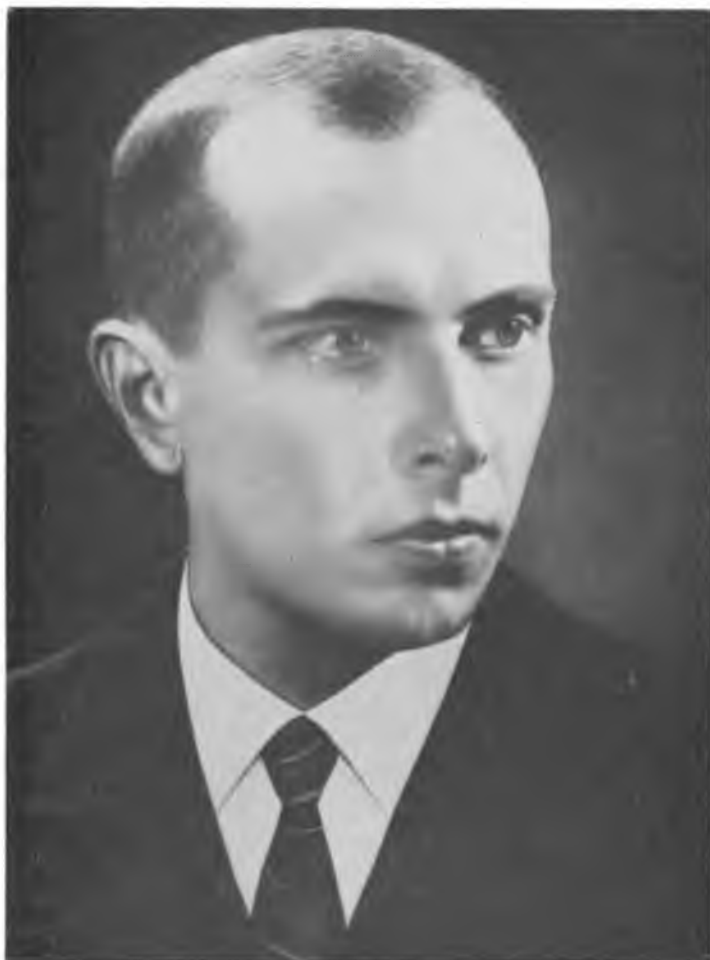
Сл. п. СТЕПАН БАНДЕРА

Надхненник і організатор революційно-визвольної боротьби українського народу. Провідник Організації Українських Націоналістів.