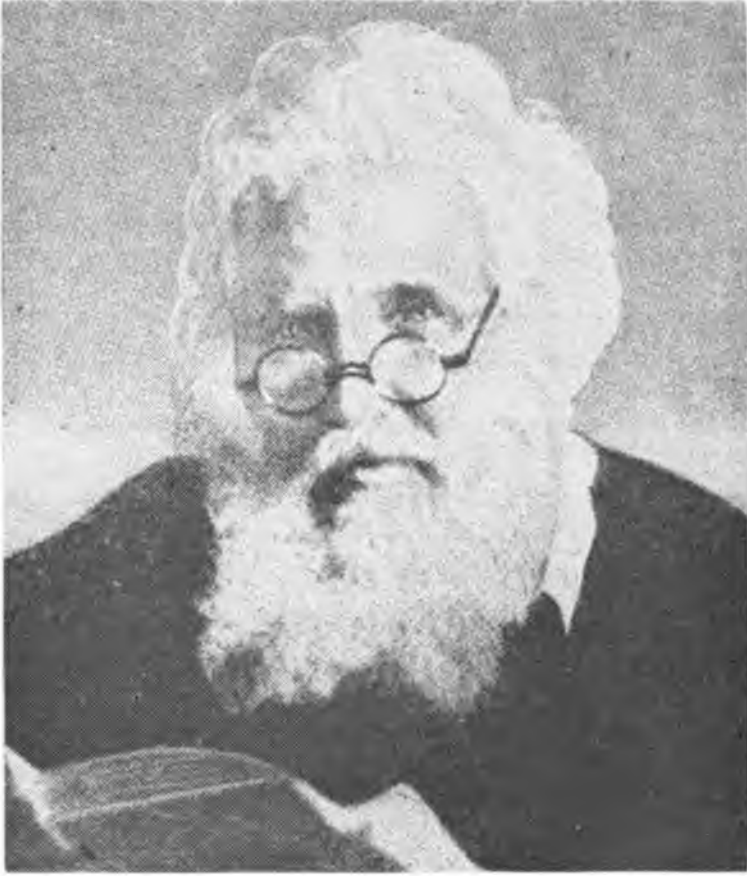
Митрополит Львівський граф Андрей Шептицький

Від Уряду ним покликаного до життя очікуємо мудрого, справедливого проводу та заряджень, які узгляднили б потреби й добро всіх замешкуючих наш край громадян, без огляду на це, до якого віроісповідання, народности й суспільної верстви належать. Бог нехай благословить усі Твої праці, Український Народе, і нехай дасть усім нашим Провідникам Святу Мудрість з Неба.