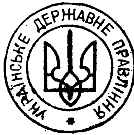
Державна печатка Українського Державного Правління

Я свідомий теж певних колізій поміж інтерпретаціями наших Актів, Декретів, номінацій у фактичному і формально-правному відношеннях. Автором тих документів був я сам, без змоги консультації, бо це був час, де треба було все наново самому щохвилини рішати. Ці рішення спадали на мене, тоді ще без державно-політичного, але з революційним досвідом політика. Я не аналізував документів ані з точки зору міжнародно-правної, ані формально-юридичної, не давав комісіям укладати документи, для чого ані часу, ані змоги не було.