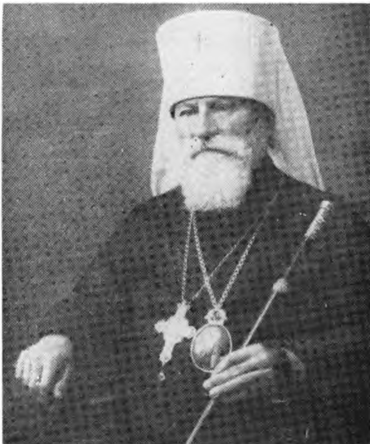
Єпископ Української Православної Церкви пізніший митрополит Полікарп

мусять працювати спільно, бо в єдності сила і ту єдність мусимо показати на ділі.