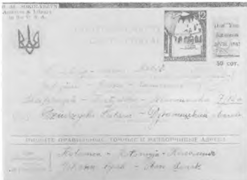
Поштова картка з 23. 8. 41. Большевицький герб перестемпльовано українським тризубом і написом Повітової Управи в Коломиї — українською владою

вати своїх „носіїв лицарських хрестів” і пруських баверів та юнкерів колхозами, як нового типу приватною поміщицькою власністю!