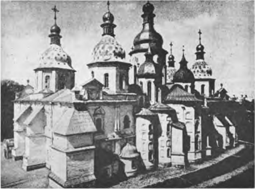
Собор св. Софії в Києві