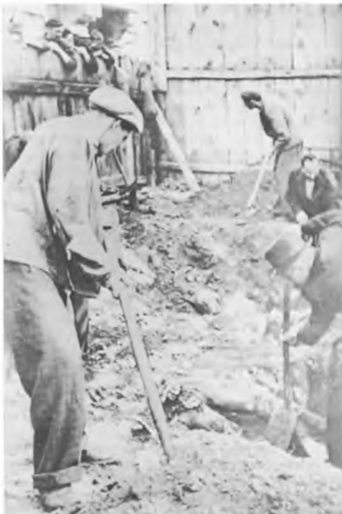
Викопують помордованих українців у червні 1941 р. Львів. казимирівська в'язниця