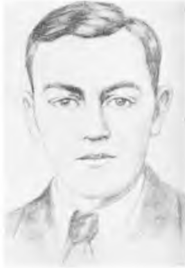
Микола Лемик Провідний Член ОУН

Народ зрозумів, що оце повстала в Україні третя , самостійницька сила, яка має свій світ ідей, свої шляхи дії, свою мету, скеровану виключно на унезалежнення української нації, щоб вона була господарем на своїй землі. У ряди цієї сили включалися найкращі елементи на ОСУЗ; — Донбас, Одеса, Кубань, Крим, Київщина, Харківщина, були засіяні ідеями цієї третьої сили; організаційна мережа, дуже обережно будована, приготувляла народ на затяжну боротьбу після бравурного розбурхання його у перші два місяці перебирання влади у власні руки і будовання державности. Донбас, заповнений розкуркуляченим селянством, яке залишило свої села, своєчасно великою частиною колективізованого селянства, що рятувало себе перед голодовою смертю, був у глибині своєї душі український, антиросійський. І це так далеко, що деяка кількість автохтонних росіян, не згадуючи інших, неросійських меншостей, включалися в антинімецьку і антибольшевицьку акцію ОУН, і йшла за виразними паслами УССД.