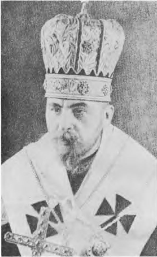
Єпископ, пізніше Львівський Митрополит, тепер Верх. Архиепископ і Кардинал Йосиф Сліпий