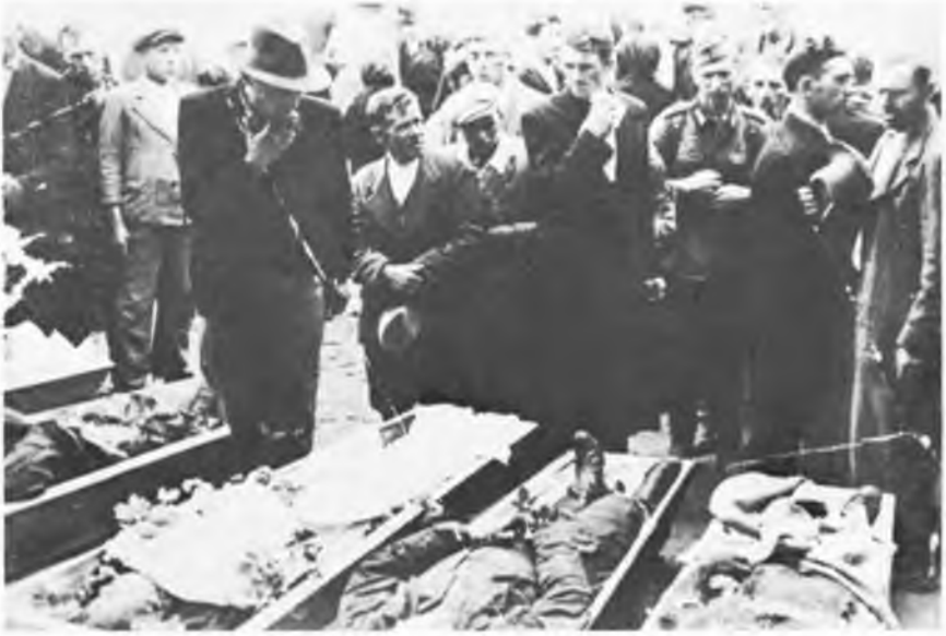
Помордовані українці більшовиками в Самборі, липень 1941 р.

Натомість фізичне знищення наших братів тут велике. Нам розповідають: