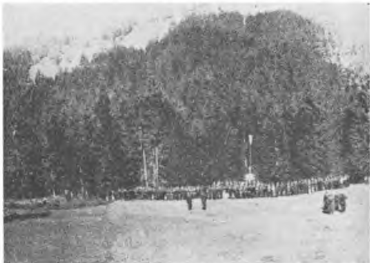
Старшинська школа УПА складає присягу на вірність Україні (1944 р.)

бунту. Політична наївність руйнує тоді найкращі намагання народу і його збройного вияву — війська — на довгі роки.