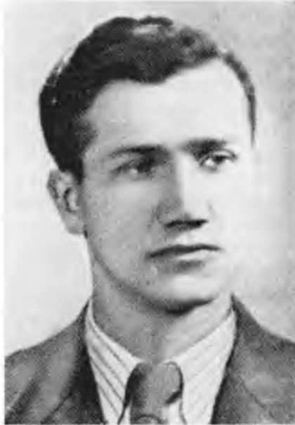
Дмитро Маївський-Косар-Тарас член Проводу ОУН

шувалися і йшли в Україну, що було найбільш почесним і найбільш небезпечним завданням ОУН.