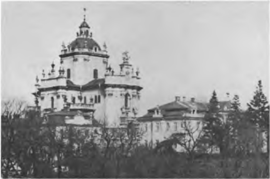
Собор св. Юра у Львові

вже зустрінули крайових підпільників ОУН. Після неймовірних труднощів ми нарешті добились до св. Юра у Львові... Коли з'явився провідник ОУН на Львів, я запропонував наступний план дії на найближчі години. На основі аналізу фактів немає ніяких даних на те, що німці сприятимуть нашій державності, теж немає підстави припускати, що нам вдасться проголосити відновлення державности, як центральний акт в столиці України — Києві. Отже мусимо центрально діяти у Львові і наші плани достосувати до нової ситуації. Німці без великих труднощів посуваються вперед і дуже швидким темпом. Успіх внеможливить їм холодну аналізу ситуації і врахувати перспективу простору і іншу, як західня, стратегію Москви, отже можуть внеможливити нам здійснення нашого плану — доконаних фактів у Києві.