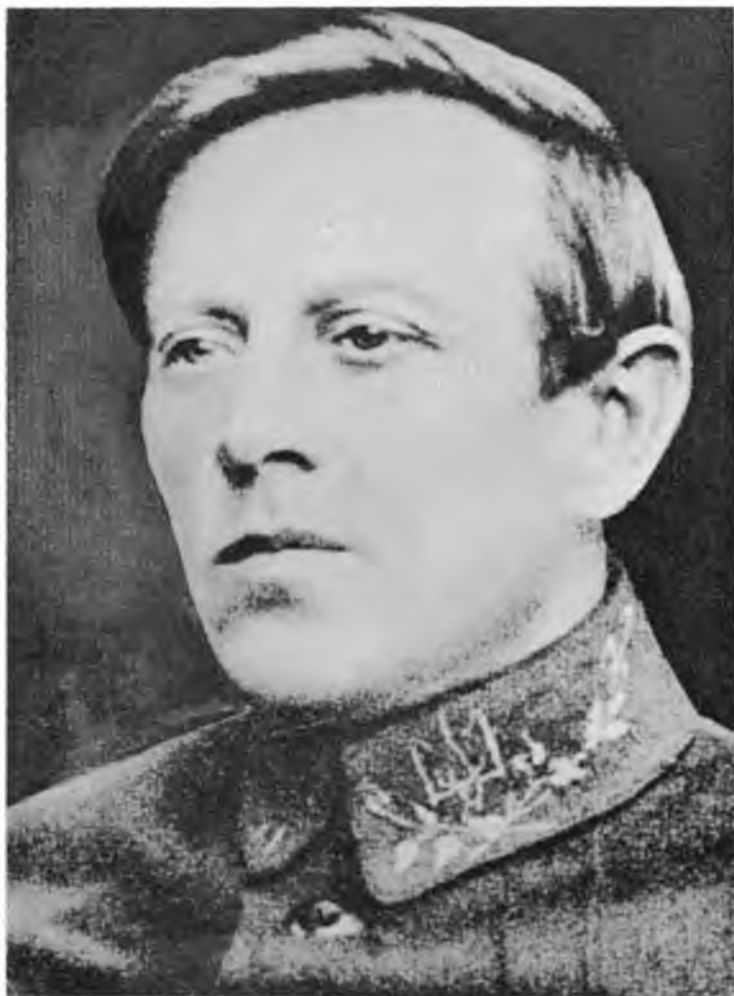
Голова Директорії і Головний Отаман Армії УНР Симон Петлюра

можливити Гестапові переворот із середини проти Голови УДП і УДП взагалі, переключити його на якусь крайову чи прибічну раду коляборантського типу при Франкові чи Кохові, ліквідацію і компромітацію УРЯДУ і проголошеної державности. Окрім комплексу організаційних питань, Бандера, Габрусевиц і я обговорили теж питання дальшої дії УДП в підпіллі, згідно концепції, з'ясованої мною на останньому історичному засіданні Проводу ОУН 10 липня 1941 р. у Львові.