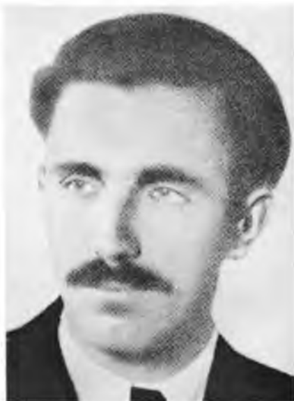
Генерал Дмитро Грицай- Перебийніс, шеф штабу УПА і член Проводу ОУН

рівнорядні партнери — два окуповані одним і тим самим ворогом народи, з яких ні один не мав суверенітету над територією іншого і ніяких претенсій більше польське підпілля „ВІН” на українські землі не зголошувало, так, як малярська армія, з якою переговорювала пізніше делегація УГВР. У своїй збірці документів „Дойчлянд унд Україне”, виданій німецьким Ост-європа-Інститутом у Мюнхені, під дирекцією професора д-ра Ганса Коха, 1956, стр. 193, Р. Ільницький так з’ясовує м. ін. моє суттєве рішення: „Засідання відкрив Ярослав Стецько коротким з’ясуванням політичного становища. Перший заступник Голови ОУН аргументуючи довів, що немає вже ніякого сумніву щодо того, що Німеччина не має в плані визнати суверенність українського народу. Він доказував, що вже в найближчих днях мусимо рахуватися з ув’язненням Українського Уряду. Він прагне, як голова Уряду, перебрати на себе всю відповідальність за події останнього тижня і не думає втечею уникнути відповідальности. У протилежності до нього мусять усі члени Уряду і, передусім, члени Проводу ОУН, уникнути