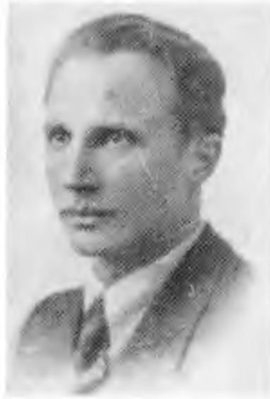
Полковник Василь Сидор-Шелест, Командир УПА-Захід

ув'язнення і перебрати на себе обов'язок даліше керувати визвольною боротьбою українського народу. На основі свого рішення не здавати посту голови Уряду, він передав провід ОУН Миколі Лебедеві. У випадку його (Стецька) ув'язнення має Лев Ребет перебрати становище голови Уряду і вести з підпілля далішу боротьбу від імені Уряду. Усі приявні заявили свою однозгідність з ходом думок Ярослава Стецька. Зокрема ж усі були у тому повної однозгідности, що німецький Райх веде виключно колоніальну загарбницьку війну, а в ніякому випадку визвольну війну.