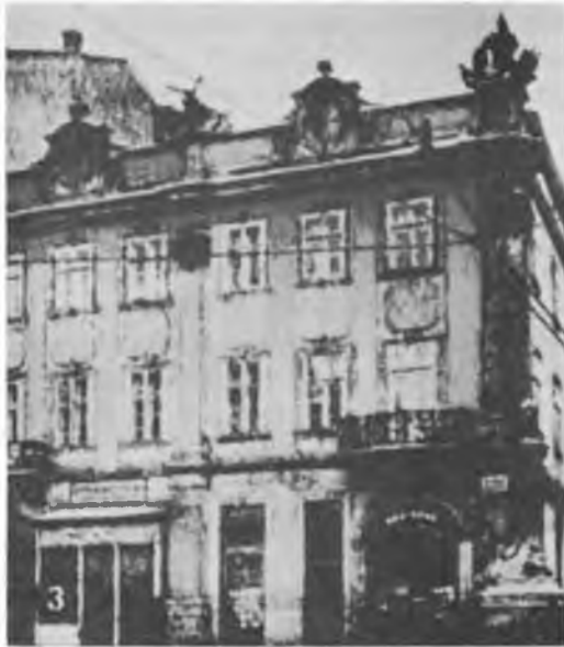
Будинок „Просвіта” у Львові, де проголошено Акт 30 червня 1941 р.

з Україною проти Росії на базі їх національних незалежних держав. Українська армія зможе вирішально причинитися до пропраної Росії. Український народ стоїть незмінно у боротьбі від 1917-20 рр., коли силою зліквідовано його державність, але приходить час її відновлення у нав'язанні до світлих історичних традицій нашої нації. У кожній ситуації українська нація мусить виявляти свою власнопідметну волю до національно-державного життя і тому необхідно проклямувати відновлення державности. Світ мусить довідатися із цього Акту, як знає із боротьби, що українська нація не буде нічим тяглом і не буде воювати за чужі інтереси, крім своїх власних.