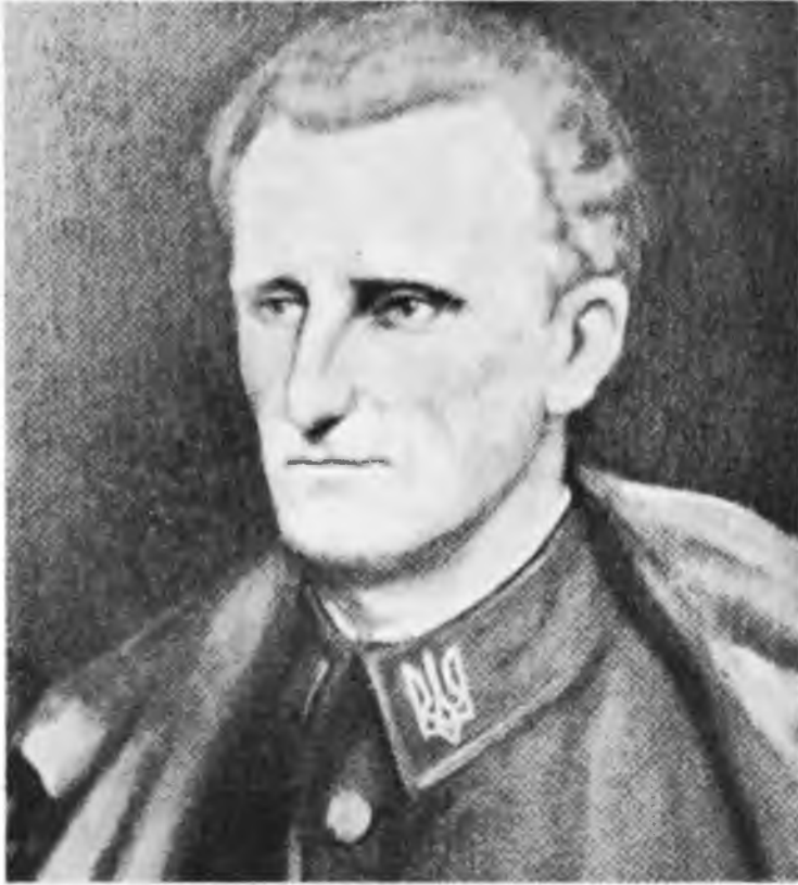
Генерал-хорунжий Роман Шухевич — (Тарас Чупринка) Головний Командир УПА, Провідник ОУН на українських землях і Генеральний Секретар УГВР

наше, було все завдання, як співплануючого нашу політичну дію.