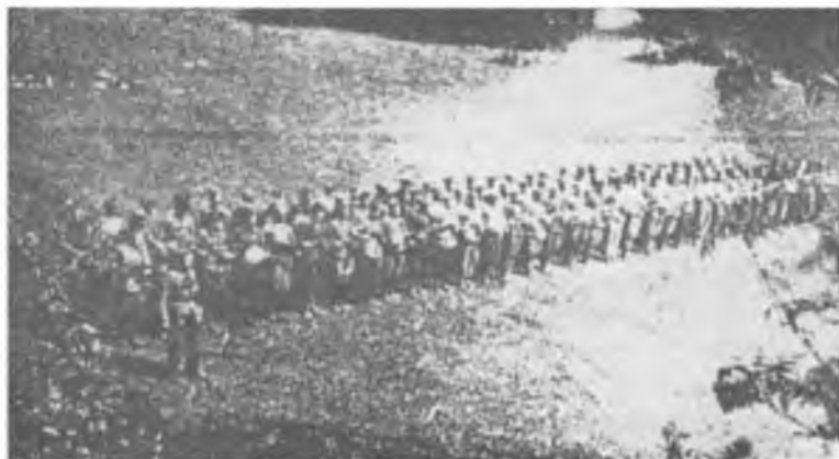
Острівський курінь УПА