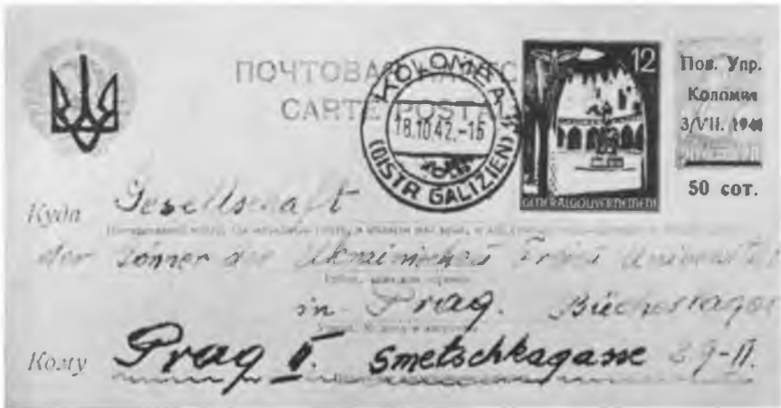
Поштова картка з 18. 10. 42. Большевицький герб перестемпльовано українським тризубом і Повітовою Управою в Коломиї 3 липня 1941 р.

українські спортові товариства, які творилися після відходу москалів і встановлення „Райхскомісаріату Україна”.