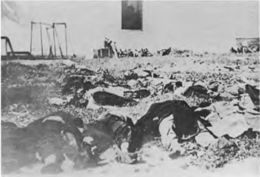
Українські жертви терору НКВД у Львові, літо 1941 р. Витягнені з замуrowаних келій в'язниці Замарстинова для устійнення осіб помордованих

робити негайно, сьогодні таки у Львові, Роман Шухевич відповів, що він повністю поділяє мої побоювання й треба діяти за таким пляном, як диктує ситуація. Узгіднивши це, ми розійшлися. Роман додав, що не зможе бути у „Просвіті” на проголошення, бо повинен бути на похороні брата. Мусить допомогти прибитим торем батькам і взагалі повести усе діло. Пришле о. д-р Івана Гриньоха, який був капеляном куреня.