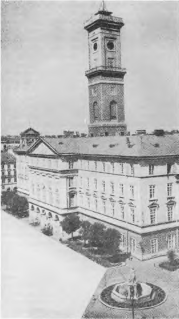
Ратуша у Львові