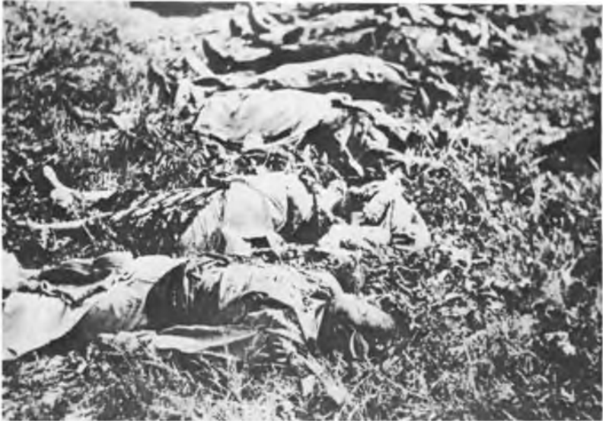
Витягнені для ідентифікації жертви большевицького терору українці-діти В'язниця „Бригідки”

Усіх нас страшенно пригнобили були вістки про розкриття масового вбивства наших людей НКВДистами в львівських тюрмах. Шухевич якраз розшукував свого замордованого брата. Я — на жаль — не мав часу тіти до тюрем поглянути на це пекло і віддати в той день честь мученикам.