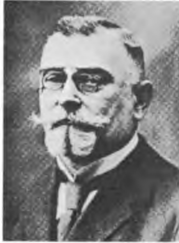
Кость Левицький найвизначніший політичний і суспільно-громадський діяч Галичини кінця 19 і початку 20 вв., президент Української Національної Ради у Львові, створеної в липні 1941 р. як український передпарламент в наслідок Акту 30 червня 1941 р.

версію ворогові із середини, але, з іншого боку, є теж правдою, що процес розкладання відповідальности поширився на ширше коло, на інституції різного, іншого виду. Включати їх у великий процес будівництва обмежувало значення і впливи ОУН, якщо глибше аналізувати соціологічні процеси взагалі. І Митрополит Шептицький і Єпископ Полікарп і президент Кость Левицький і ген. Всеволод Петров і пов'язання з президентом УНР А. Левицьким і гетьманом Скоропадським — у тому чи іншому відношенні, у тому чи іншому засягу, це все було самообмежування ОУН. І не ця чи інша формула була вирішальною, але фактична інтерпретація її в житті, фактична дія у зв'язку з нею.