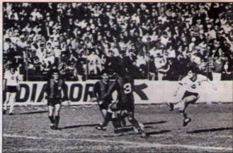
De amor y de sombra. El rechazo de Ormeño para uno de los tres goles con los cuales Colo Colo se reencontró con la victoria ante Huespedes. Abajo, uno de los penales de Guzmán, con los que Unión volvió a poner en tierra al cuadro albo.

Como Magallanes y Rangers se empujaron mutuamente al empatar sin goles el sábado en Talca, a