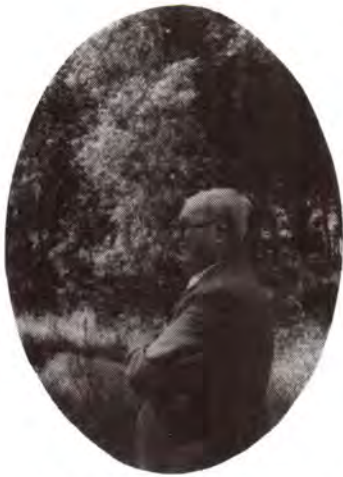
De schrijver bij de weel De Doolman te Heinkensand, 1993.

Colofon "Huis aan huis in Heinkensand, een rondwandeling omstreeks 1900."