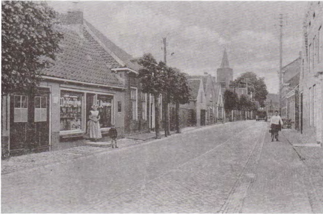
De Dorpsstraat omstreeks 1910.