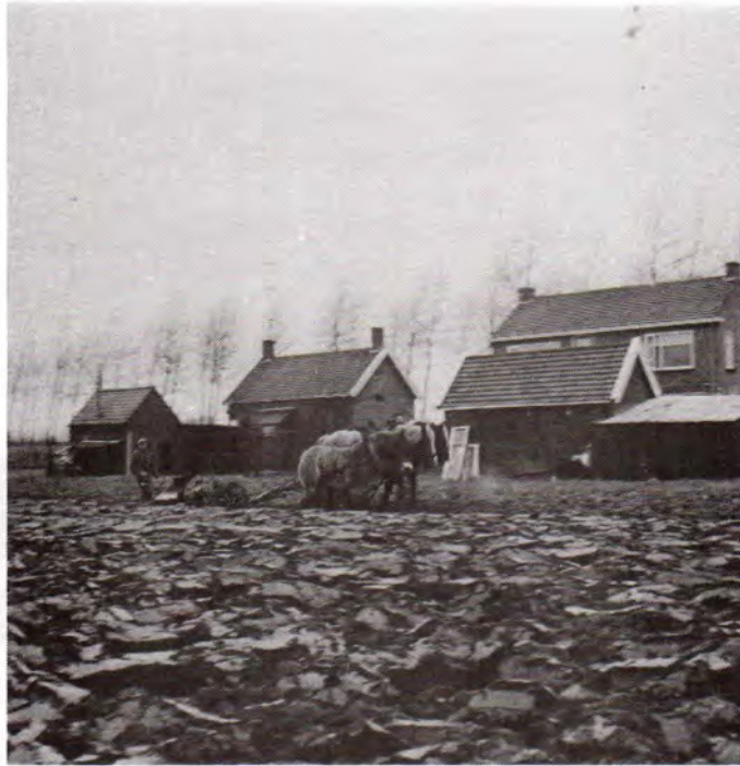
Het ploegen van het bouwland tussen de Kraaiendijk, Clara's Pad en Stene Vate in 1966, thans bebouwd met een woonwijk.