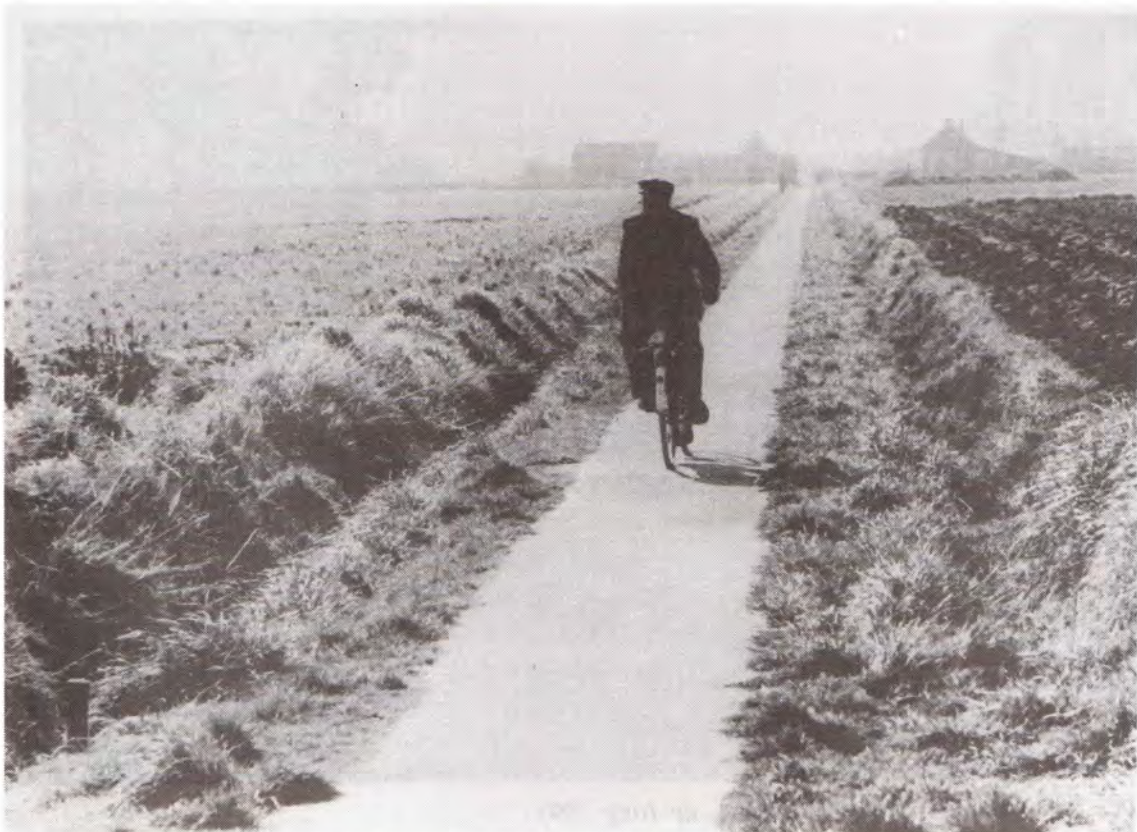
Het Kerkepad gezien vanuit de richting van de Kerklaan. Foto GA. Borsele, ca. 1960.