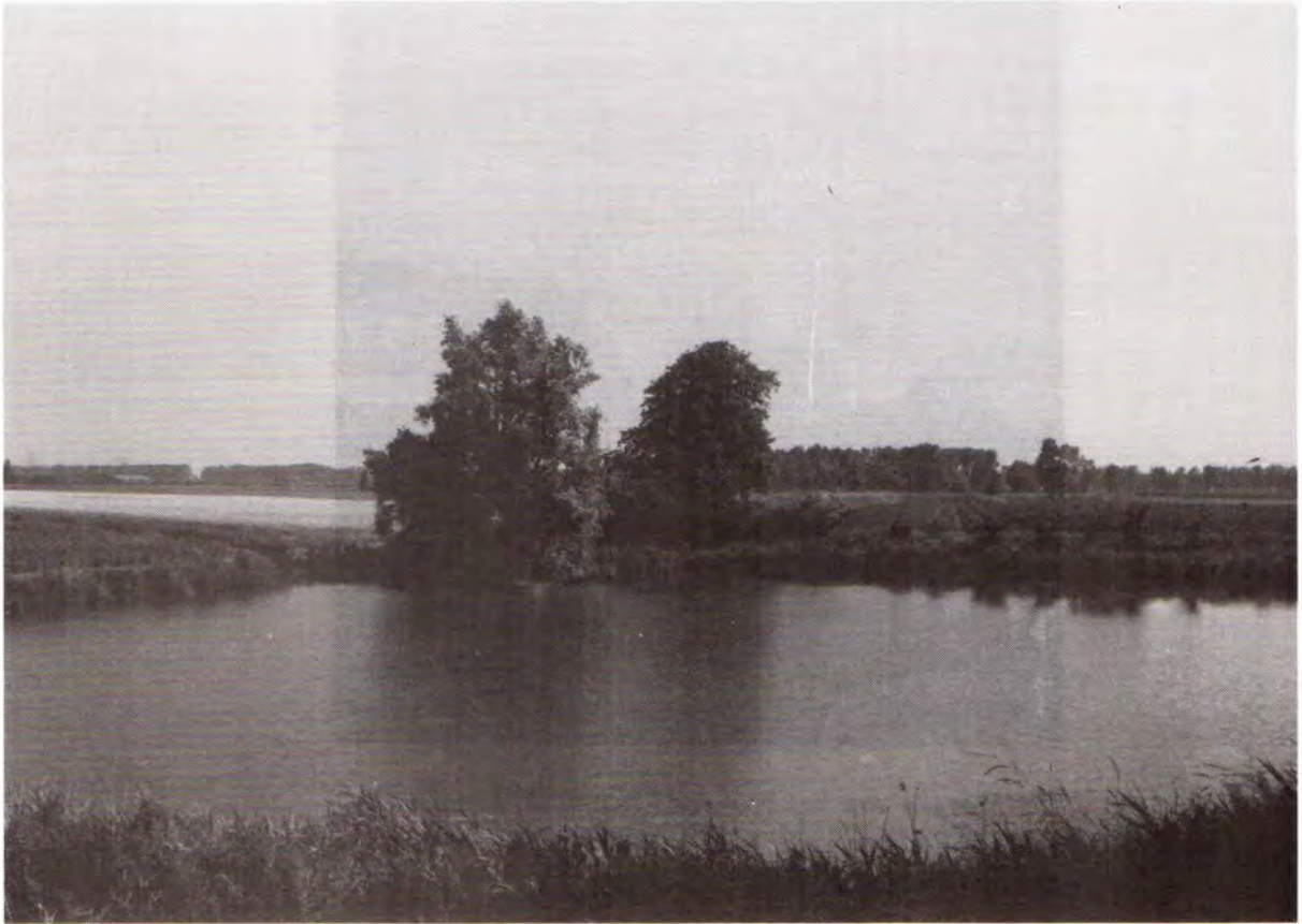
Weel van Arjaan van den Dries aan de Nieuwlandsedijk. Foto A. de Jong, 1993.