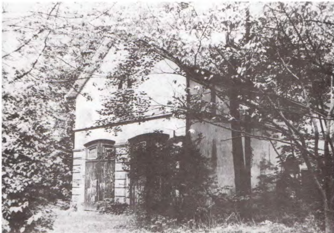
Koetshuis van het landgoed Landlust aan de Dorpsstraat, thans vestiging van het Zeeuwse Landschap, ca. 1980.