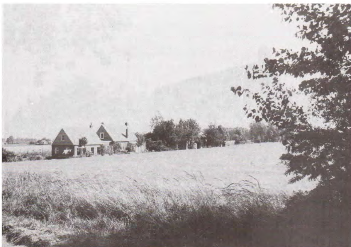
De Lange Vielle gezien vanaf de Boemdijk. Foto A. de Jong, 1993.