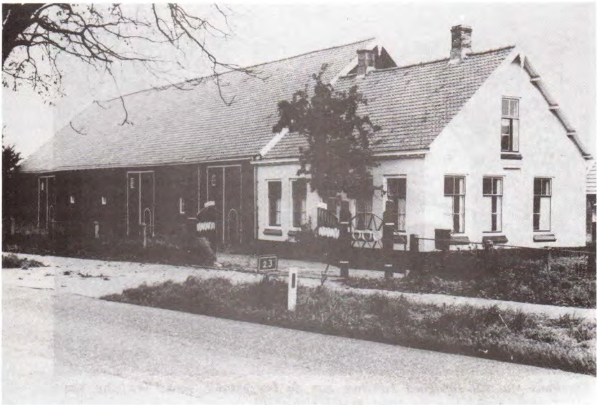
Boerderij Claerensteyn aan de Heinkensandseweg, ca. 1980.