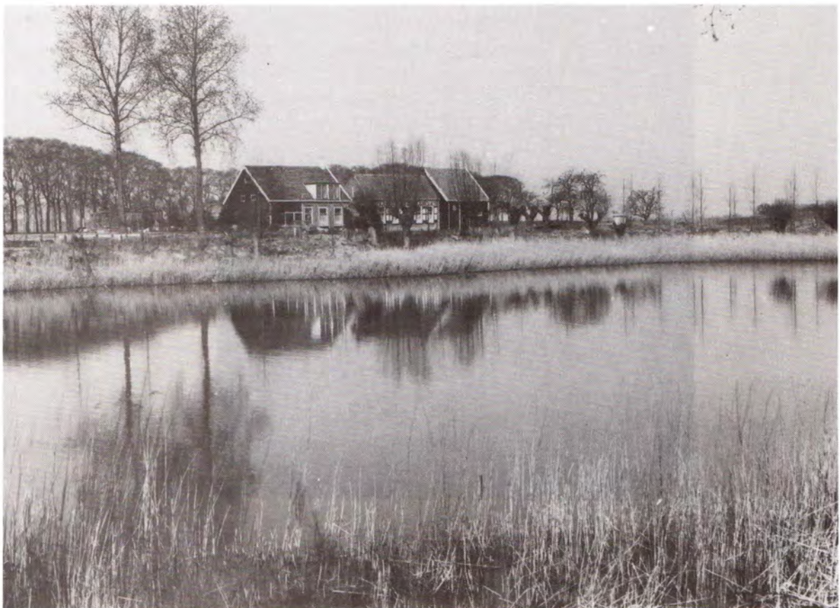
Weel De Doolman aan de Oude Kamerseweg, 1982.