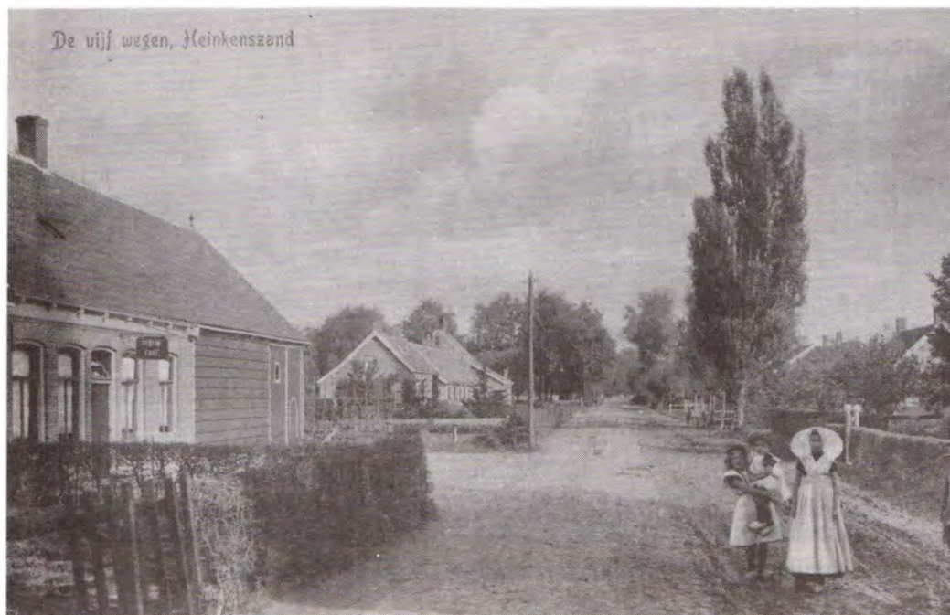
De Vijf Wegen met op de achtergrond links van de weg de voormalige meestof, ca. 1920.