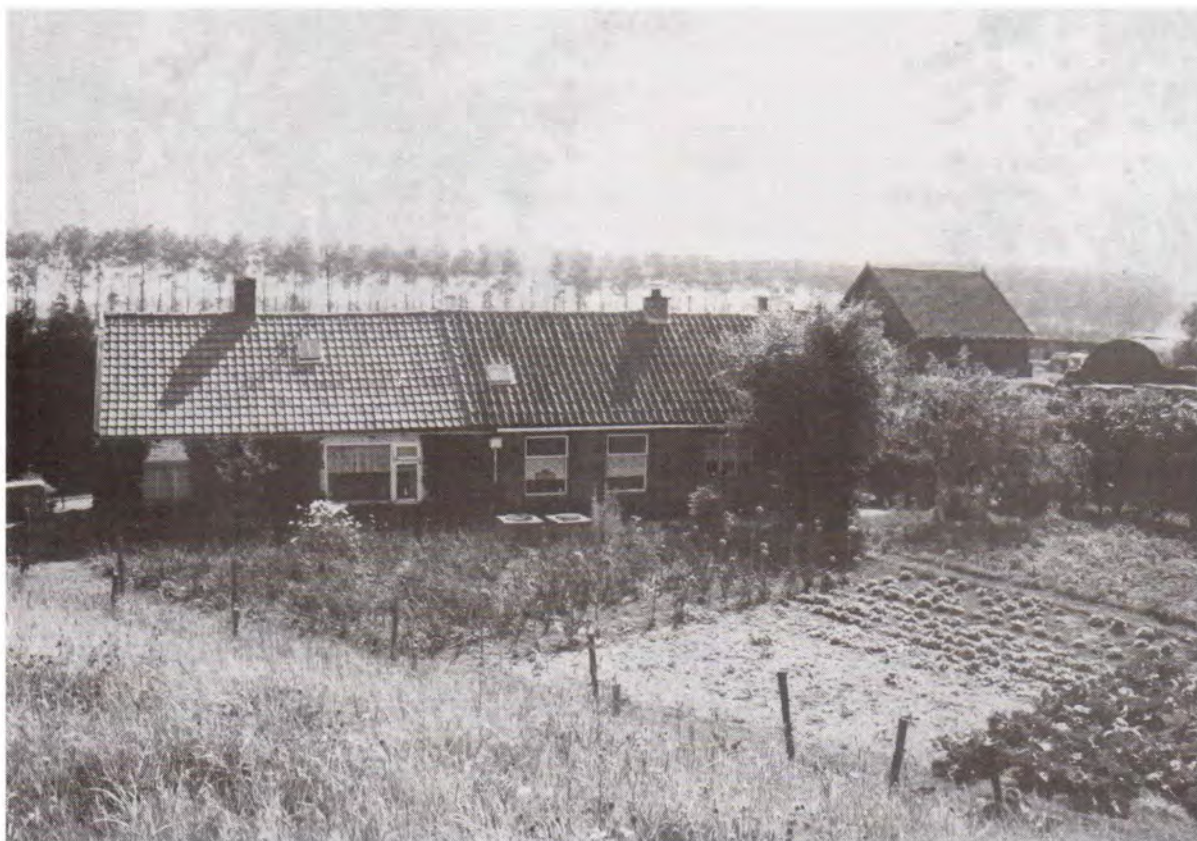
Huizen aan de Vlaandersedijk. Foto A. de Jong, 1993.