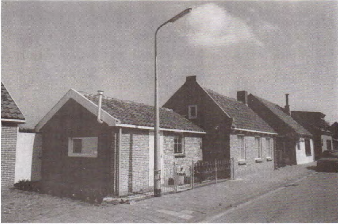
Slaakweg oud nummer 213.