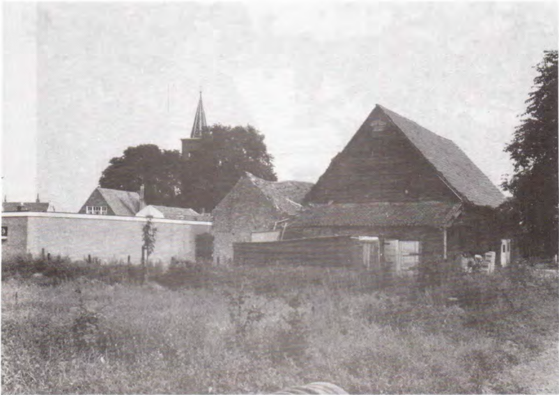
Op de voorgrond het perceel met de benaming Kannegieter, met rechts de voormalige bierbrouwerij van De Jong aan de Dorpsstraat, 1977.