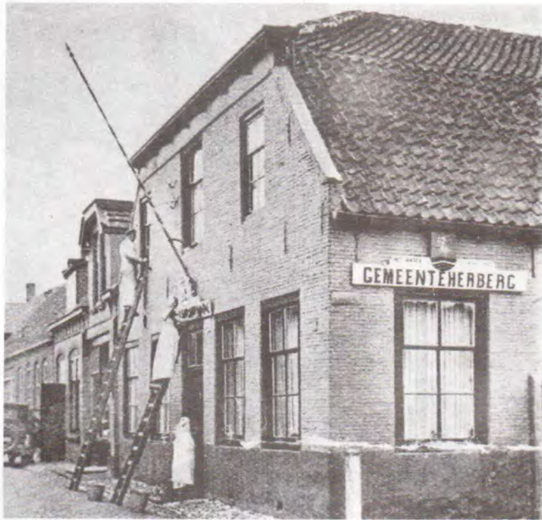
De oude gemeenteherberg aan de Dorpsstraat, waar ooit de gemeenteraad vergaderde. Foto GA. Goes, ca. 1930.