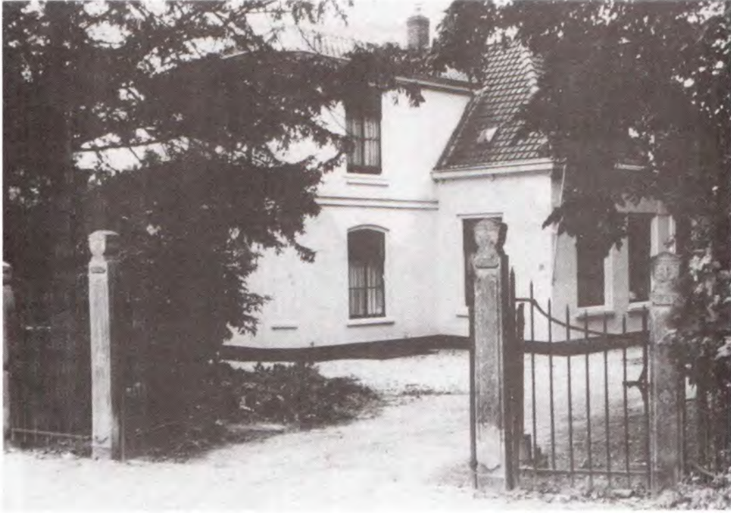
Oprijlaan van het landgoed Landlust aan de Dorpsstraat, ca. 1980.