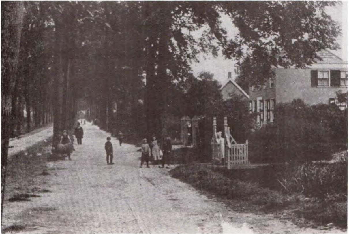
Clara's Pad gezien vanaf de Dorpsstraat, omstreeks 1915.