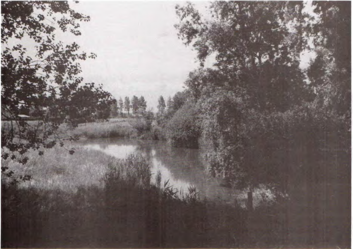
De Rietse "Bussen" gezien vanaf de Vlaandersedijk. 1993.