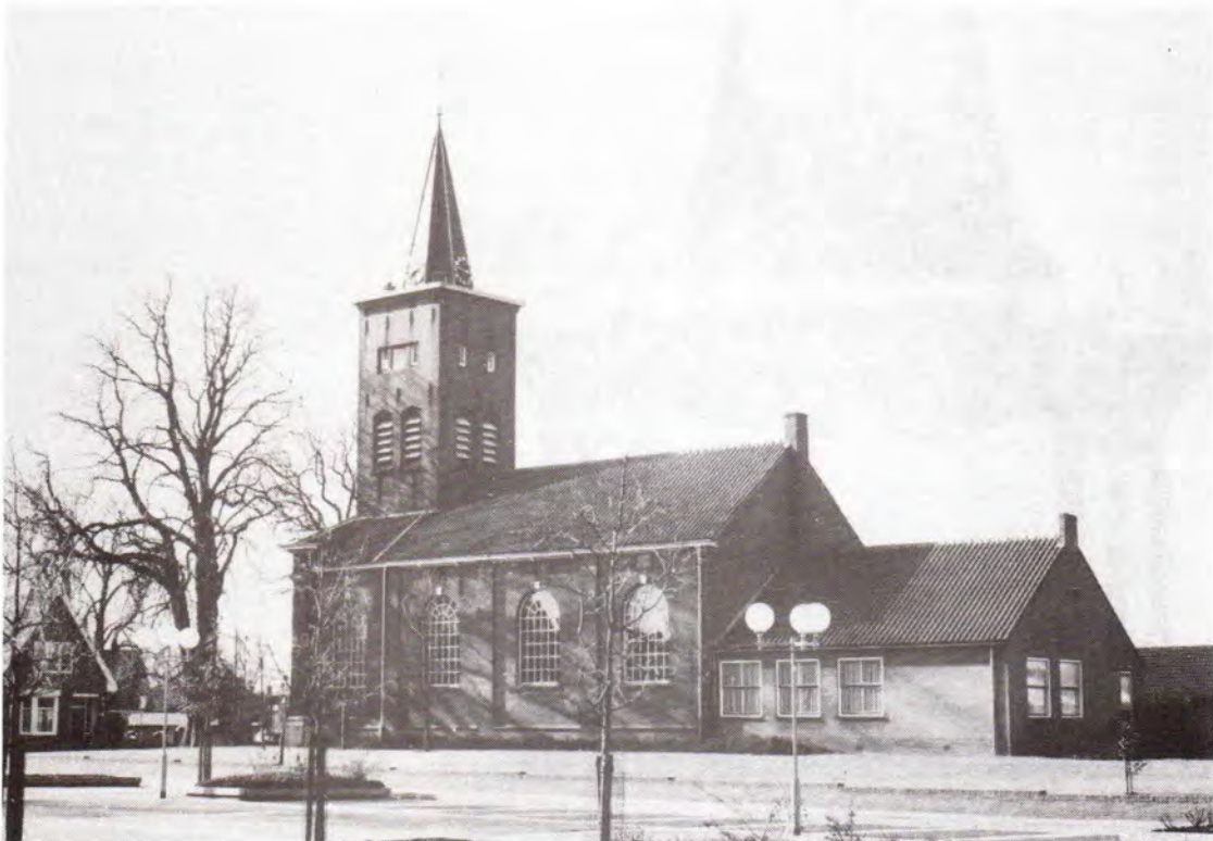
De Nederlands Hervormde kerk aan het Stengeplein, 1978.