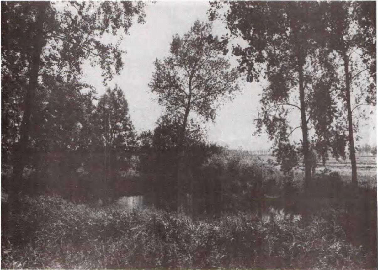
Weel aan de Zanddijk. Foto A. de Jong 1993.