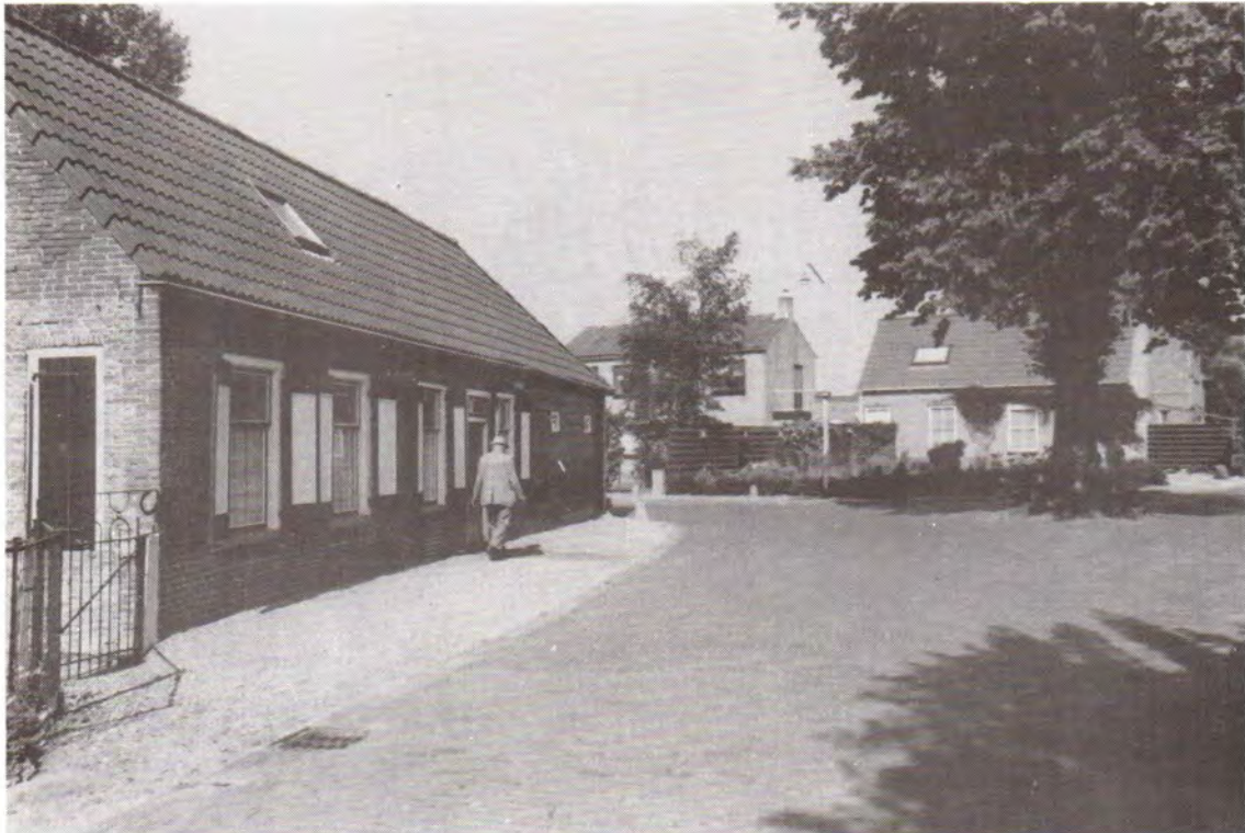
Hoek Stationsweg-Slaakweg. 1993.