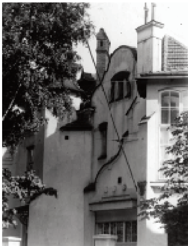
Радянське консульство у Львові. 1933 р.

Не зупиняючись наразі на аналізі представницьких функцій і повноважень згаданої дипустанови, варто зазначити, що вона слугувала надійним прикриттям для створення легальних резидентур радянських спецслужб. Посади його співробітників обіймали, як правило, працівники зовнішньої розвідки. Інколи виняток ро-