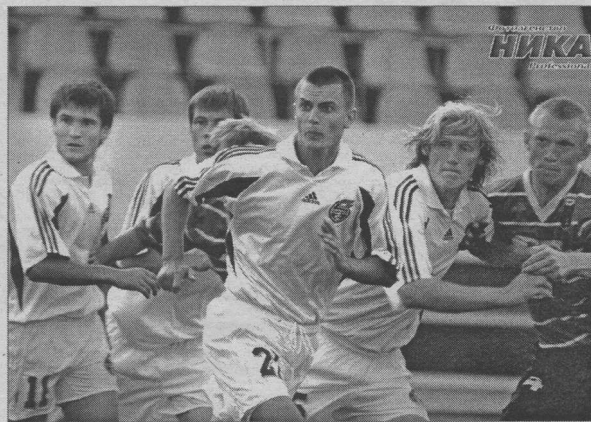
Сразу скажем, этот снимок сделан не на последнем матче. Беспристрастный объектив фотокамеры запечатлел игроков «Факела» в начале августа. В понедельник такая жадная борьба проявилась у «Факела» лишь в последние двадцать минут...

На протяжении первого тайма соперники синхронно принимали услаждать бдительность друг друга. Трудно отделить кому-либо пальму первенства в этом компоненте, пусть будет ничья, тем более, что по прошествии 45-ти минут на табло горели нулевые ноли. Все происходило на