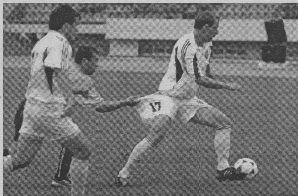
Рязанцы были близки к тому, чтобы уехать из Воронежа не с пустыми руками

ПОБЕДИВ, «ФАКЕЛ» УСТУПИЛ СОПЕРНИКУ ПРАКТИЧЕСКИ ПО ВСЕМ СТАТЬЯМ