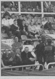
Десант смоленских болельщиков, еще год назад поддерживавших свою команду в первом дивизионе