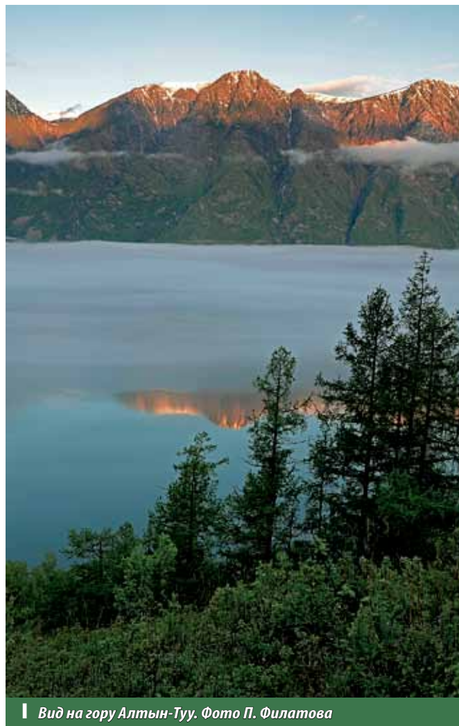
Вид на гору Алтын-Туу.

Водопад Корбу. Корбу является самым большим водопадом в акватории Телецкого озера и самой популярной среди туристов достопримечательностью озера. Водопад Корбу расположен на правом притоке озера – реке Большая Корбу. В нескольких десятках метров от берега озера река Большая Корбу обрывается со скалы и образует