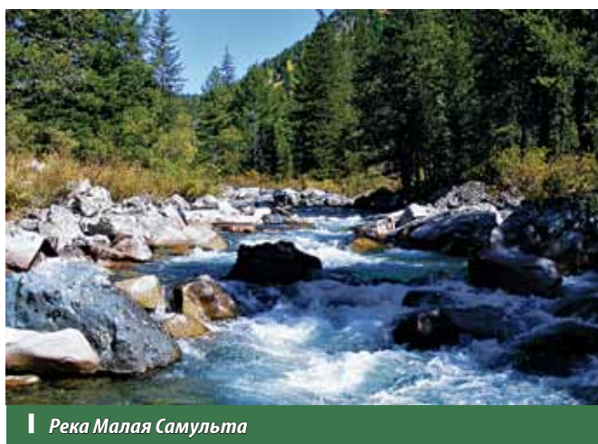
Река Малая Самульта

Сегодня маршрут проходит через две вершины – Чевошь и Уймень. Высота этих вершин около 2,5 тыс. м над уровнем моря. В ясную погоду с вершины Уймень в 160 км южнее в центре азиатского континента видна гора Белуха, самая высокая гора Горного Алтая. Ее высота 4509 м. После днёвки на Форелевых Озерах выход через верховья рек Пыжа и Эвий к началу грунтовой дороги за 25 км от автомобильного перевала Обога. Дальше – 65 км на внедорожниках до поселка Артыбаш на Золотом Озере Телецком. На днёвках можно половить хариуса и форель в горных озерах. Если повезет, можно встретить марала, кабаргу и сибирских козорогов, увидеть соболя или емуранку – так алтайские охотники называют земляного зайчика или тушканчика.