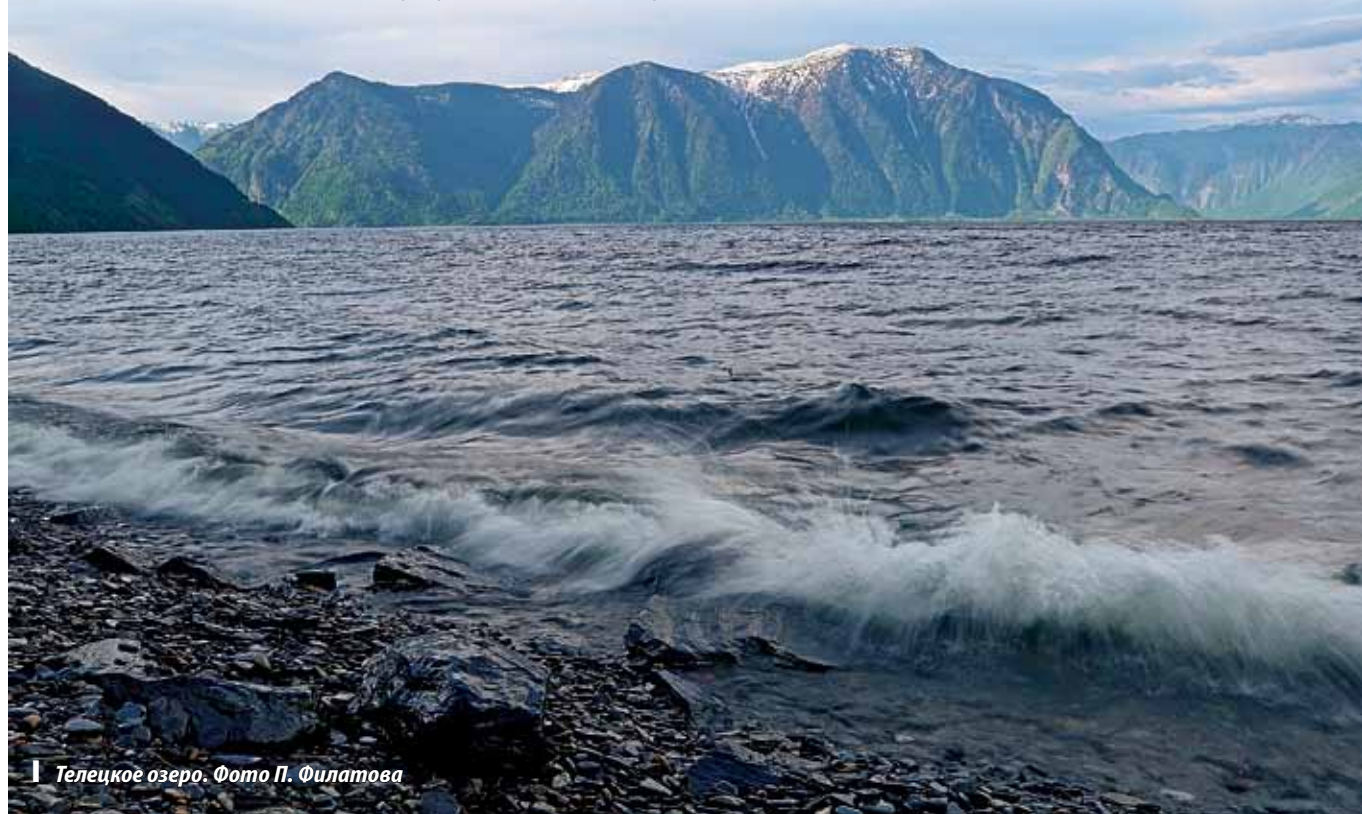
Телецкое озеро.

Значительная протяженность озера и труднодоступность его берегов, способствовала тому, что здесь, в самом центре Евразийского материка, на огромном удалении от всех морей и океанов есть своя более чем 100-летняя история судоходства. И в наши дни белоснежный теплоход «Пионер Алтая» – флагман телецкого флота, бороздит просторы озера, совершая круизные рейсы для туристов и путешественников. Во время экскурсии на теплоходе, туристы знакомятся с живописными достопримечательностями озера.