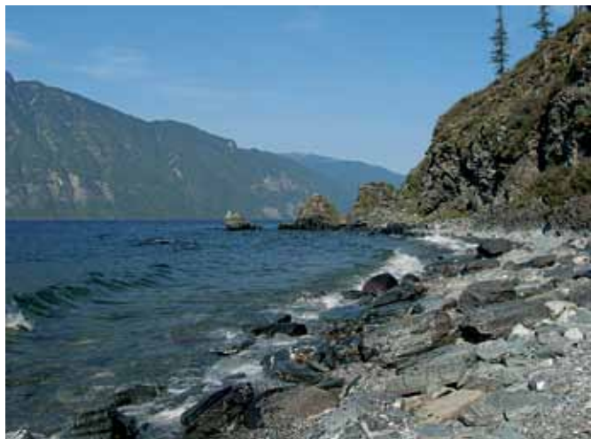
Причал к кордону Челюш.