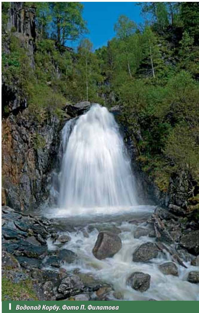
Водопад Корбу.

Водопад на Третьей речке. Многие туристы знакомы с водопадом на Третьей речке. Этот водопад находится не совсем на берегу озера, но весьма популярен среди