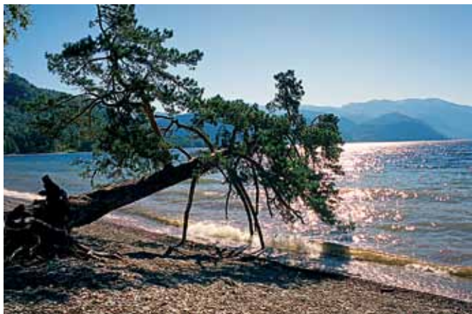
Поклонная сосна вблизи Яйлю.

водопадов. Здесь представлены картины таких художников как Пилипчук В.Б., Зорина Н.Н., Чобучко П.П., Сафронова А.Ю., Волкова С.В., Бушуева А., Шарагов Н.П., Южаков В. Шилкин Л.А. Здесь проводятся творческие встречи и мастер-классы. Галерея расположена справа от дороги примерно в 200 м от моста через р. Бия. На большой площади перед галереей стоит дерево со множеством разноцветных ленточек. Ленточки повязывают на дерево, загадывая желание, при выходе из галереи.