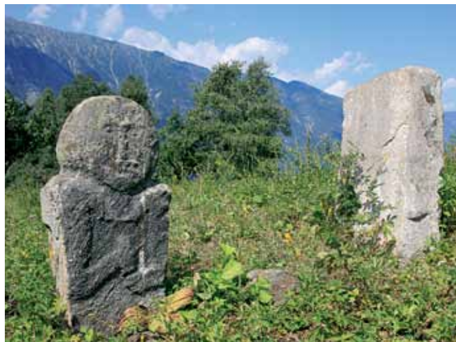
Кордон Беле, Кезер-Таш.

мощный, грохочущий поток ледяной воды высотой 12,5 м. В солнечный день возле водопада можно наблюдать радугу – в воздухе постоянно стоит мелкая водяная пыль, которая вместе с радугой придает пейзажу особый колорит. Напротив места впадения Большой Корбу в Телецкое озеро находится самое глубокое место в озере – глубина здесь составляет около 330 м.