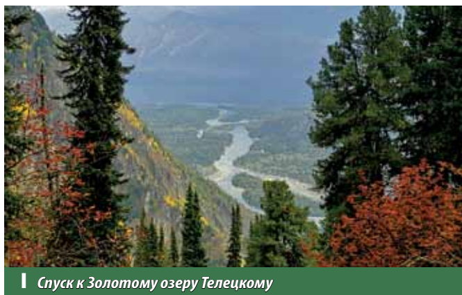
Спуск к Золотому озеру Телецкому