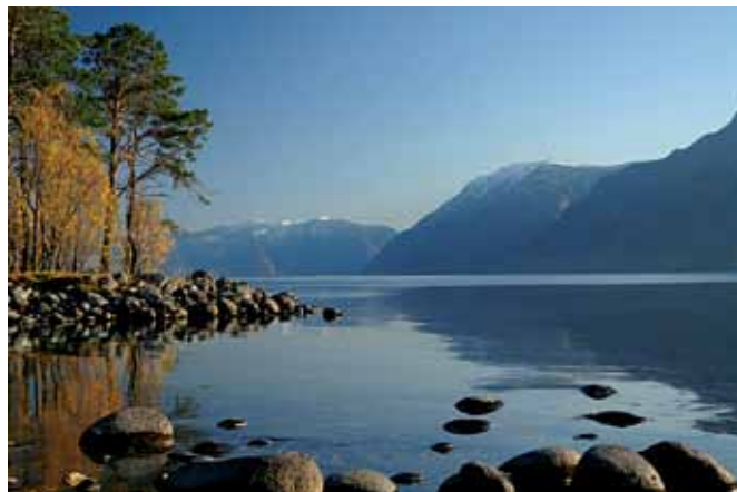
Устье р. Кокши.

Для коренных жителей, испокон веков живущих на озерных берегах, Телецкое озеро (по-алтайски Алтын-Кёль означает «золотое озеро») – священное место, овеянное легендами и былями. Для сотрудников Алтайского заповедника озеро является объектом изучения и охраны – почти половина акватории включена в границы заповедника. Благодаря охранному режиму, обитатели озера могут чувствовать себя в безопасности – лов рыбы здесь запрещен. А для остальных жителей планеты Земля – озеро Телецкое вместе с территорией заповедника – объект Всемирного природного наследия, природная достопримечательность, имеющая исключительно важное значение для ныне живущих и будущих поколений. Наличие редких видов в сочетании с биоразнообразием и эстетической привлекательностью ландшафтов было признано на международном уровне. В 1998 г., по решению ЮНЕСКО, территория на стыке Центральной Азии и Южной Сибири, где располагается одна из самых значительных горных систем – Алтай, была объявлена объектом Всемирного наследия под названием «Золотые горы Алтая». Огромная территория (свыше 16 тысяч квадратных километров), вобрала в себя 3 участка: плоскогорье Укок, Катунский заповедник с природным парком Белуха, Алтайский заповедник с Телецким озером. Именно эти места в Сибири наиболее ярко демонстрируют разнообразие высотных поясов, начиная со степей и лесов, и заканчивая альпийскими лугами и ледниками.