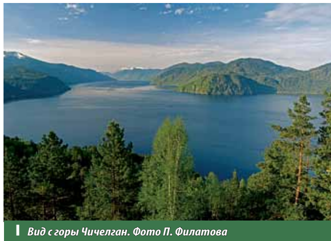
Вид с горы Чичелган.

Визит-пункт «Алтайский аил». В 2007 г. при поддержке Всемирного фонда природы (WWF) был открыт визит-пункт «Алтайский аил» представленный в виде стилизованного алтайского жилища – аила. В визит-пункте экспонируются предметы алтайской культуры и быта.