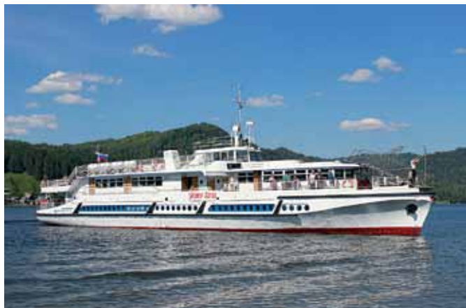
Теплоход «Пионер Алтай».