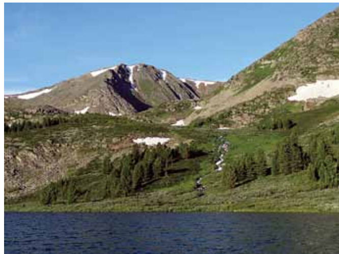
Иваново озеро. Урочище Чевощь