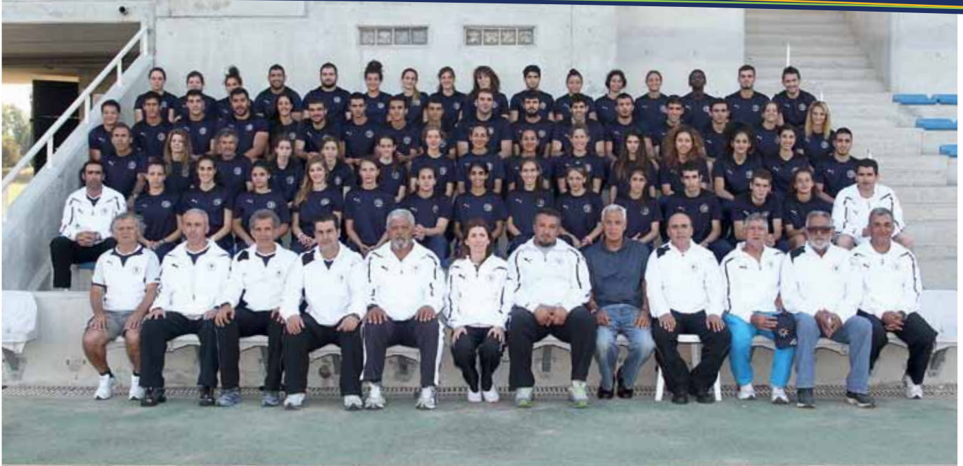
Οικογενειακή φωτογραφία, του 2012, της ομάδας στίβου του ΓΣΠ.