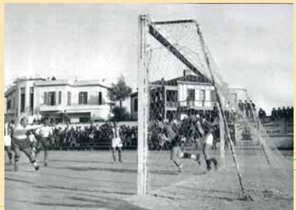
Αγώνας ΑΠΟΕΛ-Ομόνοιας, το 1955, στο ΓΣΠ. Το στιγμιότυπο είναι στην περιοχή των πρασίνων.