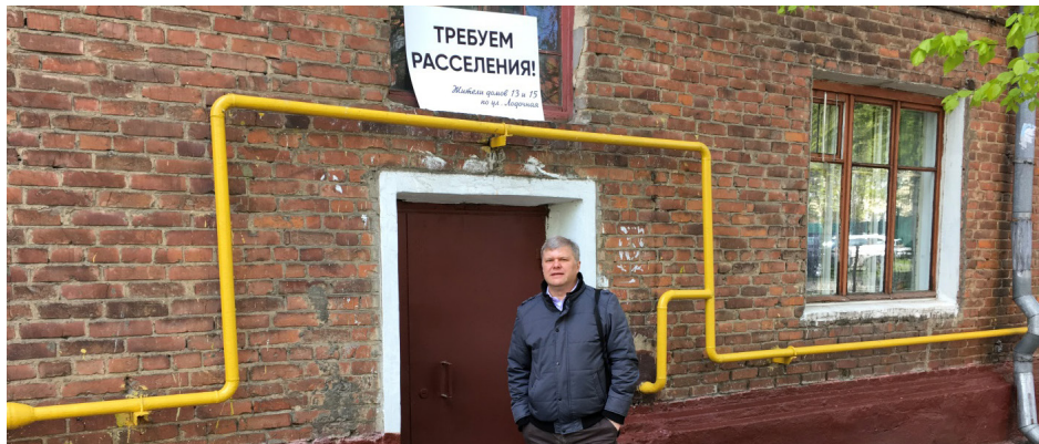
2017 год. У дома на Лодочной с требованием расселения.

2013 Добился расселения аварийного дома 11 на ул. Лодочная.