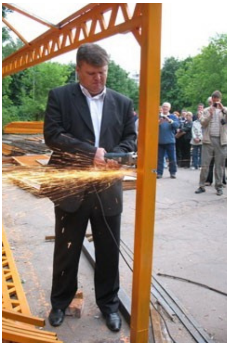
2008 год. Приходится самому использовать болгарку, чтобы убрать незаконное сооружение у ул. 26 бакинских комиссаров.

2013 Отменил закупку на обследование за 589 тыс. рублей уже разобранного амфитеатра в ЮЗАО.