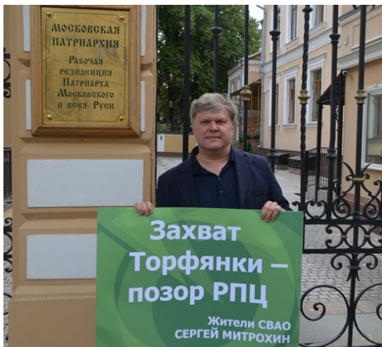
Пикет у резиденции Патриарха.

2015-2016 Боролся с незаконным строительством религиозных объектов в парках Джангаровка, Чермянка, в парке на Аргуновской ул., Торфянка (Осташковский проезд, вл.4), а также передачи земли сквера «Красная дорожка» местному приходу в бессрочное пользование. Председатель Москомстройинвеста Константин Тимофеев в ответе на мое письмо подтвердил, что в парке «Торфянка» не будут строить храм, для которого предоставлен земельный участок по адресу: Анадырский проезд, вл.8.