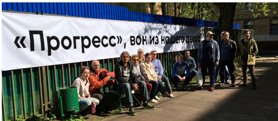
2017 год. С жителями домов на Подмосковной 16.

2017 Добился включения в программу «реновации» оставшихся не расселенными домов 13 и 15 по ул. Лодочная, которые также признаны аварийными, но в «реновацию» сначала включены не были.