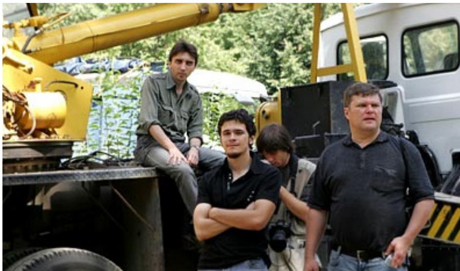
2007 год. Останавливаем технику на незаконной застройке по ул. Академика Павлова 2.

2007 Отказа от планов коммерческой точечной застройки по адресу ул. Академика Павлова 2.