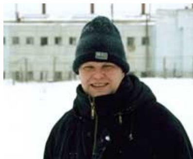
На фоне хранилища ядерного топлива в Железногорске.

2002 Организовал инспекцию крупнейшего ядерного объекта России – Горно-химического комбината в Железногорске (Красноярский край). В сопровождении трех телевизионных журналистов и двух активистов