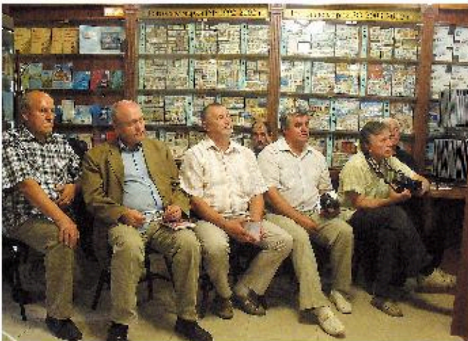
Сообщение об истории «Тифлисской уники» вызвало неподдельный интерес

О «Тифлисской унике» – первой российской марке – можно рассказывать очень долго. Она была выпущена в Российской империи в 1857 г. с номиналом 6 копеек для городской почты Тифлиса и Коджори. Сейчас это территория Грузии. Почтовая пересылка внутри города составляла 5 копеек, и 1 копейка добавлялась за стоимость изготовления. Тифлиские марки были выполнены бесцветным рельефным тиснением, на желтоватой бумаге.