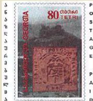
«Тифлисская уника» на блоке, марке и на вырезке из ПК