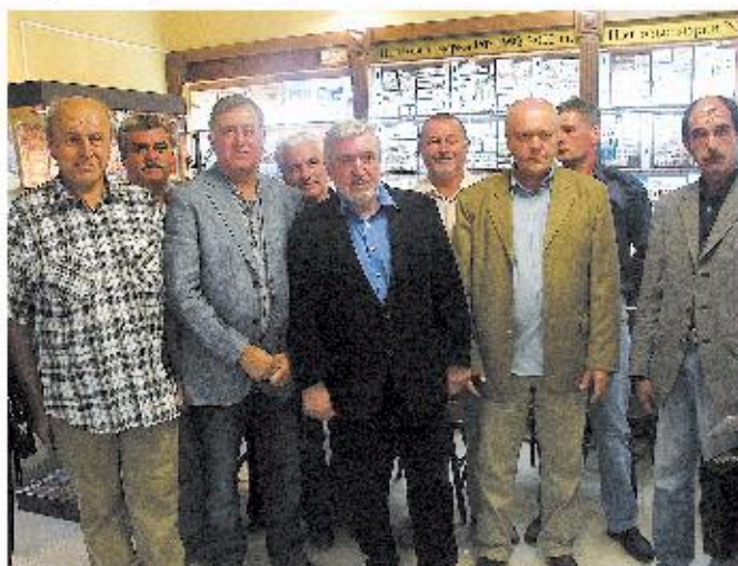
Во время встречи в Красноярске

Вообще, почтовые марки – выгодное вложение. И во многих странах это давно поняли. Ещё в годы Великой Отечественной войны советские солдаты удивлялись, когда находили спрятанную почтовую марку в часах фашистов, или под дешёвыми марками, наклеенными на конверты, обнаруживались другие. Редкие почтовые