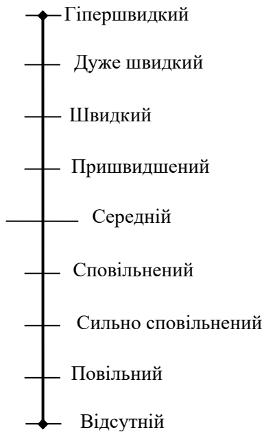
Рисунок 2 – Результат шкалювання значень ознаки трафіку

На рис. 2 показані наступні ітерації структуризації лінгвістичних значень: