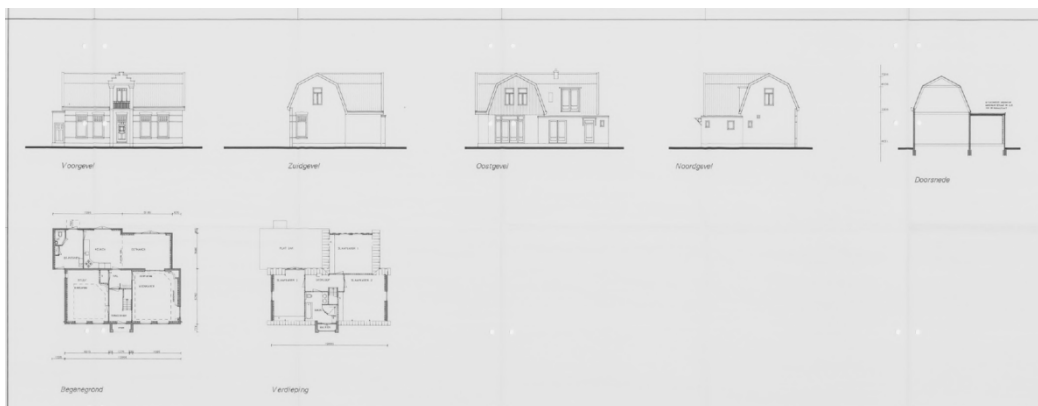
Bouwtekeningen uit 1995 met daarop de bestaande en nieuwe situatie.