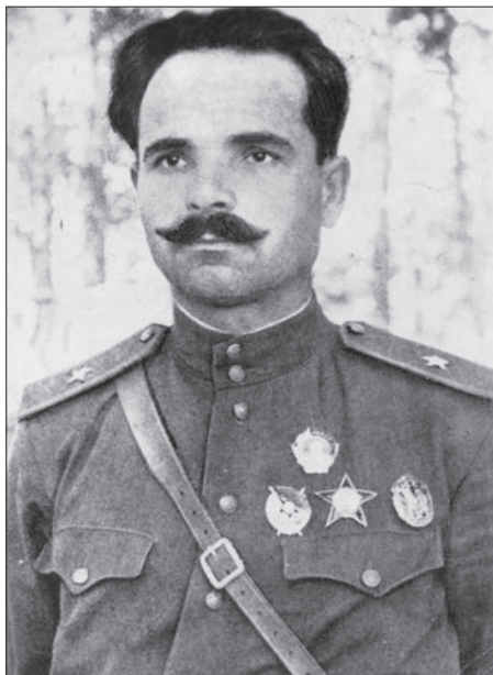
С.В. Руднев. 1943 р.

Семен Васильович Руднев – Содин із керівників та організаторів руху опору на окупованій нацистами території України під час Другої світової війни.