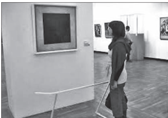
На виставці К.С. Малевича