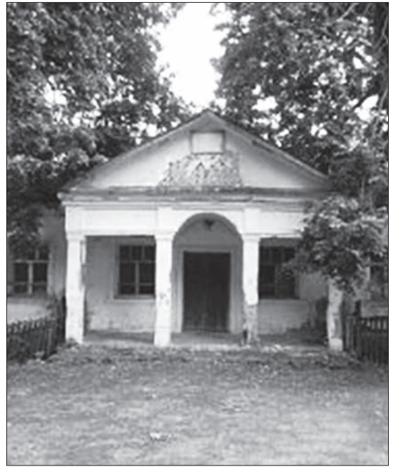
Будинок поміщиків Аксьонових