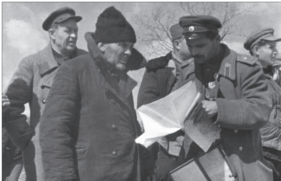
На березі Прип'яті. 1942 р.