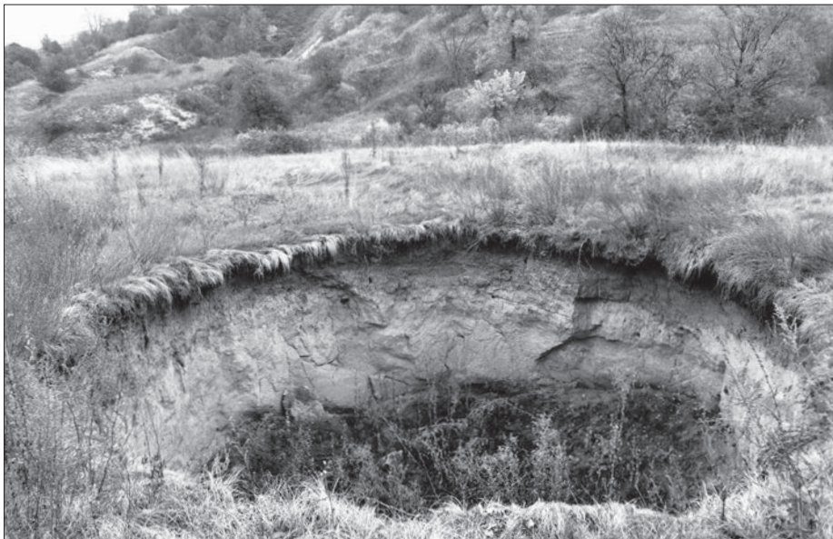
Копальня для видобування крейди