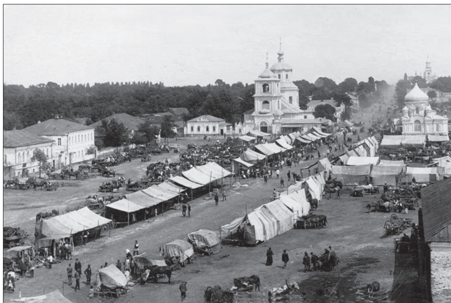
Ярмарок у Путивлі. 1910 р.

Сьогодні в Україні поступово зростає інтерес до народної кулінарії. Нині практично забутий путивльський пряник, враховуючи стійку туристичну зацікавленість до місця його появи, цілком має шанс повернення свого доброго імені. А в перспективі – стати основою