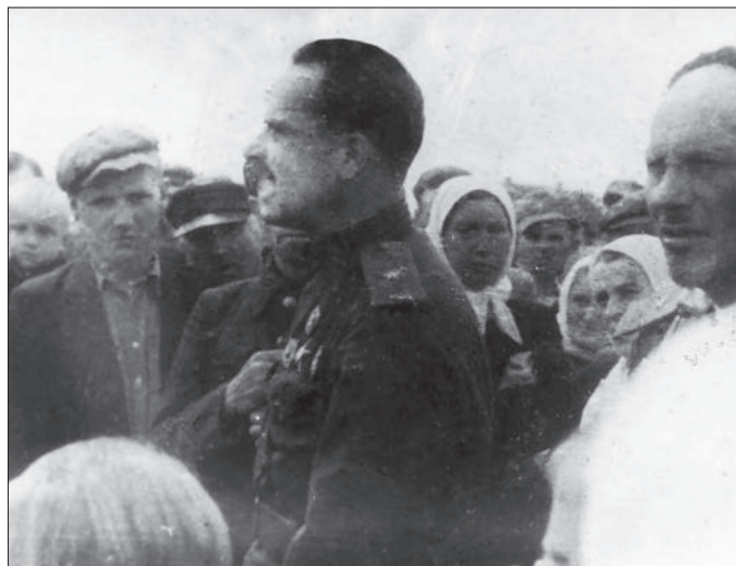
Карпатський рейд. Комісар серед місцевих жителів

Багатий військовий досвід, командирська кмітливість, переконливе політичне слово, особистий приклад мужності – цими якостями С.В. Руднев викликав до себе глибоку повагу і любов не тільки парти-