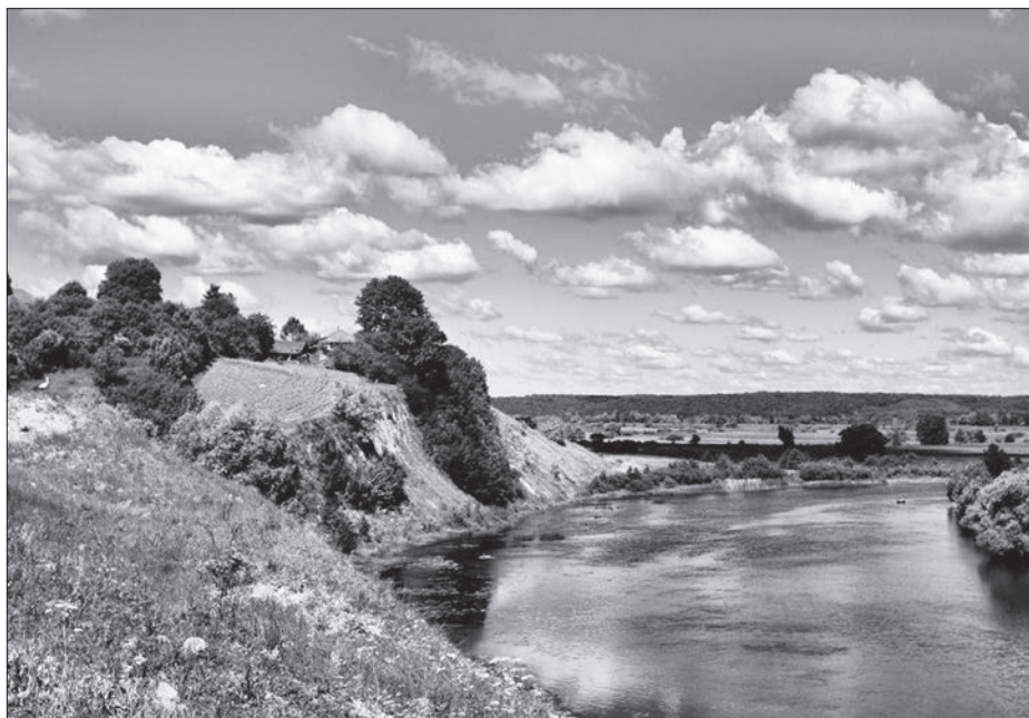
Літо в Гірках. 1974 р.

Наша оповідь – про мальовниче село Гірки, розташоване на сході Путивльського району за 40 км від Путивля. Сеймом тягнеться водний кордон цього невеликого українського села з Російською Федерацією.