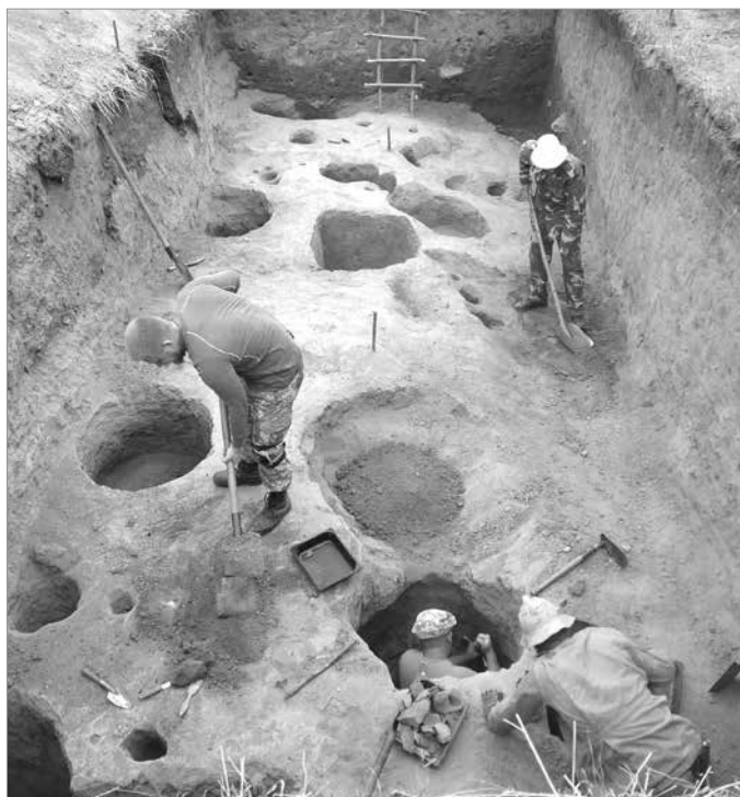
Дорога вглиб століть