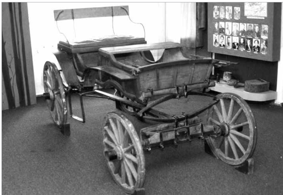
Тачанка Сидора Ковпака