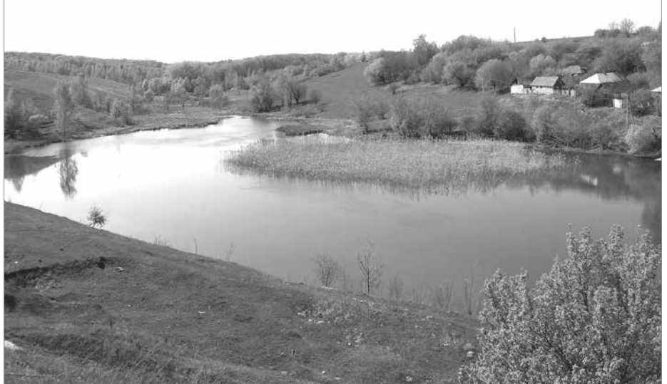
Місєв став під Церків'ям

Точних свідчень про початок виникнення села, мабуть, у жодному літописі не знайдеш. А за людськими переказами, із покоління в покоління