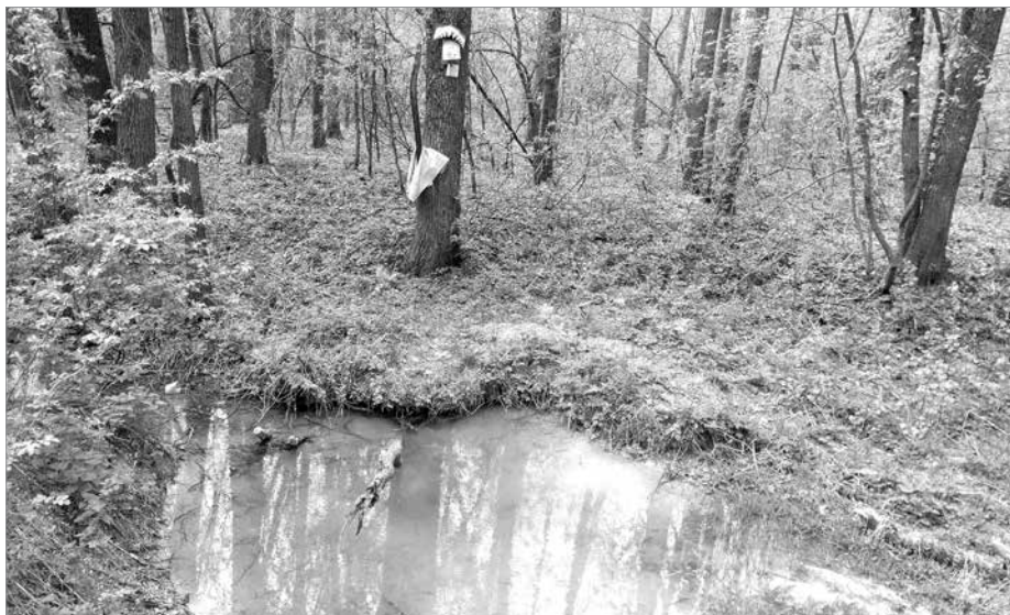
Дзвінке джерельце Мєловуха

Мешканці цієї вулиці й нині переконливо стверджують, що Слобода почалася саме з Прилеп.