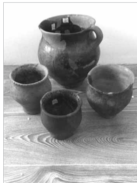
Відреставровані ширяївські горщики

Розкопки городища Ширяєве лише набирають обертів. Потужний культурний шар товщиною майже два метри, а також відсутність належного фінансування є тими факторами, що не дозволяють провести широкомас-