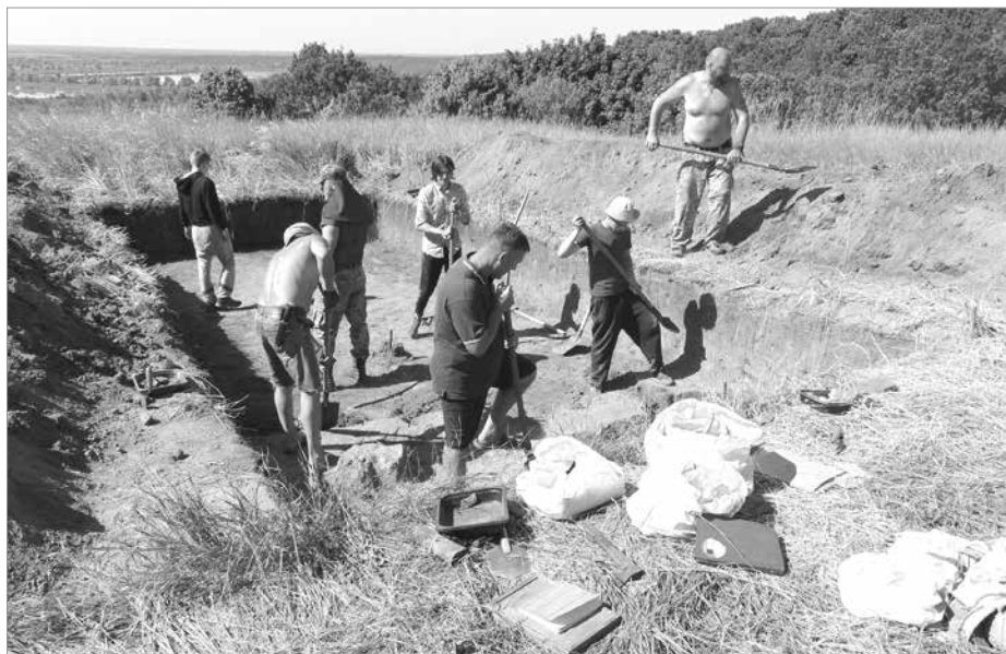
У пошуках сивої минушини