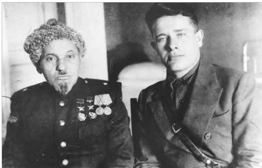
С.А. Ковпак та його ад'ютант М.М. Політуха