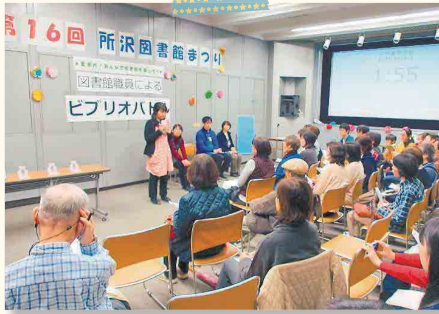
▲12月12日(出)・13日(出)の2日間にわたって開催された『第16回所沢図書館まつり』。普段は見られない図書館の裏側に潜入する「図書館探検」や図書館職員が5分間でおすすめの本を紹介する「ビブリオバトル」などで図書館の魅力を満喫しました。 12月13日(出)所沢図書館