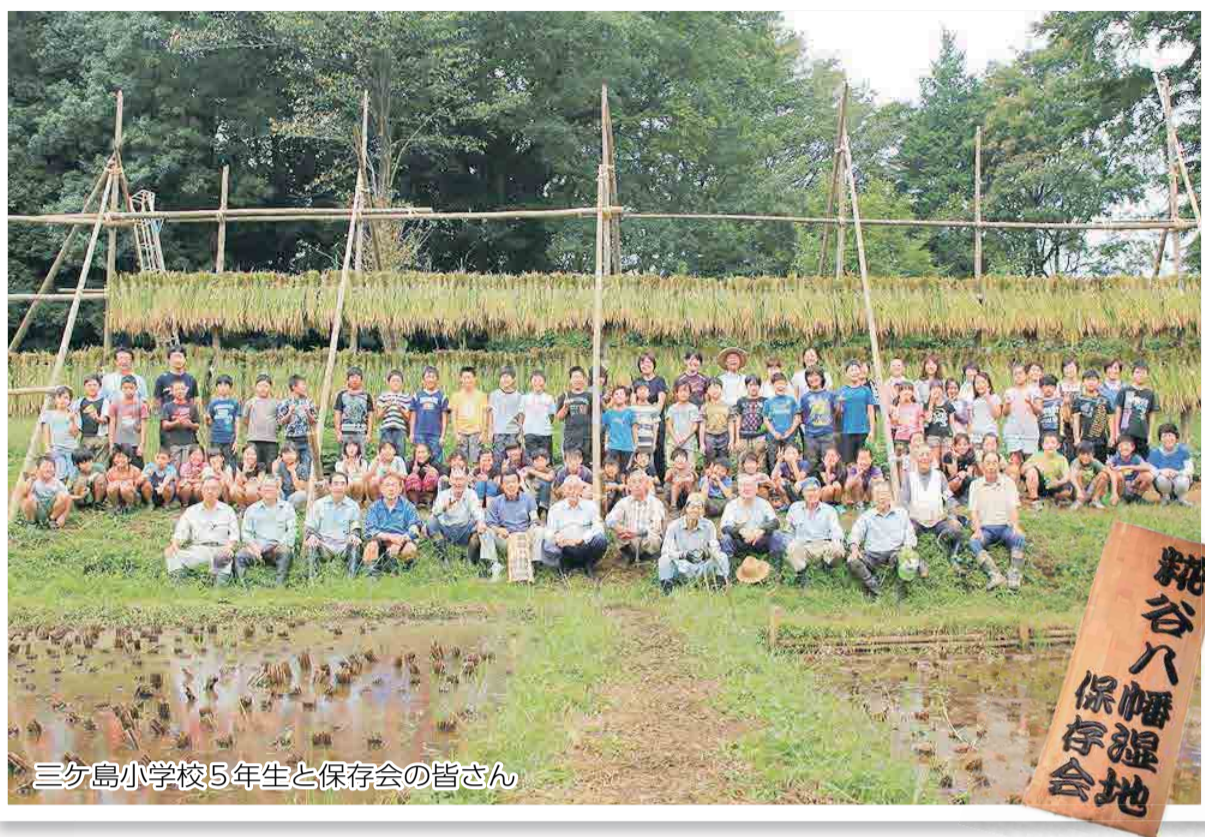
三ヶ島小学校5年生と保存会の皆さん

今回は、この三ヶ島小学校の体験学習を密着レポートします！ 問 広報課 ☎ 2998-9024