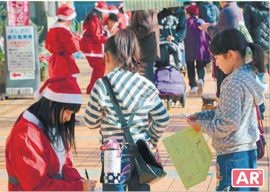
▲中心市街地の冬の風物詩となった『サンタを探せ!』。今年は総勢約200人のサンタが街中に繰り出し、「サンタdeビンゴ」や「サンタぞろぞろパレード」などの催しで街を活気づけました。12月12日(出)/元町コミュニティ広場ほか (写真:市民カメラマン・浅見司郎/動画:同・宮本博史)