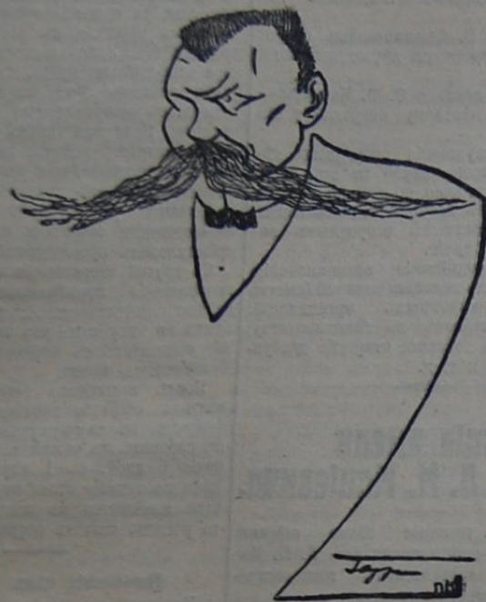
Гласный думы Н. И. Михновскій.