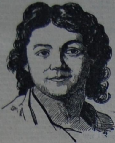
Сей первый мужъ Федора прославился открыт. И съ помощью на немъ поручились Мускумиды другъ, отечеству служилъ. До смерти былъ добрякъ, по ней хвалили остались.

Сегодня театральная Россия вспоминаетъ первого русскаго актера Волкова, жизнь котораго была все посвящена театру. Уроженецъ Ярославля, сынъ купеческій, Волковъ устроилъ первый русский театр въ Ярославль, въ колоссальномъ амбаре, обставленномъ панномами, и 29 июня 1750 года началъ представления. Лѣтъ сорокъ тому назадъ этотъ амбаръ еще существовалъ на Пролобной улицѣ и служилъ складомъ для вина, потомъ жилью, ибо, какъ говорится въ насъ, никто не позаботился о сохраненіи историческаго здания.