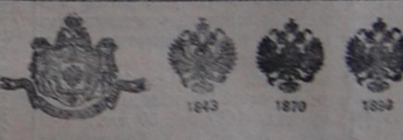
Парижъ 1900: Grand Prix.