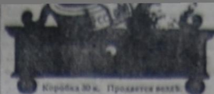
Коробка 30 м. Продаются во всех 24413 7-8