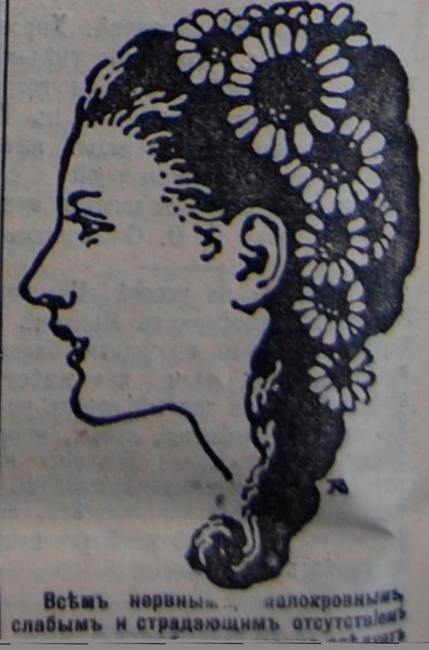
Всѣмъ нервнымъ, малокровнымъ слабымъ и страдающимъ отсутствіемъ...