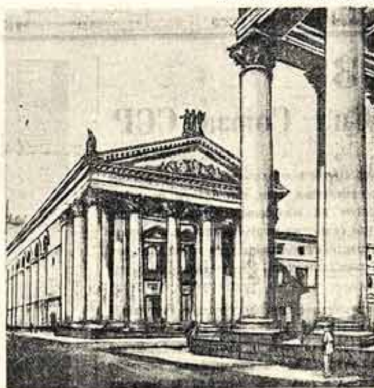
Еще недавно на Советской улице в г. Калинин стояли полуразрушенные стены драматического театра, сгоревшего во время войны. Сейчас на этом месте возмужает строительство нового театра...

ОДИН ИЗ ВАЖНЫХ ПЯТИЛЕТНИХ ПЛАНОВ ВОССТАНОВЛЕНИЯ И РАЗВИТИЯ НАРОДНОГО ХОЗЯЙСТВА СССР НА 1946—1950 ГГ.