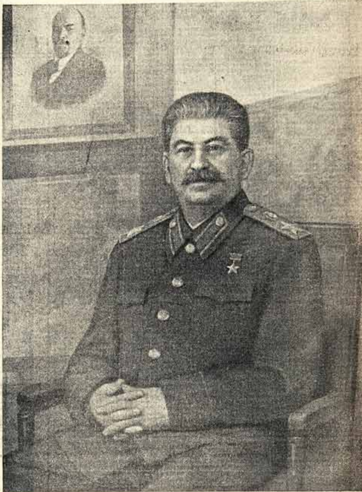
Министр Вооруженных Сил Союза ССР Генералиссимус Советского Союза И. В. СТАЛИН.

Министр Вооруженных Сил Союза ССР Генералиссимус Советского Союза И. СТАЛИН.