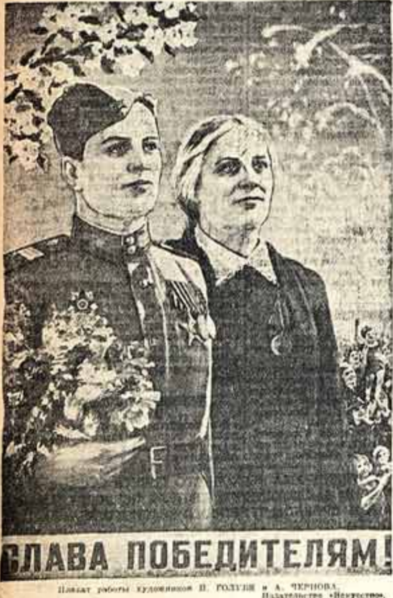
ВЛАДА ПОБЕДИТЕЛЯМ! Шпалера работы художников В. ГОЛУБИНА и А. ЧЕРНОВА. Издательство «Искусство».

57 художественных музеев было разрушено и повреждено немецко-фашистскими захватчиками в оккупированных ими городах. Около 30 из этих музеев уже восстановлено.