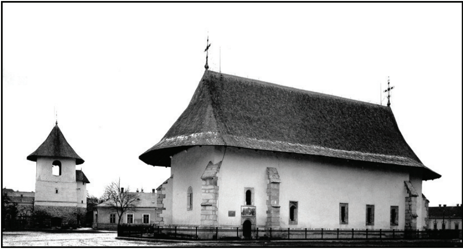
Рис.5. Церква св. Миколая у монастирі Богдана в Редець

нам, таємно пішли з Угорського королівства в нашу землю Молдавію і намагаються її утримати на ганьбу нашої величності» [9, с. 82; 10, с. 85].