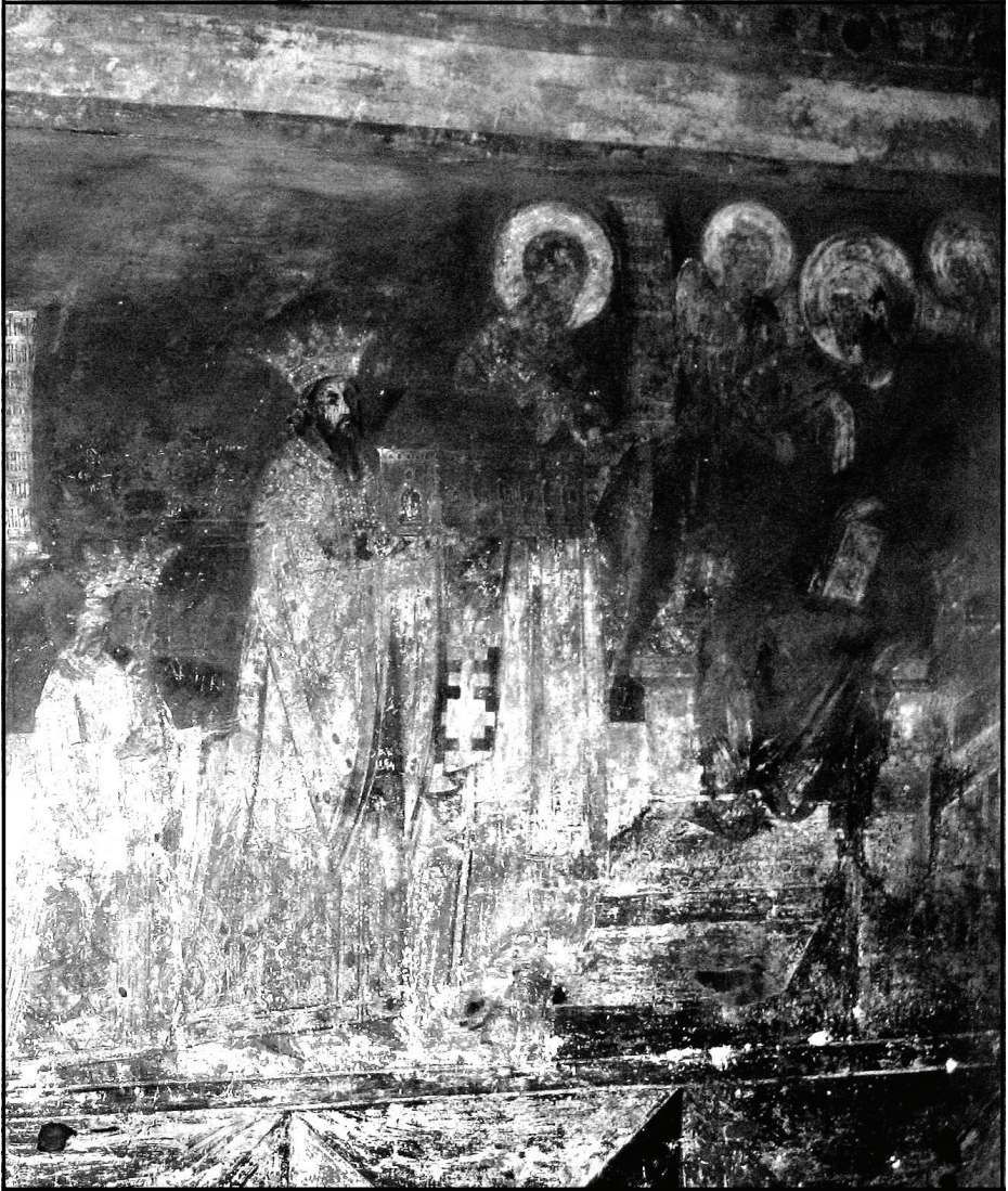
Рис.4. Воевода Богдан на фресці у церкві св. Миколая в Редеуць

місцевих жителів і розбив ординців у битві в долині р. Дорна. Після цих подій прийшов Драгош з Марамуреша, який одружився на доньці Негрі і успадкував його становище [11, с. 6-11, 122-125, 129; 26, с. 94-96].