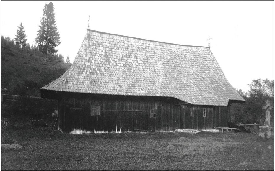
Рис.2. Церква Драгоша, перенесена з Волівця до Путни Штефаном Великим (НБ ЧНУ)

пішли на татар і разом з угорцями здобули повну перемогу над ними. «Нагороджуючи і милуючи» «старих римлян» за їх хоробрість, Владислав покликав їх до себе на службу і показав таємну грамоту «нових римлян». Не повіривши цій грамоті, «старі римляни» відпросилися у короля провідати своє місто і, побачивши, що Стародавній Рим розорений, а їхні дружини і діти навернені в латинство, стали просити Владислава дати їм для проживання нові землі і зберегти їх стару грецьку віру. Король охоче виконав прохання і дав їм землю в Маромаруше між річками Морешем і Тисою, звану Кріжі (варіант Кріжетур). Тут і оселилися «старі римляни», взявши в дружини угорських жінок і навернувши їх у православ'я. Серед «романівців» був мудрий і мужній чоловік на ім'я Драгош. Одного разу під час полювання, переслідуючи тура, він перейшов гори і знайшов за ними прекрасну порожню землю на краю татарських кочовищ. Випросившись у короля Владислава, Драгош разом з воїнами, жінками і дітьми перейшов Карпати і оселився на новій землі по річці Молдаві. Одноплемінники вибрали його своїм господарем і воєводою. «И отгголе начашася божиимъ произволениемъ Молдавская земля» [3, с. 56-58] ( рис. 2 ).