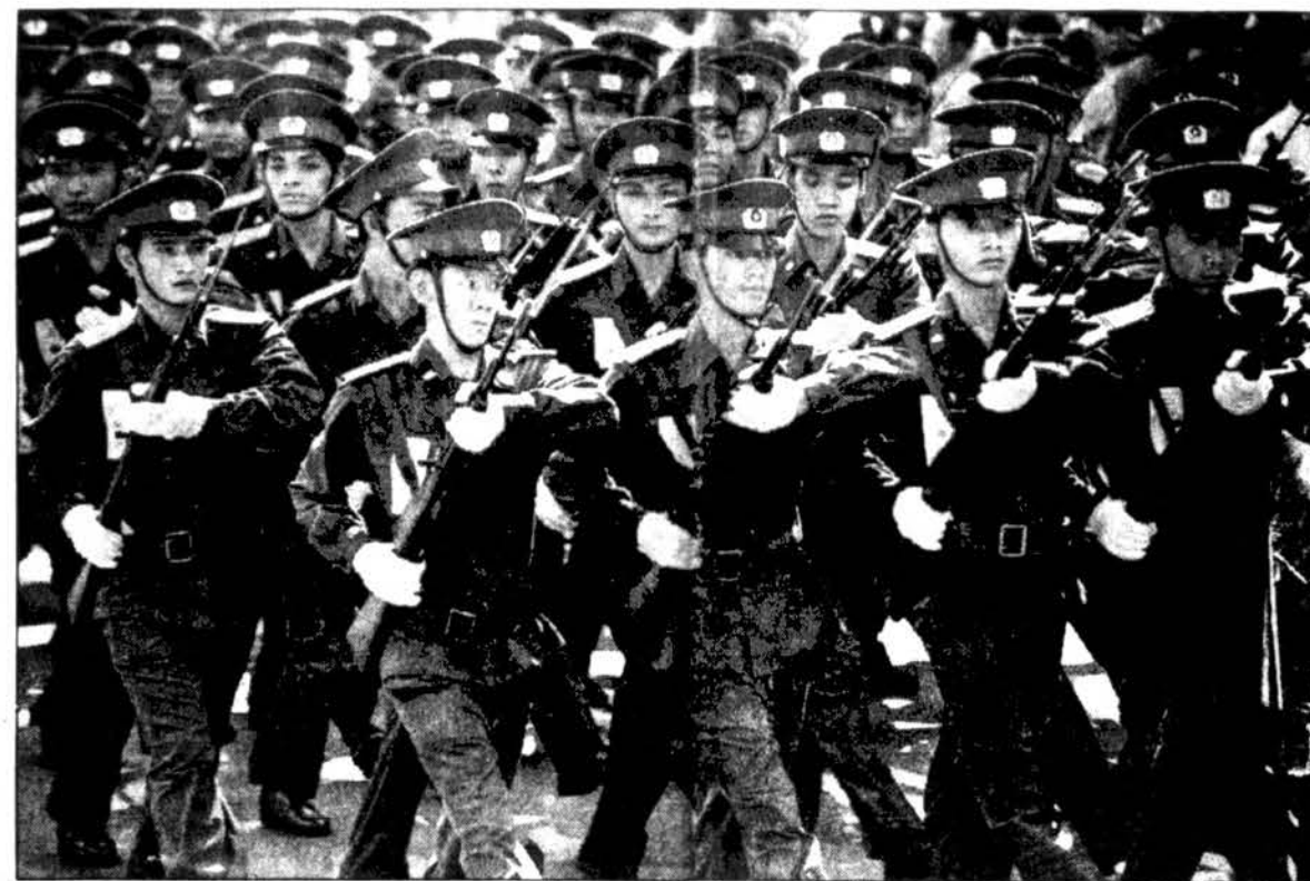
Praejusį sekmadienį Vietnamo sostinėje Ho Či Minh mieste, buvusiam Saigone, įvyko 20 metų sukakties Vietnamo karo pabaigos paminėjimo iškilmes. Parade dalyvavo 10,000 kariuomenės studentų ir vaikų. Prieš 20 metų komunistų tankai dundėjo sostines pagrindine gatve ir važiuodami pro vartus į prezidentūrą, nugriovė juos ir perėmė valdžią, pradėdami padalinios šalies sąjungimo procesą. Per tą laiką komunistinė valdžia nors ir perėjo į rinkos ekonomiją, šventica komunistų pergalė, bet daugumai šio miesto gyventojų komunistų vado vardu pavadintas miestas visuomet liks Saigonu, ir jie, linksmi bendraudami su karo pabaigą atšvėsti atvykusiais amerikiečiais, dėmesį telkia į komercinę miesto ateitį, ne į skaudžią praeitį.

— Nuo 1993 metų pabaigos galioja Vyriausybės nutarimas, pagal kurį asmenys, atsiėmę savo žemę ir norintys ūkininkauti, privalo išlaikyti egzaminą ir gauti atitinkamą pažymėjimą. Egzaminą galima laikyti po šešias savaites trunkančių kursų. Be šio pažymėjimo ūkininkauti žmonės negali tikėtis kreditų iš bankų. (AGEP)