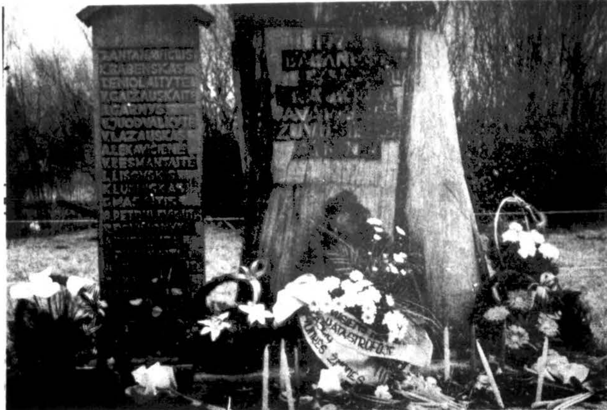
Aukų jamžinimo lentą Žasliuose, pašventinta š.m. balandžio 4 d.

K. Zubkus sakė: „Buvo tiksliai suskaičiuoti padaryti materialiniai nuostoliai, net kapeikos tikslumu. Bet niekas nesuskaičiavo, kiek čia buvo žmonių ir nukentėjusių? Nepaskaiciau, kiek čia buvo kančių, liūdesio, skausmo ir išlieta ašarų? Buvo tik šykšti žinutė spaudoje, kad Žasliuose įvyko trauki-