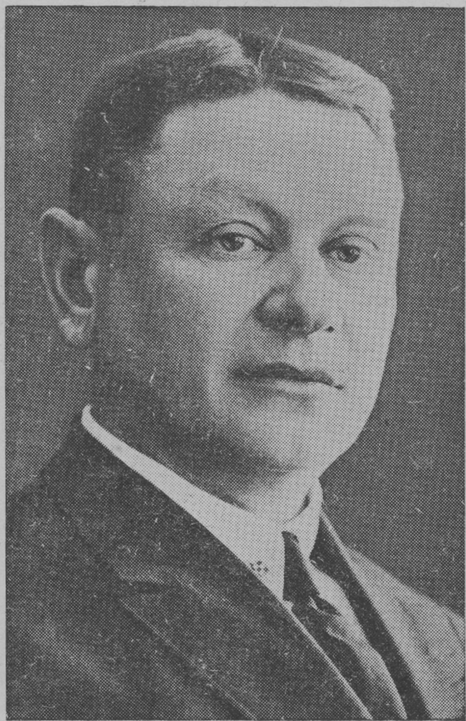
Професор Олександр Семенович Федоровський (1885—1939)