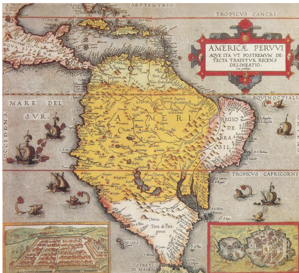
Figura 05: Americæ Peruvi a que ita ut postremum detecta traditur recens delineatio . In: Speculum orbis terrarum , Gerard de Jode, 1578

A ampliação do território peruano proporcionalmente à grandiosidade dos achados, ocupando praticamente toda a área central da América em detrimento das terras brasileiras está mais evidente ainda no mapa publicado por Gerard de Jode, em 1578, sob o sugestivo título de Americæ Peruvi . Neste mapa o Brasil parece uma península (Figura 05).