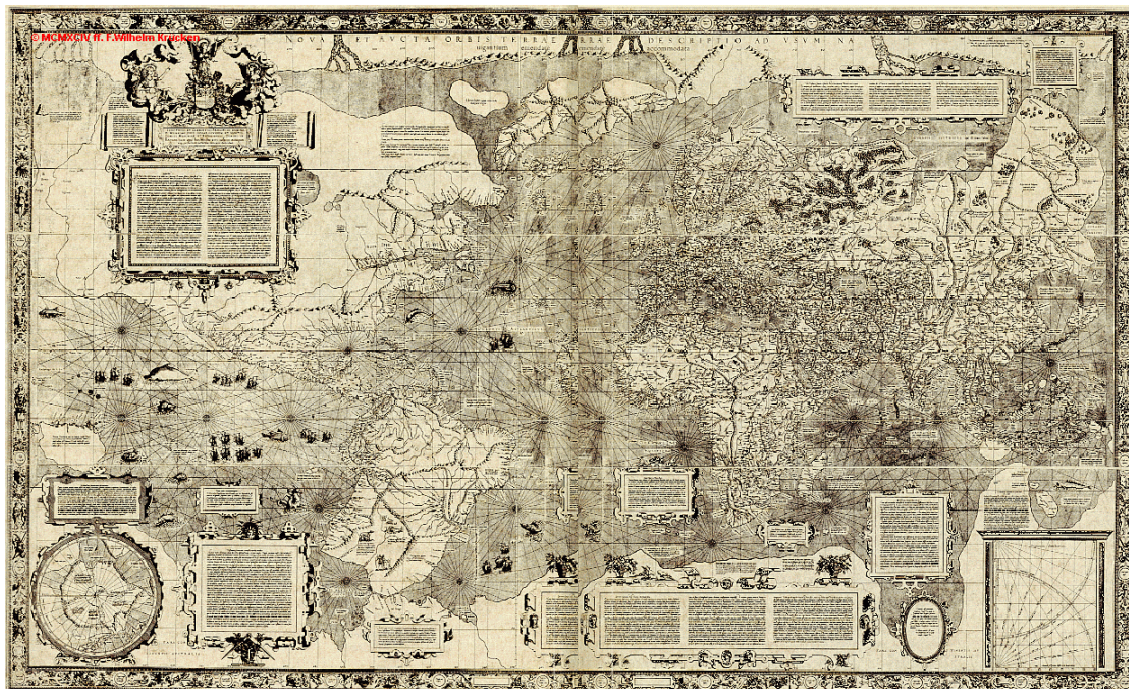
Figura 01: Nova Et Aucta Orbis Terrae Descriptio Ad Usum Navigantium emendate . Mapa-mundi de Gerard Mercator, 1569. Disponível em: http://www.lethist.lautre.net/img_cartes/mercator_1569.gif