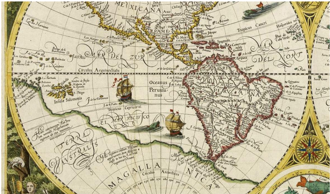
Figura 06: Parte do mapa-mundi de Arnoldus Florentinus van Langren, 1596. Disponível em: http://www.swaen.com/nf-antique-map-image-of.php?id=14618&referer=antique-map-of.php

Sérgio Buarque de Holanda em “Visão do Paraíso” cita o mapa de Arnoldus Florentinus van Langren, de fins do século XVI (Figura 06), como exemplo destas distorções gráficas, onde a terra “Peruviana” abarca praticamente toda a América do Sul (HOLANDA, 1996, p.92-93).