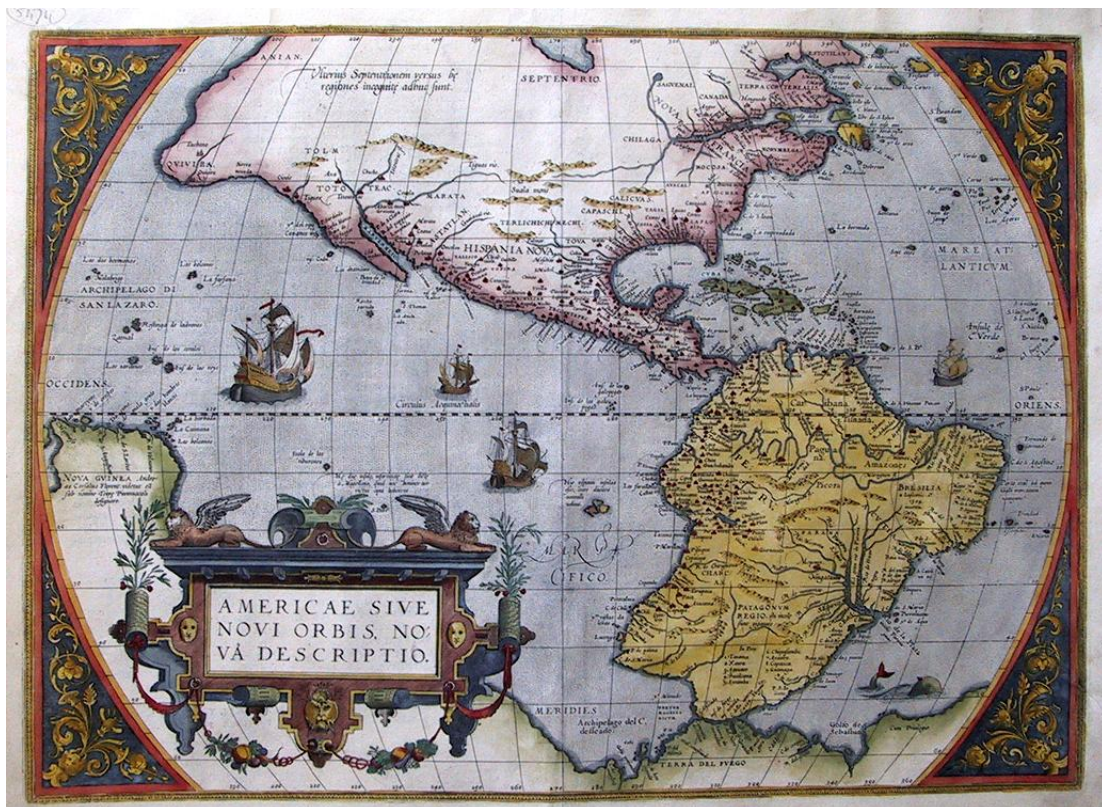
Figura 03: Americae Sive - Novi Orbis, Nova Descriptio . Nova descrição da América ou Novo Mundo, Abraham Ortelius, 1579. Disponível em http://www.orteliusmaps.com/images/5474.htm

Esta mesma configuração está presente nas obras de Abraham Ortelius, como pode ser visualizado no mapa Nova descrição da América ou Novo Mundo (Figura 03), que integrou todas as edições do Theatrum Orbis Terrarum até 1624, revelando forte influência do mapa de Mercator.