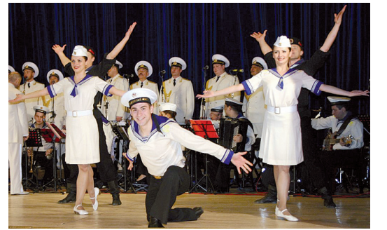
Выступает Ансамбль ДКБФ.

31 декабря, 1, 2 и 3 января в основных гарнизонах Балтийского флота, а также Светлогорском военном санатории пройдут традиционные праздничные представления с участием Снегурочки и Деда Мороза. С новогодней программой перед военнослужащими выступят артисты Ансамбля песни и пляски ДКБФ, а также выездная концертно-художественная бригада Драматического театра Балтийского флота. 4 января к