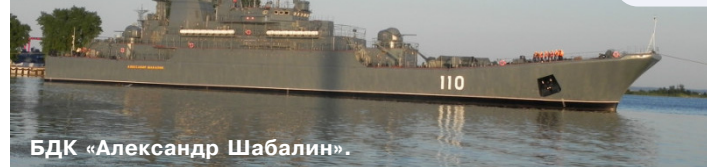
БДК «Александр Шабалин».

Далеко не все военнослужащие Балтийского флота отметят Новый год в кругу семьи и друзей. Увы, ничего не поделаешь, но военная служба для человека в погоне всегда считалась превыше всего.