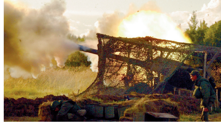
Практические стрельбы артиллеристов Балтфлота.

В целом военнослужащие Балтийского флота на условиях плацдарма выполнили самые разные задачи. Были задействованы оперативно-тактические комплексы «Искандер М». Почти на неделю Калининградская область превратилась в единый театр военных действий. По приказу Верховного главнокомандующего Вооруженными Силами страны была проведена внезапная комплексная проверка боеготовности частей Западного военного округа и Балтийского флота. Оценивались боеготовности группировки войск ЗВО, ее возможности по обеспече-