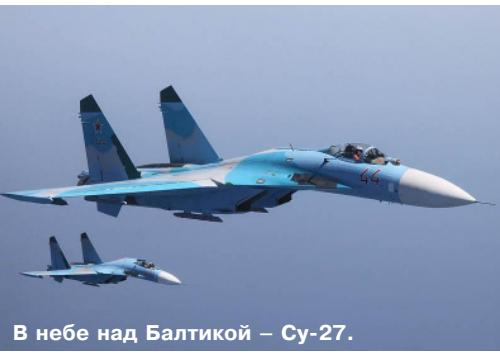
В небе над Балтикой — Су-27.