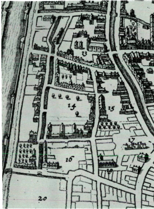
Figuur 3. Detail van de kaart van Thomas Thomaszoon uit 1578, getekend na de stadsbrand van 1576 (Gemeentearchief Haarlem).

Van west naar oost zijn de Burgwal, de Voldersgracht en de Oude Gracht te onderscheiden. Duidelijk zichtbaar zijn enkele van de langgerekte percelen aan de westzijde van de Gasthuisstraat. Verder zijn enkele van de stegen en de aaneengesloten bebouwing aan de westzijde van de Voldersgracht te zien, hetgeen overeenstemt met de veronderstelde verkaveling.