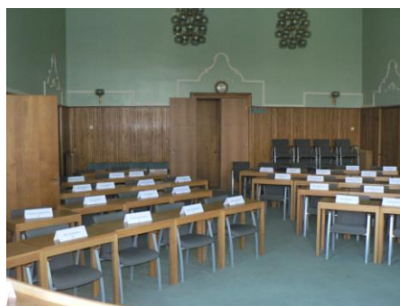
Tingshuset möblerat för kommunfullmäktige.

På vänster sida ligger Tingshuset. Mellerud blev ordinarie tingsplats i Nordals Härad 1647. Det nuvarande Tingshuset invigdes 1909. Idag är det en möteslokal och används bland annat av kommunfullmäktige. På övervåningarna finns sedan 1985 Melleruds Museum. Där finns utställningar kring centralortens historia. Högst upp finns också ett släktforskningscenter.