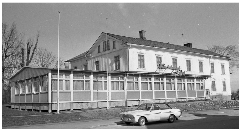
Wärdshuset på Dal som det såg ut före branden 1999.

Till vänster ligger Café Gruzzolo och Wärdshuset på Dal. Det är restaurang, nattklubb och hotell.