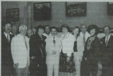
ТР Премьер-министр урынбасары—Мәдәният министрлары Зилә Валиева язучылар белән.

В.Имамовның "Тозлы яра" романы әдәбият белән тарих синтезына омытылып язылган. Уйланма һәм документаль фактларның чигендә урнашкан тормыш моделә, әдәби чыбарлык булудан бигрәк, тарихи хакыйкәт кебек кабул ителә. Әмирнең яшәү һәм үлем вакыйгаларын коләчләп алган ике китап сюжеты, асылда, кеше тормышы тарихы түгел, ул 1922–39