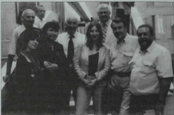
Корылтайда катнашучылардан бер төркем.

руллинга 60 яшь тулу унае белән язылган “Аны бел-әбәзме?” язмалары сәнгати осталыкны билгеләү жәһәттеннән язылган. Дискуссия унае белән дөнья күргән “Гасырлар чатында” мәкаләсендә хәзерге прозадагы табыш-яналыкларны билгеләү белән бергә, конструктив, дәлилле, ышандыра торган тәнкыйть тә урын алган. Р.Сверигинның әлеге язмасы сәнгатилек мәсьәләләрен калкытып куюу, әсәрләргә эстетика таләпләреннән чыгып бөя бирүе белән үзенчәлекле.