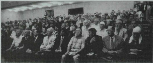
Корылтай залының гомуми күренеше.