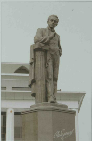
2005 елның 12 августында Казанда бөек композитор Салих Сәйдәшевкә һәйкәл ачылды. С. Исхаков фотосы.