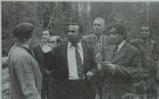
Коми АССРда үткәрелгән Совет әдәбияты көнларе истәләсе. Уртада — Гәриф Ахунов, белорус язучысы Микола Аврамчик, адыгей шагьйре Исхак Машибаи. 1974 иче ел.