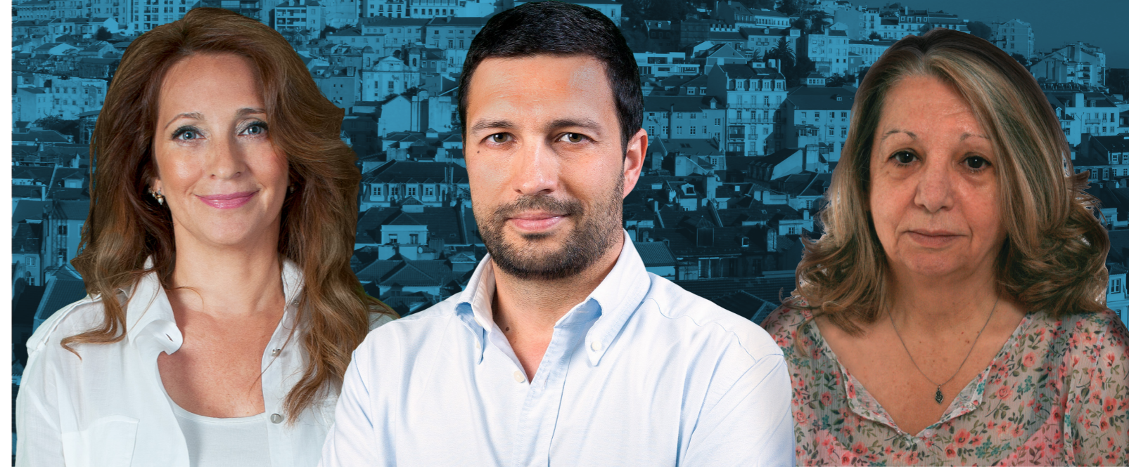
Ana Margarida de Carvalho Candidata à Assembleia Municipal de Lisboa