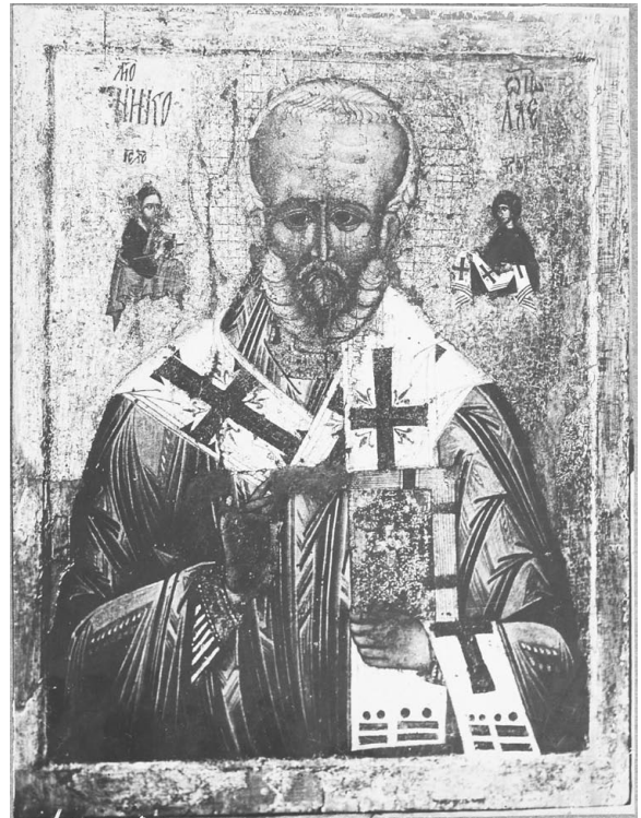
Іл. 3. Ікона св. Миколи Мокрого. XII ст.? Фото 1924 р.

Під час перебування у 1655 р. у Києві Антіохійського патріарха Макарія, його син Павло описав Софійський собор. У ньому він бачив також і вівтар в ім’я святого Миколи на хорах церкви [17, 71]. Однак сама ікона чомусь не привернула його уваги. Першу достовірну згадку про ікону знаходимо під роком 1689-м у заповіті Київського митрополита Гедеона (князя Святополка Четвертинського). В остан-