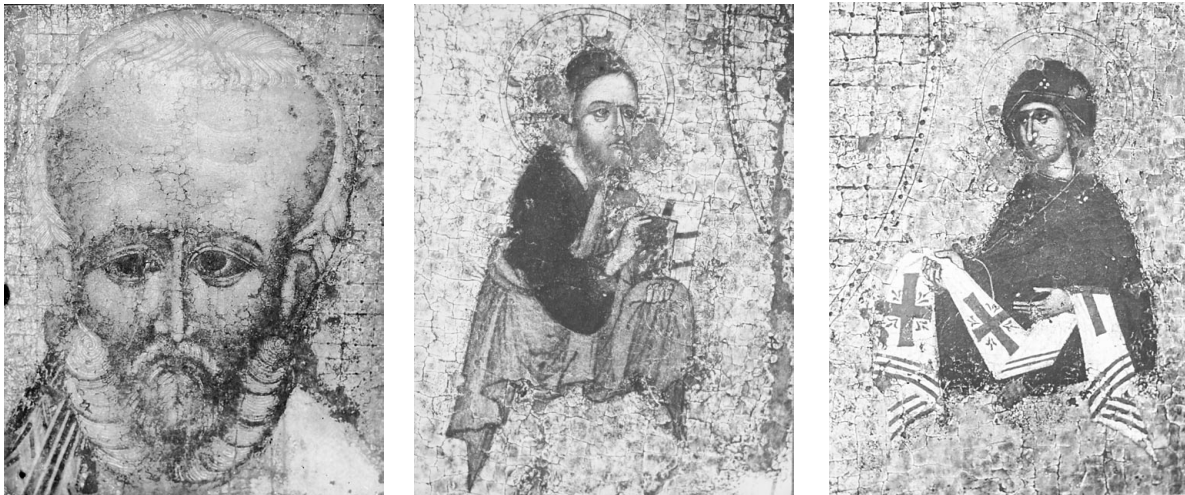
Іл. 4. Фрагменти ікони: а) лик св. Миколи Мокрого; б) зображення Ісуса Христа; в) зображення Богоматері. Зйомка у штучному освітленні. Фото 1924 р.

сили срібною золоченою ризою, а трохи згодом і срібною короною [18, 49]. Про це є інформація в описах ризниці храму.