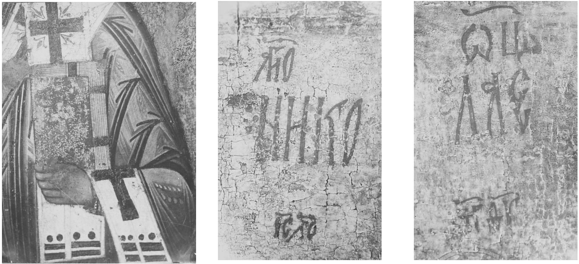
Лл. 5. Фрагменти ікони св. Миколи Мокрого: а) зображення лівої руки з Євангелієм; б-в) зображення написів. Фото 1924 р.