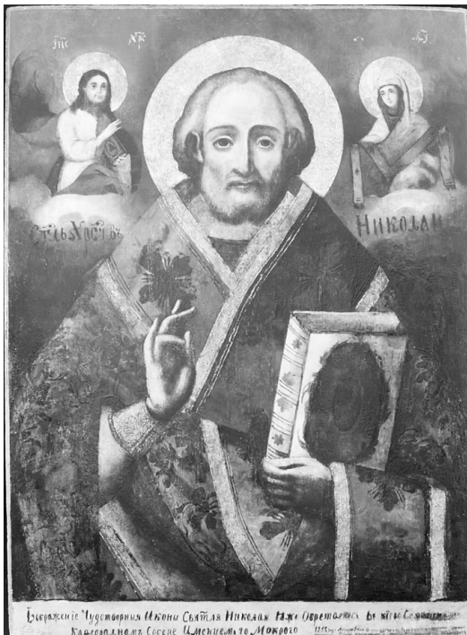
Іл. 1. Копія ікони св. Миколи Мокрого. Київщина, 1852 р. Фото 2014 р.