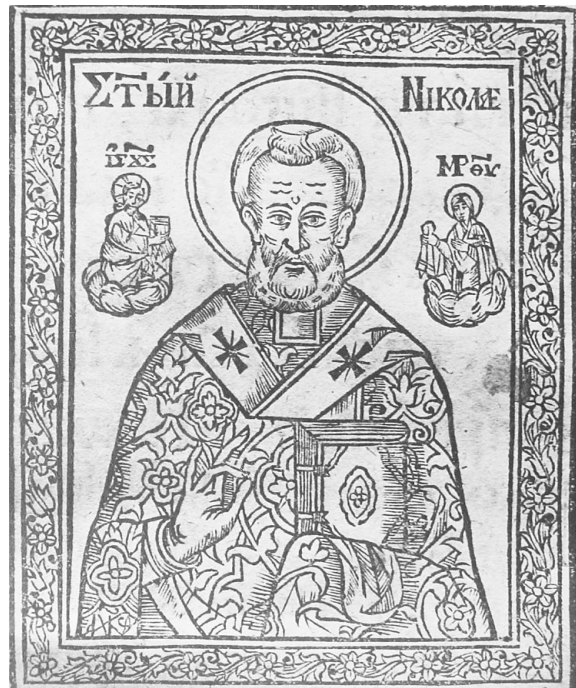
Іл. 2. Гравюра із зображенням св. Миколи з книги "Пречистые Акафисты". Друкарня Києво-Печерської лаври, 1629 р.

чотирма своїми іконами із зображеннями цього святого. Три з них також названі стародавніми, а четверта походила із старовинної дерев'яної церкви на Аскольдовій могилі [4, 22–23].