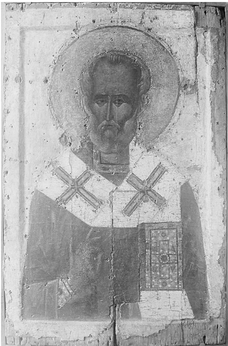
Іл. 6. Ікона св. Миколи Пустинського. XII ст. Фото 1920-х років. Після реставрації.