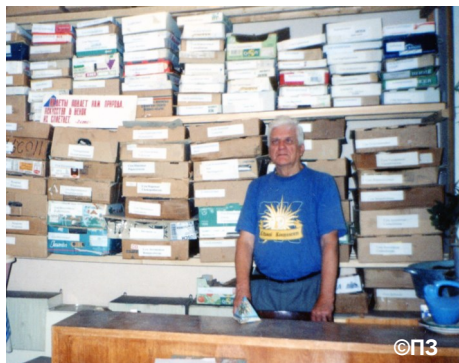
В запасниках музея

учениками обычно отправлялся во время школьных каникул. С сачком и со всем инструментарием, в том числе и с фотоаппаратом наперевес. Сотни поездок по Коми, Союзу, России, зарубежью. Он побывал во Вьетнаме, Северной Корее и Болгарии. О тропиках он мечтал с детства и с теплотой вспоминал свое путешествие во Вьетнам. Там ему запомнилась ловля насекомых прямо на дороге и как следствие – километровая пробка. «И только когда я уложил стрекозу в пакетик, все заулыбались и поехали», – писал он.