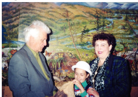
Любимое детище К.Ф. Седух – музей «Природа Земли»