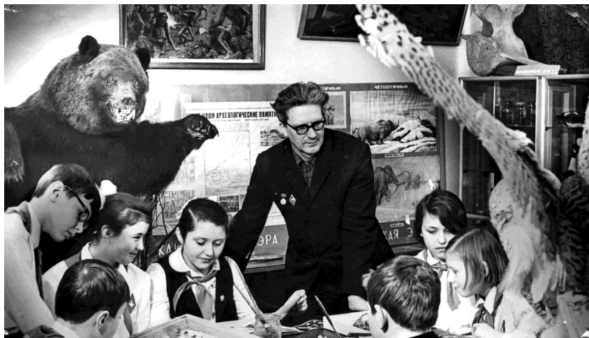
С краеведами-кружковцами в стенах Дома пионеров (1960-е гг.)

Коллеги вспоминают, что он был неутомимым, постоянно путешествовал, вечно что-то писал, плотничал, делая музейные витрины и стеллажи своими руками, чтобы можно было побыстрее расставить добытых бабочек, жучков, паучков и показать их детям. Биолог даже чучела зверей и птиц делал сам. Он учил своих воспитанников творчески мыслить и не лениться. Недаром на эмблеме музея красовался трудолюбивый муравей. Предприимчивый педагог увлек не только школьников и коллег, но и многих ухтинцев, которые со всего мира привозили в музей экспонаты.