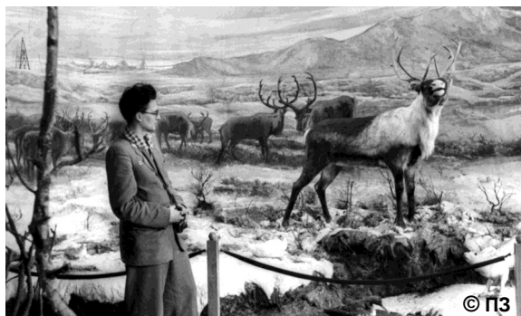
В Национальном музее РК (1950-е гг.)