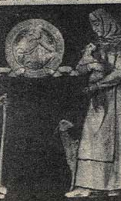
«Копьенница-охотник» — скульптура для Химкинского вокзала. Работа М. Ф. Листопада.