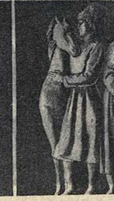
«Копьенница-охотник» — скульптура для Химкинского вокзала. Работа М. Ф. Листопада.