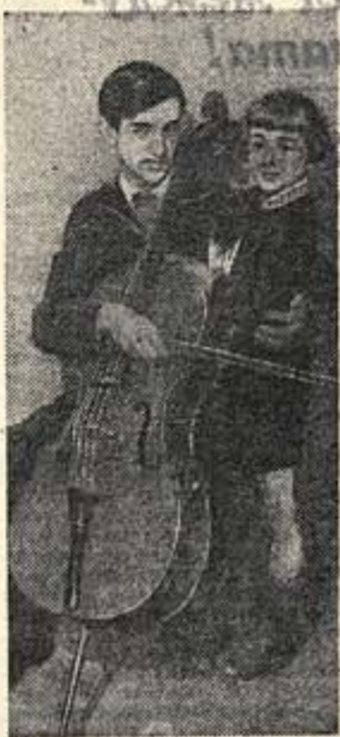
Один из лучших исполнителей пианино Олег КАРАВАЙЧУК и виолончелист Дани ШАФРАН