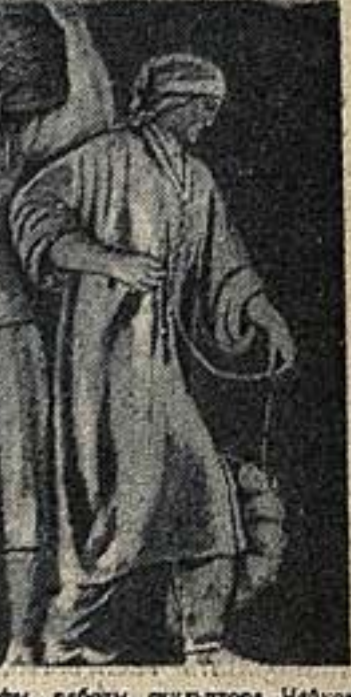
«Копьенница-охотник» — скульптура для Химкинского вокзала. Работа М. Ф. Листопада.