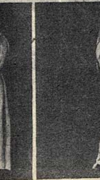
«Копьенница-охотник» — скульптура для Химкинского вокзала. Работа М. Ф. Листопада.