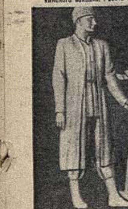
«Копьенница-охотник» — скульптура для Химкинского вокзала. Работа М. Ф. Листопада.