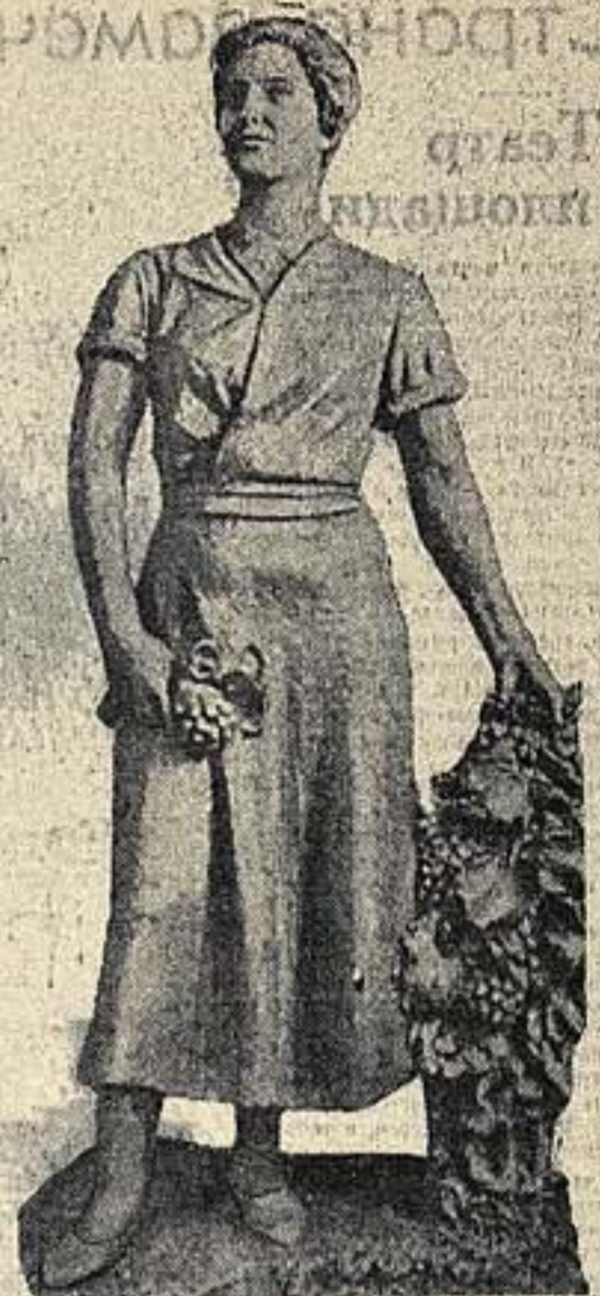
Канал Москва — Волга. «Копьенница-виноградница» — скульптура для Химкинского речного вокзала. Работа М. Ф. Листопада.