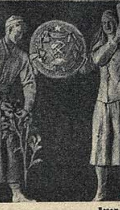
«Копьенница-охотник» — скульптура для Химкинского вокзала. Работа М. Ф. Листопада.