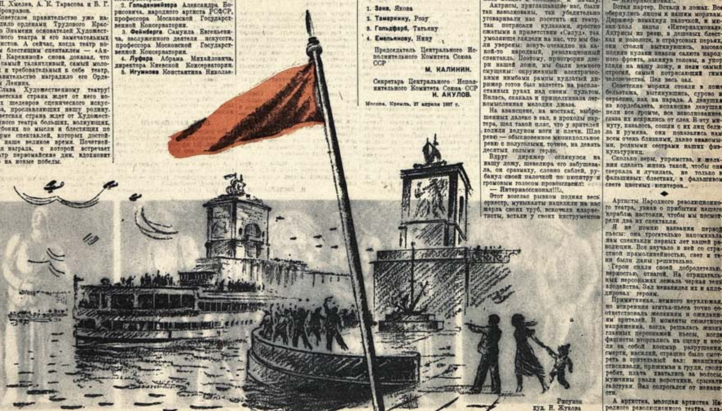
Рисован худ. Н. Жукова