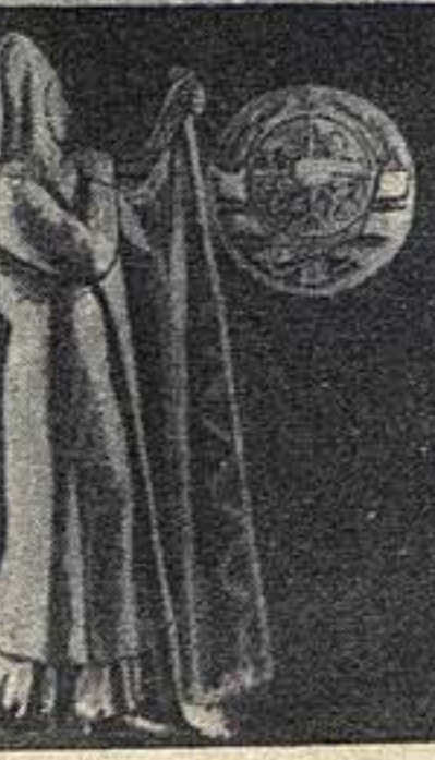
«Копьенница-охотник» — скульптура для Химкинского вокзала. Работа М. Ф. Листопада.