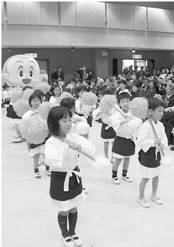
新幼稚園・草内保育所園児が一休さんやキララちゃんと一休音頭を披露