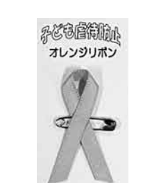
オレンジリボンを身に付け、児童虐待防止の推進にご協力ください

▼12月4日(日)…次郎物語▼18日(土)…地下鉄(メトロ)に乗って いずれも午前10時30分から。