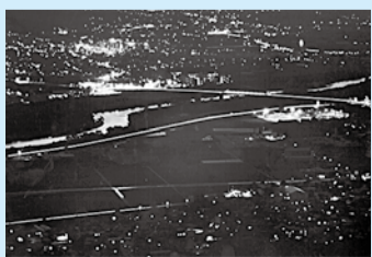
大賞「輝く京田辺」市の夜景を撮影した作品