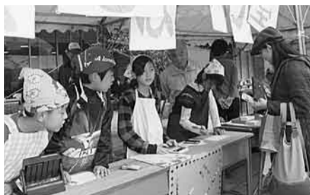
同志社京田辺祭「まなびば」が出版 オリジナルパンを販売

遺族が年金として受給する生命保険金などのうち、相続税の課税対象となった分は、所得税の課税対象外になりました。これにより、平成17年分から同21年分までの各年分、納め過ぎている所得税を還付します。還付には手続き(更正の請求・確定申告など)が必要です。平成17年分の期限は今年12月末までですので、早めの手続きをお願いします。 また、受け取った年金の受給権が相続税や贈与税の課税対象となる場合は、実際に相続税や贈与税の納税額が生じなかった人も還付の対象となります。 くわしくは、国税庁ホームページ(http://www.nta.go.jp/)をご覧ください。お問い合わせください。問合せ先＝宇治税務署 ☎44-4141