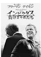
© 2009 Warner Bros. Entertainment Inc. and Spyglass Entertainment Funding, LLC.