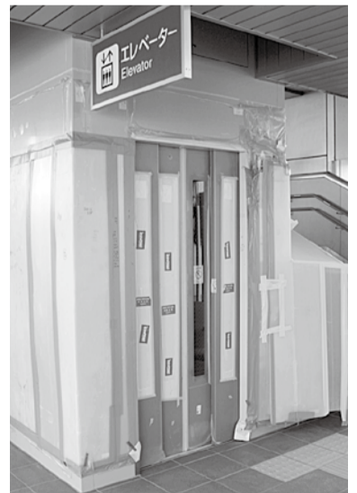
改札すぐ正面に設置されたエレベーター

JR三山木駅は無人駅ですが、JR西日本お客様センター(☎0570-00-8989)に連絡すると、駅係員のホームまでの案内や、列車への乗降の介助を受けることができます。