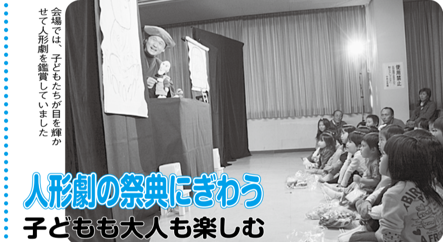
会場では、子どもたちが目を輝かせて人形劇を鑑賞していました