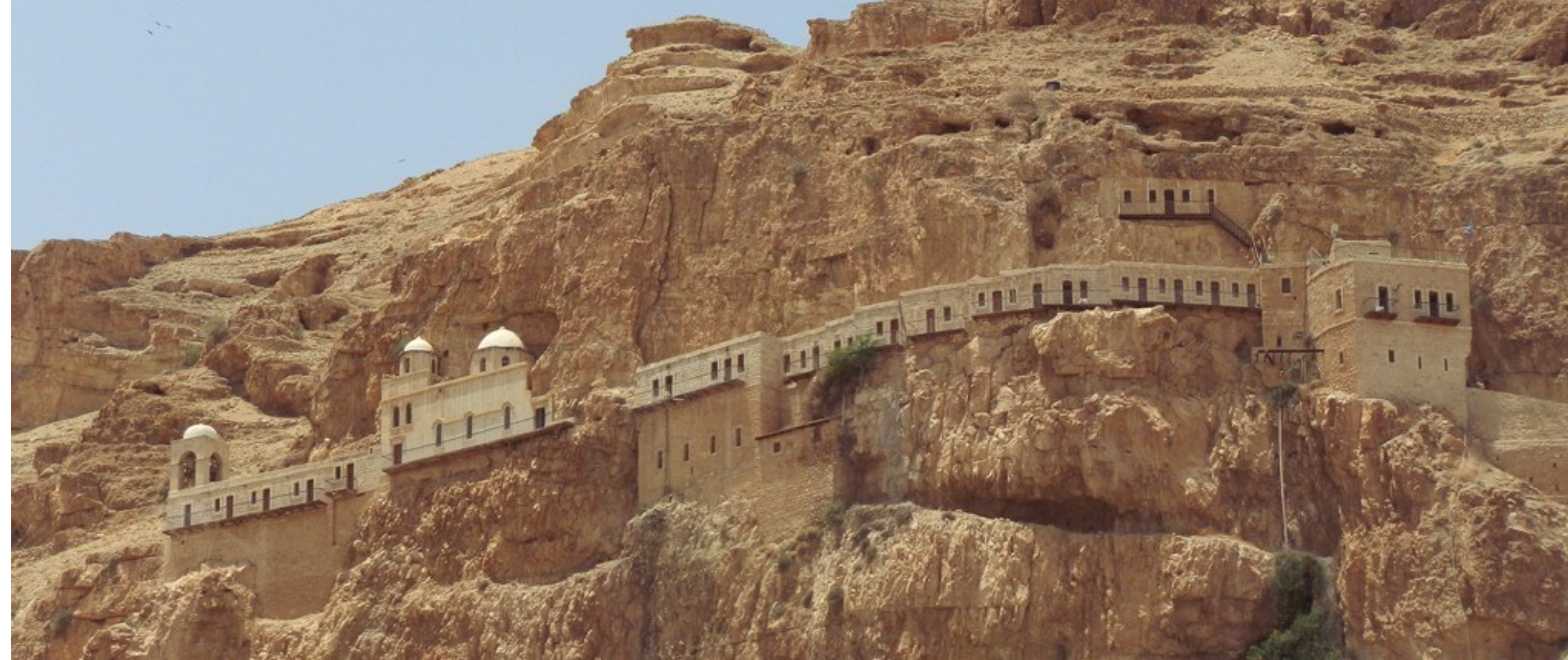
Fig. 1 - View of the Monastery of Temptation.

Standing on the tell of ancient Jericho and looking west, we can see the cliff and a monastery built on it. This is the Quruntul ("the Forty"), the Monastery of the Temptation (fig. 1). The earliest monastery was built in the 6th century (Byzantine Period) above the two caves traditionally believed to be the ones where Jesus spent forty days and forty nights fasting and meditating during the temptation of Satan, as the Gospel tells us. After baptizing Jesus, John was arrested. Jesus, taking over from him, did not immediately go up to Galilee to start his public mission. Rather, he is led by