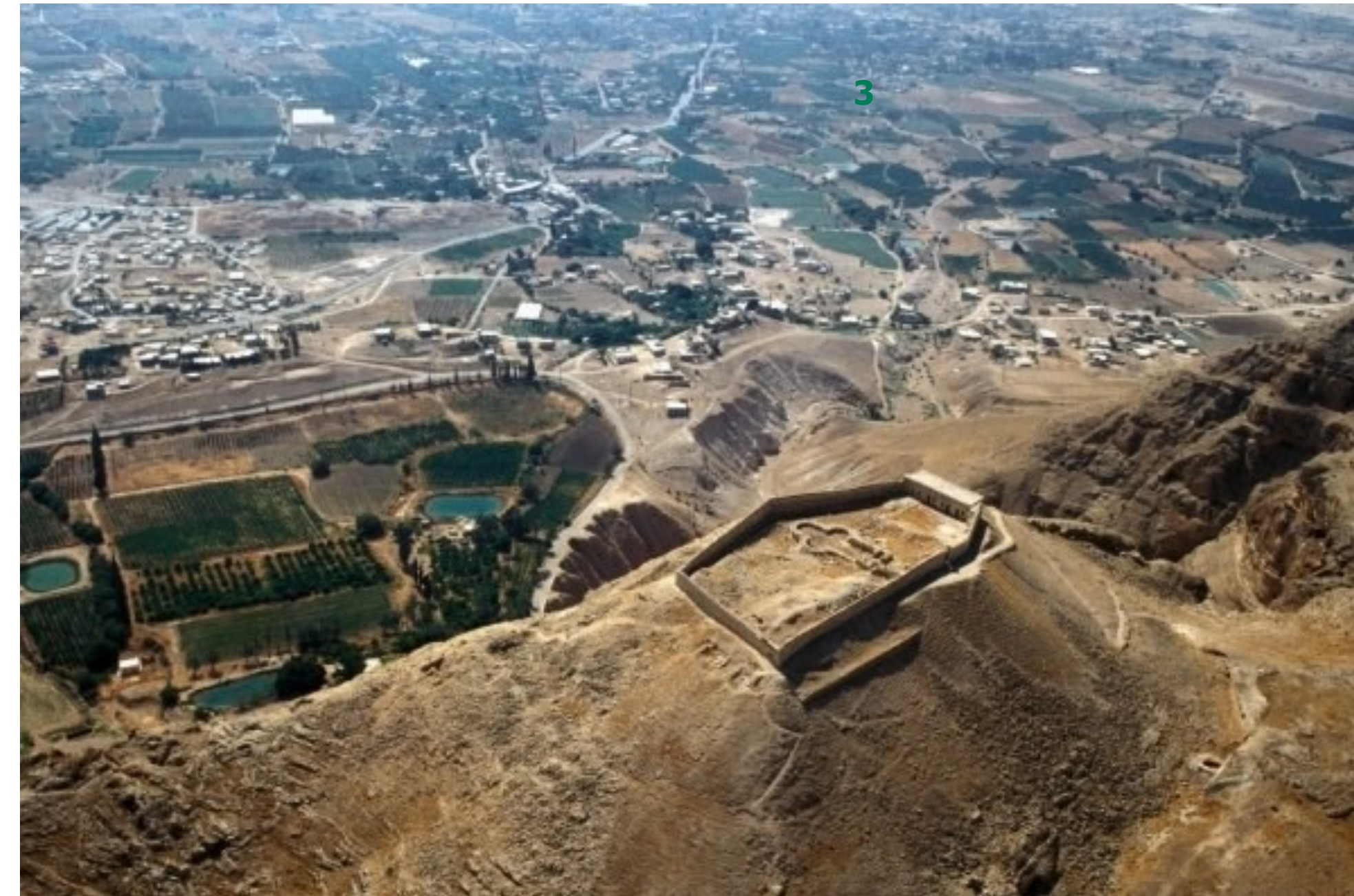
Fig. 3 - Aerial view of the fortress.

The Caves Several caves are located in the Jebel Quruntul area (fig. 4). The caves dated back from the Chalcolithic to the Islamic Period. They were used for various aims as burial caves, domestic settlements and repairs. Some of these caves where explored in 2002 during a survey in the eastern cliff of the mount. In one of these, the "El-Mafjar cave", composed by two connected chambers, was found remains related to different periods, from Chalcolithic to Islamic Period.