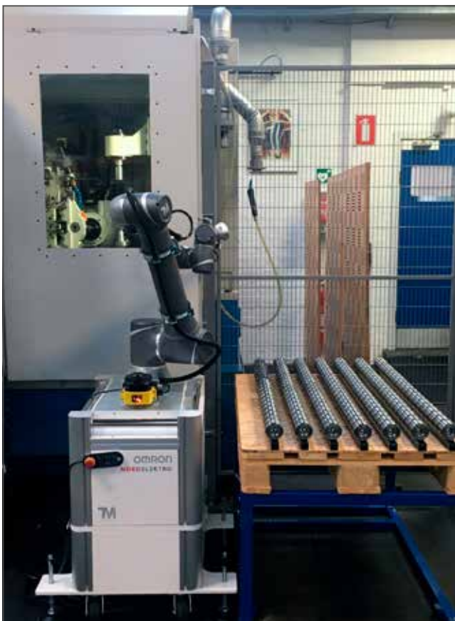
Fischer Gears ha investito in due cobot Omron TM per automatizzare l'alimentazione delle parti metalliche in quattro macchine CNC.

Fischer Gears, produttore danese di ingranaggi, ha aumentato la competitività del suo processo di produzione, specialmente sulle serie più ampie, installando due robot Omron TM. I robot collaborativi (cobot) consentono ai dipendenti esperti di concentrarsi su attività più importanti.