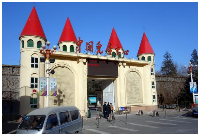
位於北京平安里西大街 43 號的中國兒童中心曾經是江青和華國鋒的官邸。

北京西城車公莊附近的中國兒童中心是中華全國婦女聯合會主辦的一個大型兒童課外活動機構。中心坐北朝南，東西長三百公尺，南北寬二百公尺，設計得像城堡一樣的大門向南開在平安里西大街上。兒童中心四周被六米多高的灰色磚牆環繞，雖然和城堡的喻意相吻合，但過往的行人還是不免對這森嚴的高牆產生一絲莫名的恐懼，似乎和天真的孩子們有點不搭配。高牆還把兒童中心東邊的鄰居包圍起來，那裡是大名鼎鼎的中共中央紀律檢查委員會（中紀委），當前中國反腐的主導機構。