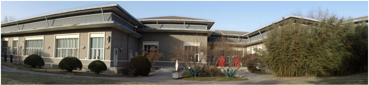
昔日的領袖官邸如今已物是人非。

巨大的鋼筋混凝土大門，裡面各種房間設備俱全。還有一條寬闊的地下馬路直通二環路上的車公莊地鐵站。英籍華人作家韓素音多年後參觀這裡時曾說：“這個地方可以和美國白宮媲美。”