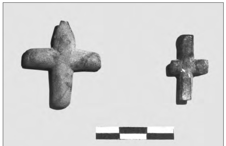
Хрестики натільні кам'яні X-XI ст.