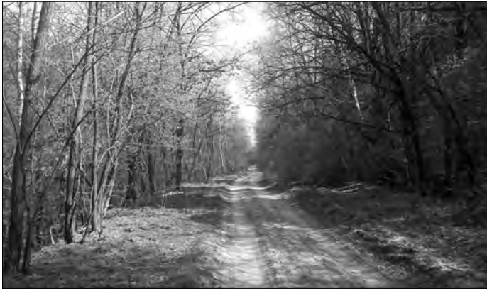
Дорога Великий прогін