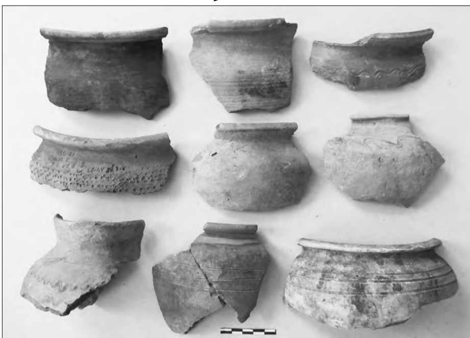
Зразки давньоруської кераміки

Щодо назви міста, то існує декілька версій. За однією з них місто було названо на честь свого засновника (Путим,