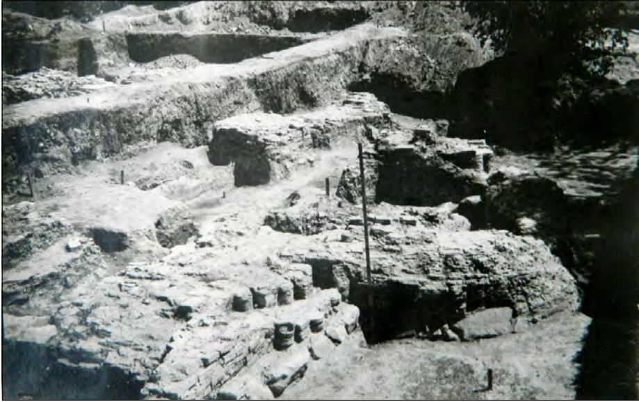
Південно-східна частина храму XII ст. Путивль, 1960 р.

Уперше Путивль згадується в Іпатіївському літописі під 1146 роком у зв'язку з міжусобною війною новгород-сіверських князів Святослава та Ігоря Ольговичів із чернігівськими князями Володимиром та Ізяславом Давидовичами. Останніх підтримував київський князь Ізяслав Мстиславович.