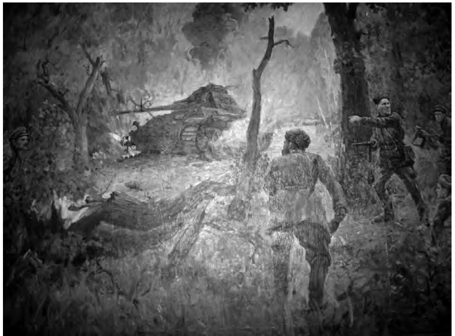
В.П. Хамко. Бій з двома німецькими танками.

Витонченістю виконання вирізняється робота знаної вишивальниці із м. Суми, заслуженого майстра народної творчості України Т.В. Левицької (1989 р). Портрет виконаний в техніці об'ємної вишивки - копія з картини видатного українського портретиста, народного художника СРСР О.О. Шовкуненка. З першого погляду можна навіть не помітити, що це вишивка: з картини дивиться на нас неначе живий Сидір Артемович.