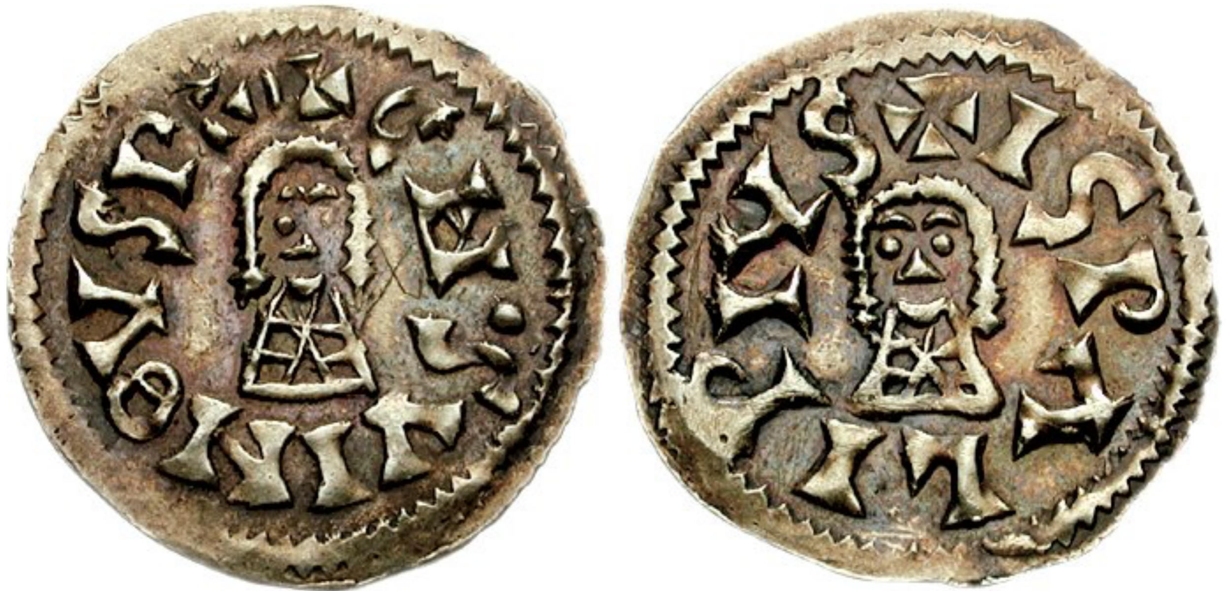
Tema 8: Reino visigodo católico de Toledo II El fortalecimiento de un poder regio de tendencia reformista