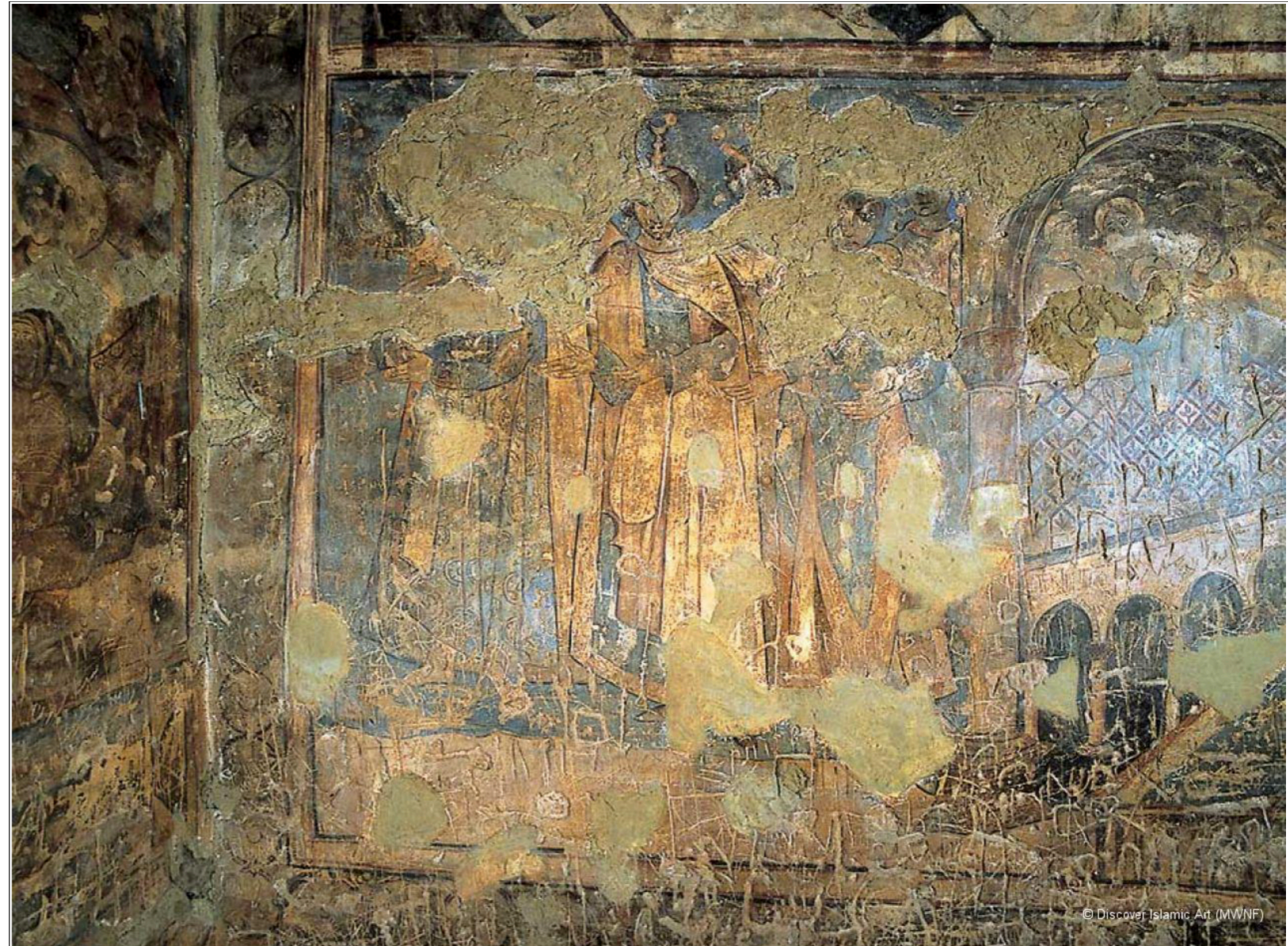
Cortejo de reyes sometidos