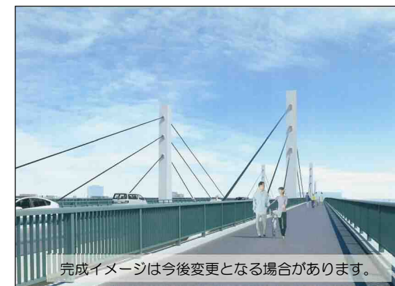
完成イメージは今後変更となる場合があります。

○令和2年度より橋りょう本体工事に着手する予定となっており、概ね令和7年度を目標に整備を進めております。