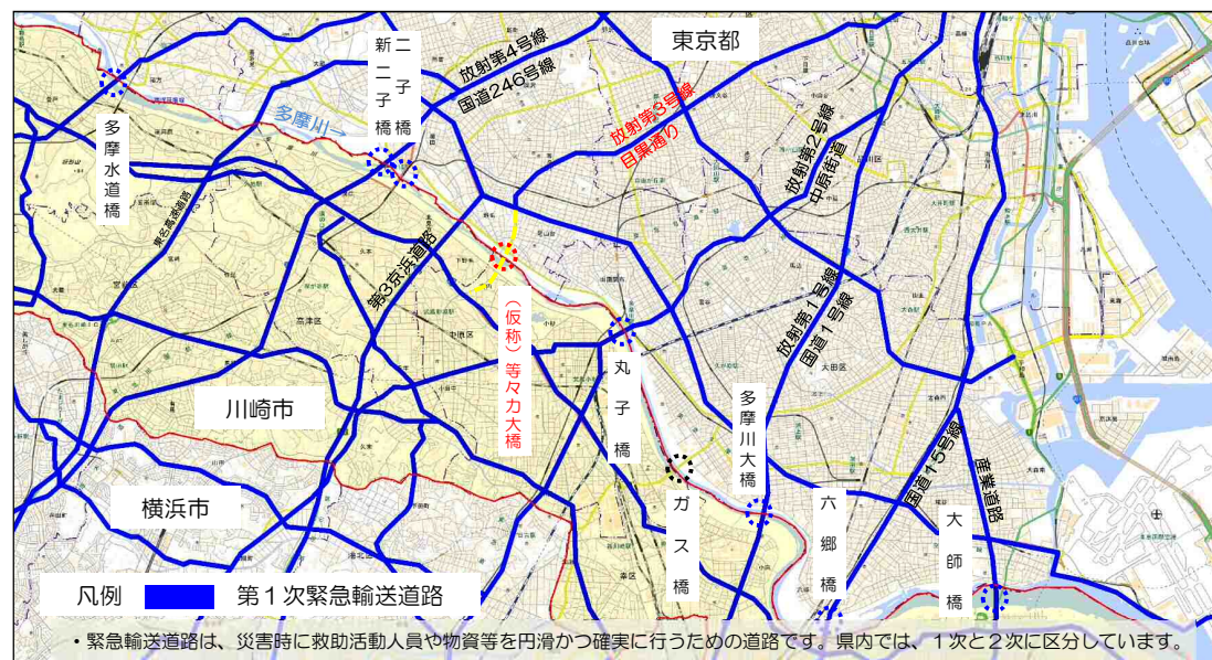
凡例 ■ 第1次緊急輸送道路

・緊急輸送道路は、災害時に救助活動人員や物資等を円滑かつ確実にを行うための道路です。県内では、1次と2次に区分しています。