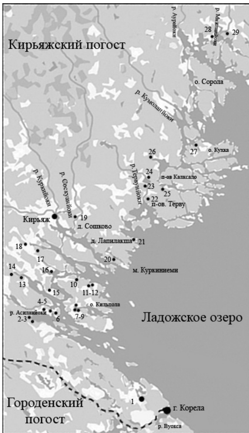
Рис. 1. Прибрежные монастырские деревни Кирьяжского погоста в конце XV в. на современной геоподоснове. Условные обозначения: Петрова М. И.