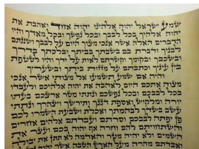
ונבדל מאד מהקלף הלבן המעובד בסיד.