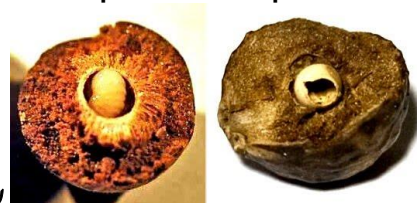
עפצים מבוקעים ומתוכם ביצה או תולעת

14. שאלה- ראיתי מי שהעיר כי מכיון שעפצים נוצרים ע"י חרקים יש בעיה בשימוש בהם בעיבוד כיון שהם לא מן המותר בפ"ך.