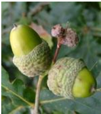
בלוטים- פרי עץ אלון