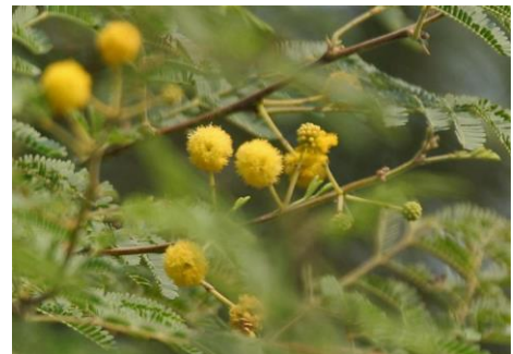
שיטת היאור - אל קראץ'

ואלו העורות הנמצאים בזמננו הידועים בצורתם, אסור לכתוב בהם דבר, לא ספר תורה ולא תפילין ולא מזוזה, לפי שהם עורות שאינם מעובדים עיבוד שלם, לפי שהם לא עפיץ . ואם עיבדו אותן בדבר מכווץ כגון עפץ ואלקרץ' וכיו"ב, אז יקרא קלף וכו'. עכ"ל.