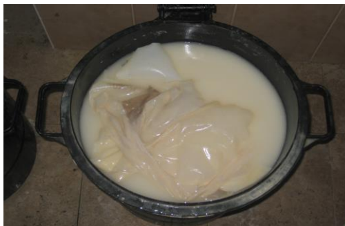
עורות במי שעורים

תהליך הפרדה זה נעשה ע"י השריית העור בתמיסת סיד, אשר עפ"י חכמת הטבע נקרא חומר בסיסי (אלקאלי) {הסיד איננו חומר טבעי, אלא הוא נוצר כתוצאה משריפת סלעי גיר בכבשן האש, מעל ל-1000 מעלות, וכך משתנה ההרכב המולקולרי שלו} ותפקידו, עפ"י טבעו, להמיס את שכבת העור העליונה ואת שרשי השערות, להמיס ולעכל שומנים וחלבונים תת עוריים לרפות ולנפח את העור באמצעות ספיגת יתר של המים לתוך תאי העור. שלב זה נחוץ כשלב הכנה ואיכשור, הוא 'מרוקן' את העור ומנקה אותו, ומאפשר חדירת החומרים העפציים בשלב הבא. בזמן התלמוד היה שלב זה נעשה באמצעות שרייה במי שעורים, הלא הוא שלב ה'קמיח'.