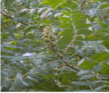
סומק-עץ אוג הבורסקאים