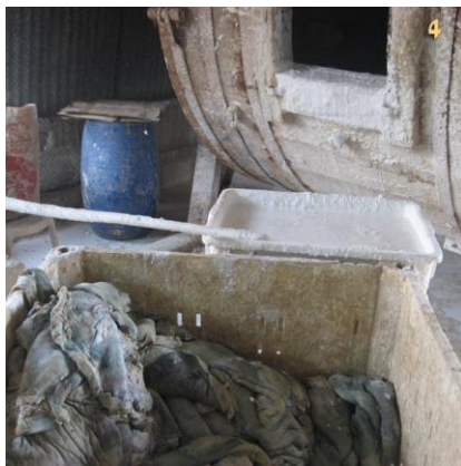
עיבוד עור בסיד

ועוד ידוע שמשתמשים בסיד להמסת עור ועצמות בתהליך יצור הגילאטין, ואף יש שציוו לשים בקברם סיד למהר עיכול הבשר (פלא יועץ-קבורה).