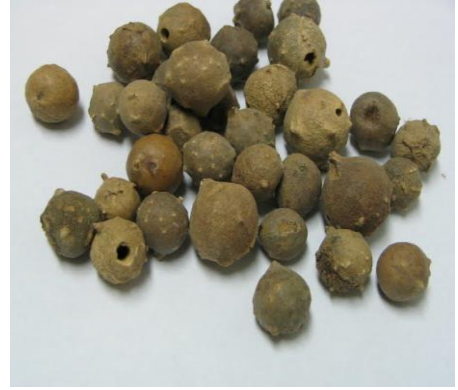
עפצי אלון (החורים מעידים על יציאת הצרעה מתוכם)