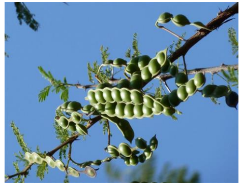
הקראץ' [נהגה-גאראד] -שיטת היאור\הנילוס

כאן המקום להסביר את המושגים-כיווץ ו-חיזוק, אשר רוב העולם טועים וסוברים כי הקלף אשר משתמשים בו לכתיבת סת"מ מכווץ ומחוזק ע"י היבוש והמתיחה שלאחרי העיבוד בסיד. וטעותם ברורה, שכיווץ וחיזוק הן פעולות שאמור החומר המעבד עצמו לפעול על העור, כמ"ש הרמב"ם- עפצא וכיוצא בו מדברים שמקבצים את העור ומחזקים אותו וכו'. ועוד יש לשים לב, שעור המעובד בתהליך עפצי, כגון עור רצועות התפילין, דווקא רך וגמיש.