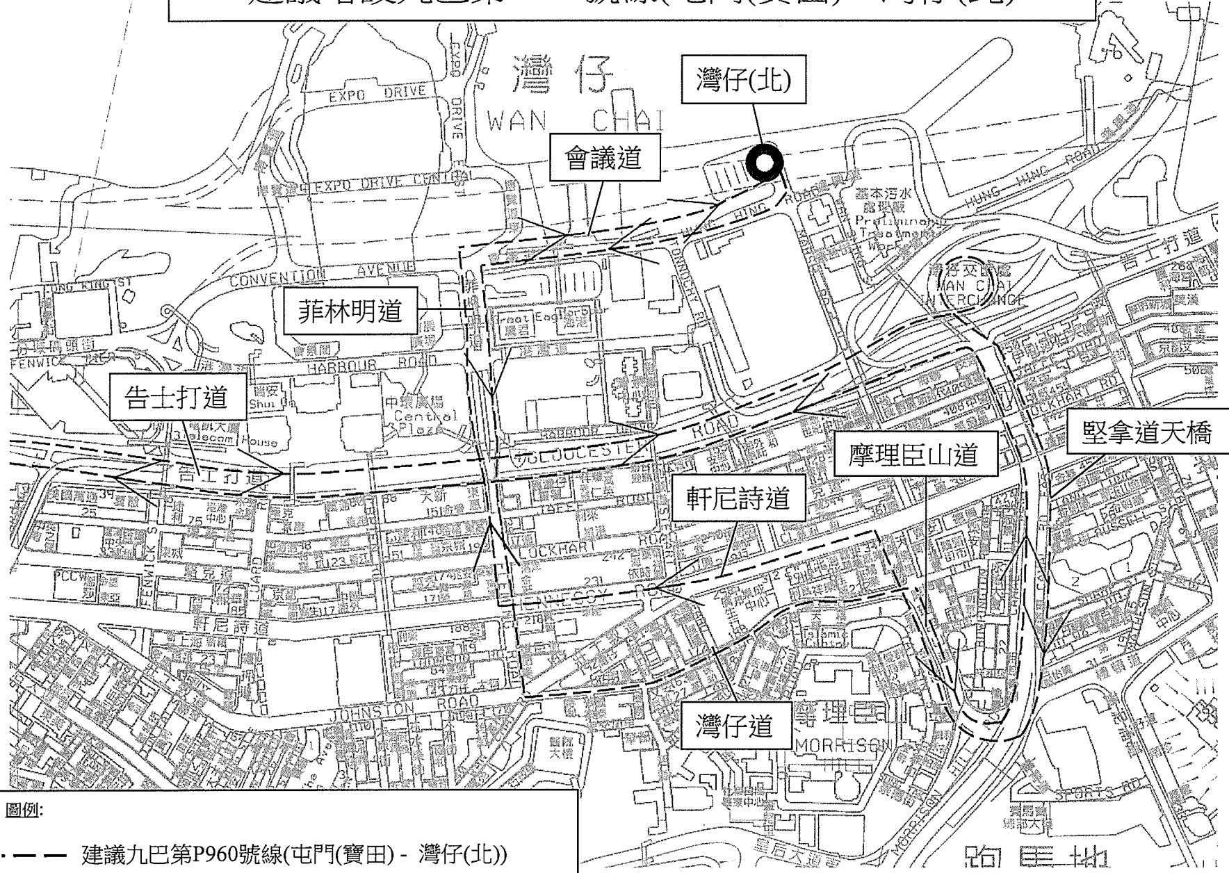
圖例: - - - 建議九巴第P960號線(屯門(寶田) - 灣仔(北))