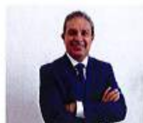
C. Jesús Guerrero Zúñiga Presidente Municipal de Zapotlán el Grande

Es el órgano de máxima autoridad del Sistema DIF de Zapotlán el Grande. En la administración 2018-2021 el Patronato está conformado por las siguientes personas: