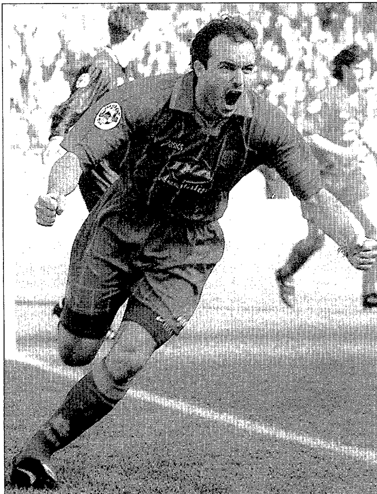
ABEL BALBO • La prensa italiana asegura que el goleador argentino de la Roma tiene una oferta del Espanyol

Por último, la prensa italiana destacaba ayer que el goleador argentino Abel Balbo puede dejar la Roma en los próximos días. Al parecer, tiene varias ofertas de varios clubs europeos, pero una muy tentadora procedería del Espanyol.