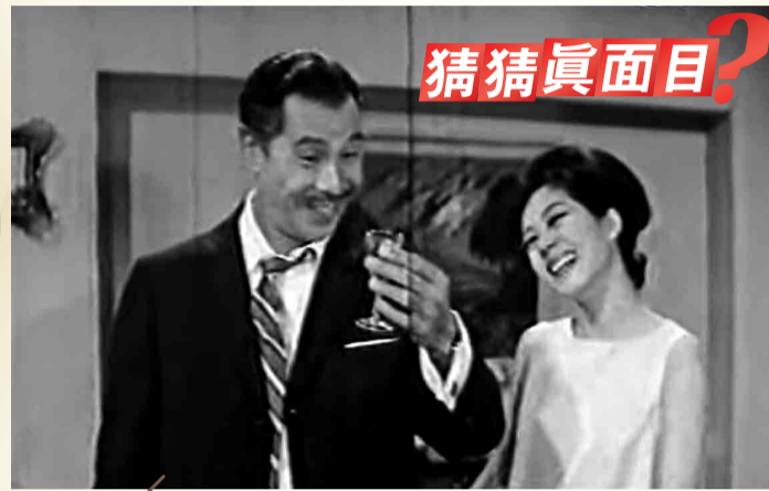
電影《大富之家》(1963)

答： 多觀察、多思考、多發問。有什麼食物/菜式長輩都很愛吃，但你與朋友從來不愛吃？為什麼？當中是否反映飲食文化、口味的轉變？例如現在人們流行「相機先吃飯」，立即上載至社交網絡，這種現象也很值得記錄！另外，小作家不妨進一步了解過去的飲食文化，再與現代飲食文化做比較，尋找靈感，皆有助提升日常觀察的敏感度。